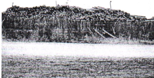
(Продолжение. Начало в №2 от 3 сентября 2009г.)