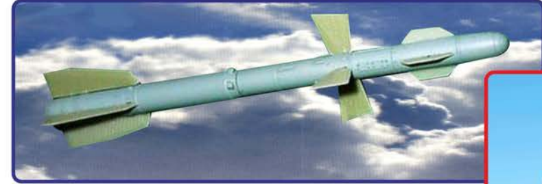
Оптична ГСН АЗ-20 для ракет середньої дальності