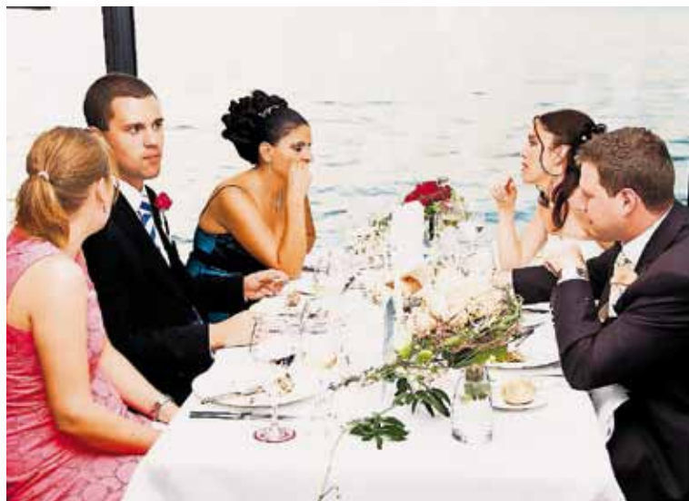
Heiraten direkt am See.

Die ungezwungene Atmosphäre in den Räumen im Obergeschoss des Seerestaurants, die kompletten technischen Ein-