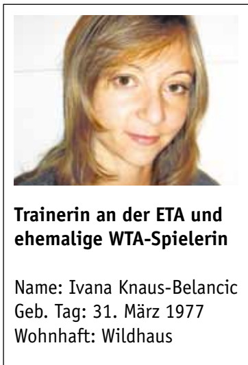
Trainerin an der ETA und ehemalige WTA-Spielerin

Im traditionsbewussten, neu renovierten Hotel Sternen in Unterwasser werden Sie sich wohl fühlen. Bei einem Aperö in der hauseigenen Vinothek präsentiert Ihnen der Hoteldirektor persönlich die regionalen Weine.