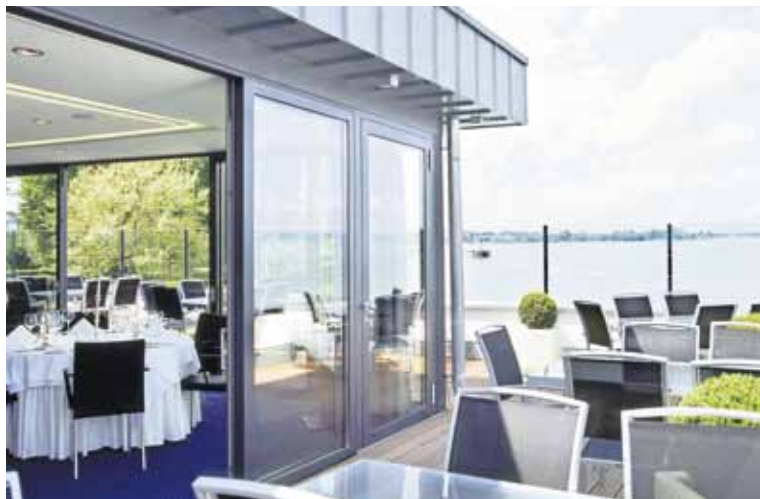
Seesicht für Ihre Gäste.

Das alles finden Sie direkt vor Ihrer Haustür, im Seerestaurant Rorschach am Bodensee. Bei einem feinen Glacecoupe, einem erfrischenden Löwengarten Huusbier mit Sicht auf den Jachthafen, einer kulinarischen Kreation im Aqua Fine Dining-Restaurant oder einem Fest in den Bankett-Sälen lässt sich das Leben wunderbar geniessen. Was gibt es Schöneres, als sich bei uns direkt am Bodensee richtig wohl zu fühlen?