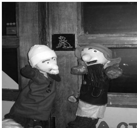
Lempäälän miehet asemalla 1