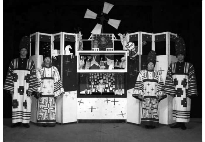
Rovnon Nukketeatteri: Jouluyö