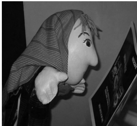
Mielenkiintoinen esite, hmmm....