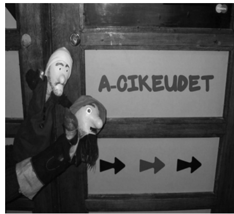
Lempäälän miehet asemalla 2