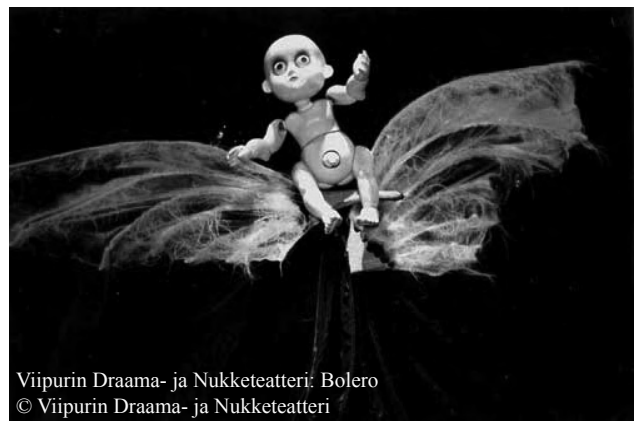
Viipurin Draama- ja Nukketeatteri: Bolero © Viipurin Draama- ja Nukketeatteri