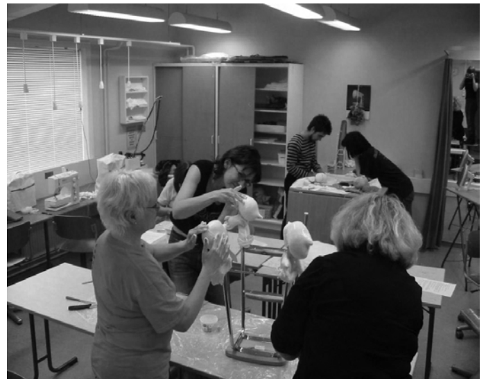
Siitä se muotoutuu