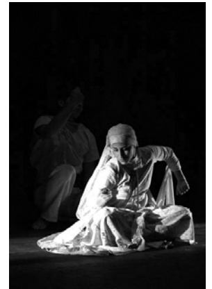
Teheran Dance Theatre: Avazhik-Made in Iran