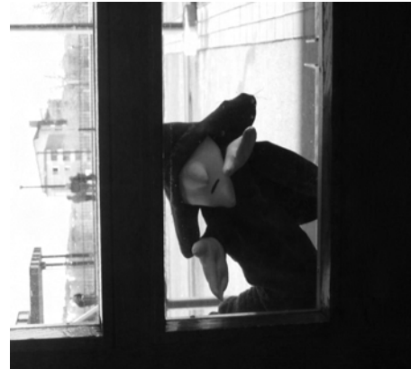
Kuolema oven takana

4. Käsinnukkekurssi pidetään Tampereen Rientolassa 29.4.2007 klo 11-19. Lehti-ilmoittelusta huolimatta paikalle tulee opettajien ja Teijan lisäksi vain neljä henkilöä, osa reilusti myöhässä. Pieni osallistujamäärä kääntyy kuitenkin eduksi, sillä varattu aika riittää hädän tuskin. Jatkoajan turvin saamme kuitenkin aikaan seitsemän selkeää ja hauskaa tyyppiä. Kiitämme lahjoittajia ja viemme nukket odottelemaan matkaa työhuoneellemme.