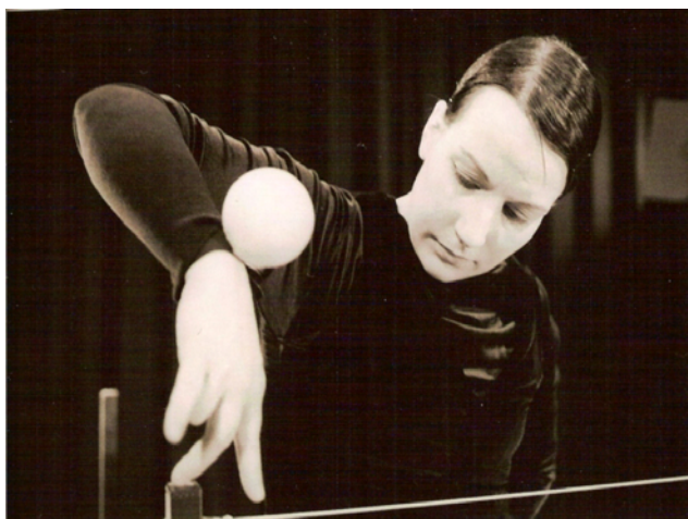
Sirkus Sipiaisen sirkusta ja nukketeatteria yhdistävä Varjoja paratiisista -esitys sai ensi-iltansa 2005 Turussa

Mielestäni painettu tiedotuslehti on yhä tärkeä viestintäkanava, vaikka internetin myötä sana ajankohtaisuus on saanut aivan uuden merkityksen. Nyt tieto kulkee vauhdilla jäseneltä toiselle esimerkiksi sähköpostiryhmien kautta. Kaksi kertaa vuodessa ilmestyvä painettu lehti ei voi mitenkään vastata tällaiseen ajankohtaisuuden haasteeseen, lehden pitää löytää jokin muu tapa olla ainutlaatuinen ja tärkeä osa suomalaista nukketeatterikulttuuria. Jokainen meistä Uniman jäsenistä voi miettiä miten lehden tulevaisuus turvataan vai onko aika jo ajanut paperille painetun tiedotuslehden ohi?