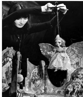
Kykoln'jy dom: Tuhkimo