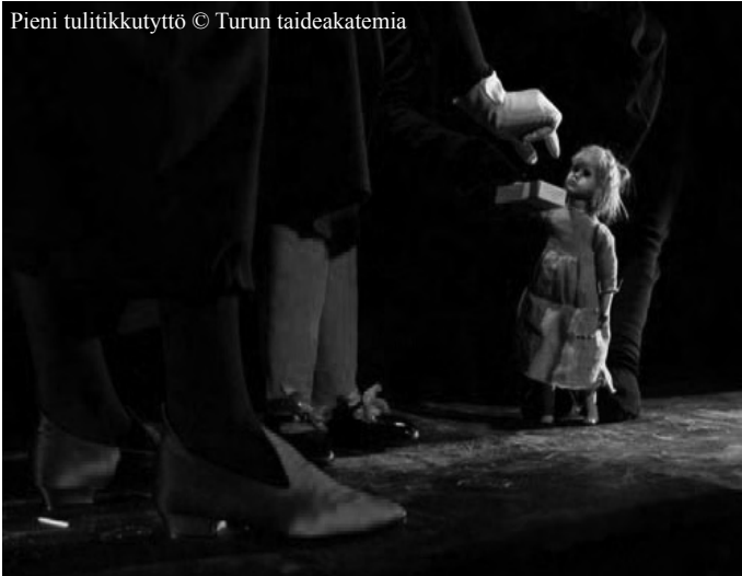
Pieni tulitikkutyttö © Turun taideakatemia