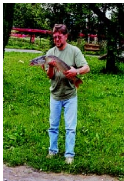
Po vítězném souboji se štikou. Měřila rovných 90 centimetrů!