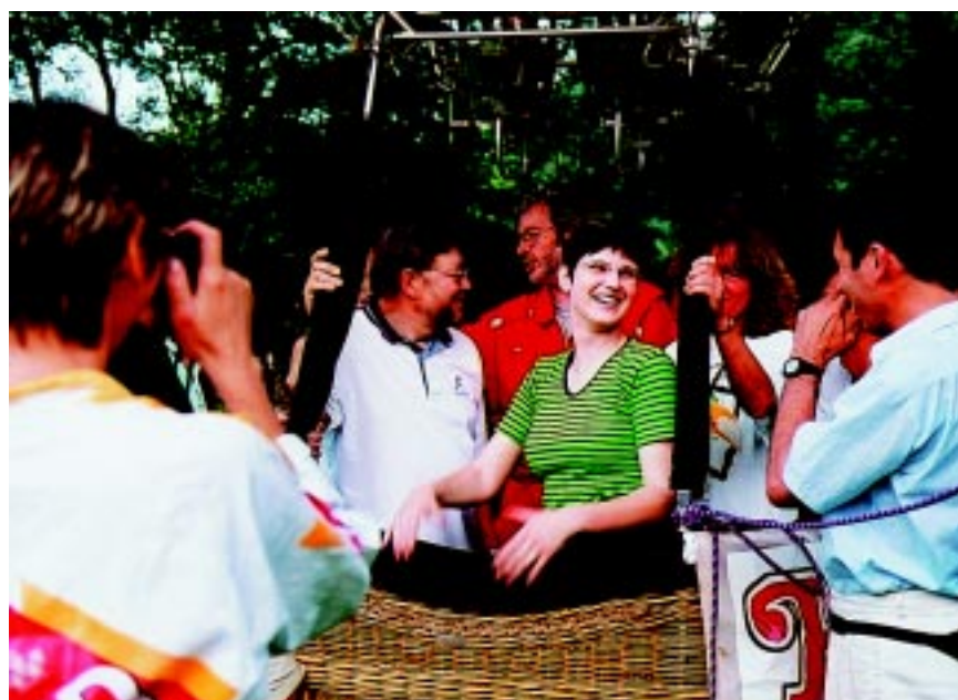
V koši horkovzdušného balónu. Létání má moc rád.