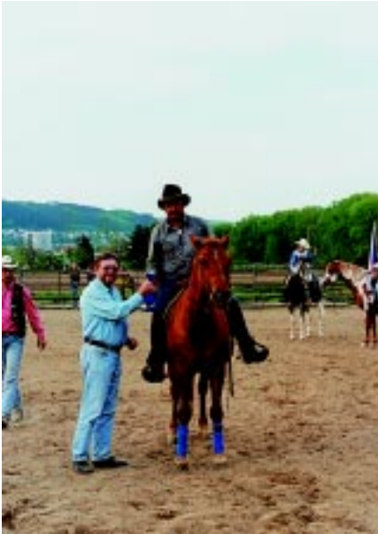
Tradiční Radotínské rodeo o pohár senátora Krámka. Letos se konalo 29. dubna.