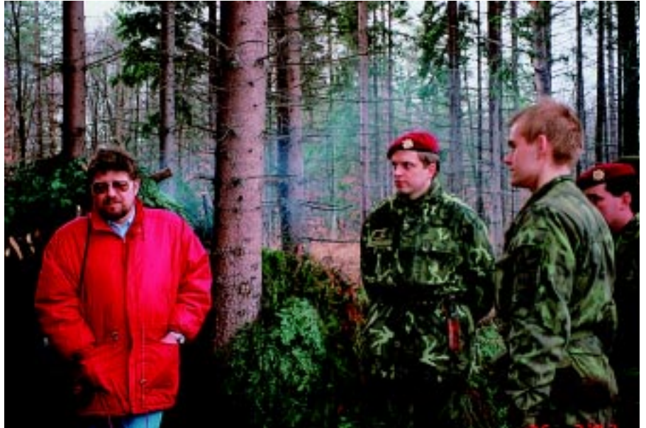
Senátor Krámek mezi vojáky, kteří právě absolvují kurz přežití.