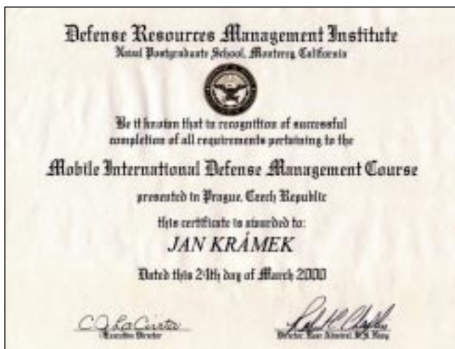
Diplom o absolvování kurzu na Ministerstvu obrany

Bylo by příliš jednoduché formulovat to jako problém této vlády. Je to zřejmě problém celé společnosti. Naprostá většina lidí spoléhá, že se něco udělá samo od sebe. Přebujelá administrativa ten problém nemůže vyřešit, naopak. Nárůst úředníků neznamená rychlejší a kvalitnější vyřizování žádostí a potřeb občanů. Spíše se stává, že jsou slušní lidé často zbytečně zatěžováni a šikanováni, zatímco ti druzí si nelámou hlavu respektováním zákonů. Skoro bych řekl, že mají snadnější život.