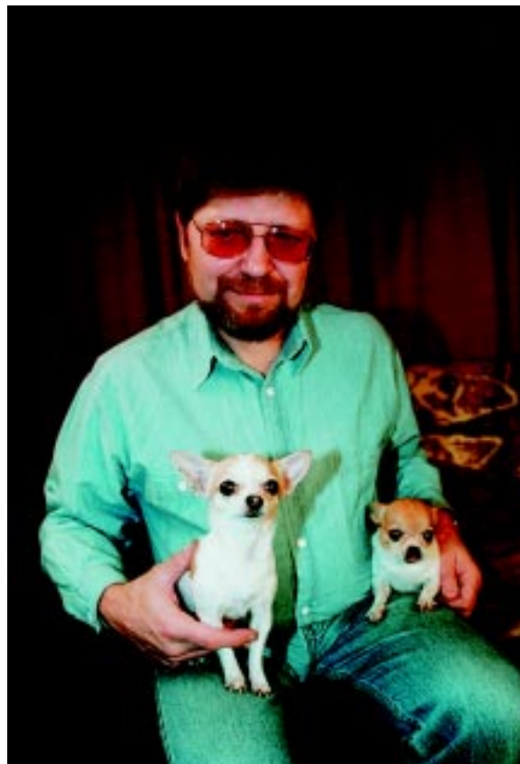
Miláčkové do dlaně. Vyrůstem nevelcí, zato dobří kamarádi.

Od roku 1990 se pohybuje mezi komunální a vysokou politikou. Ale nepatří mezi takzvané mediální hvězdy, jejichž tvář zná každý na potkání. Nehrne se do popředí. Skromnost i ochota naslouchat druhým neznamena, že neumí veřejně promluvit a prosazovat své názory. Jako senátní kandidát před prvními volbami do Horní komory Parlamentu si vytkl za cíl dát občanům jistotu a bezpečnost.