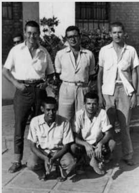
Los dirigentes de la ASU en la cárcel de Carabanchel. 1958.