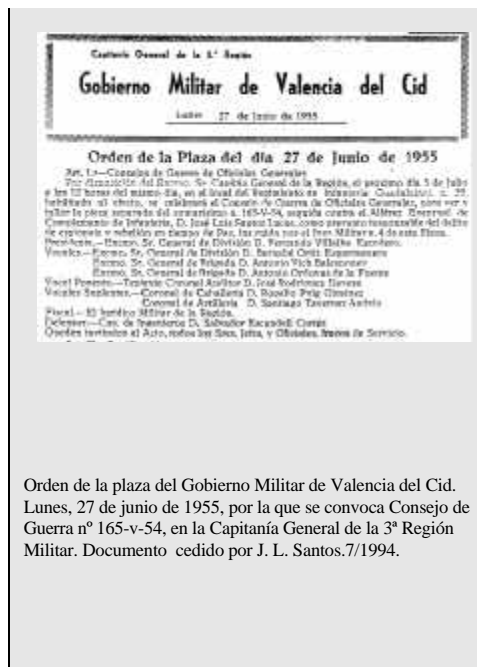
Orden de la plaza del Gobierno Militar de Valencia del Cid. Lunes, 27 de junio de 1955, por la que se convoca Consejo de Guerra nº 165-v-54, en la Capitanía General de la 3ª Región Militar.

Después se darían cuenta que de aquello nada, y poco a poco me irían rebajando los cargos, y la petición de pena. De los 30 años iniciales, pasarían a 6 años, y después a 6 meses y un día, y 10.000 Pts. de multa, una barbaridad para la época. La acusación de espía soviético desapareció, y acabaron acusándome de colaboración pasiva a un delito de propaganda ilegal”.