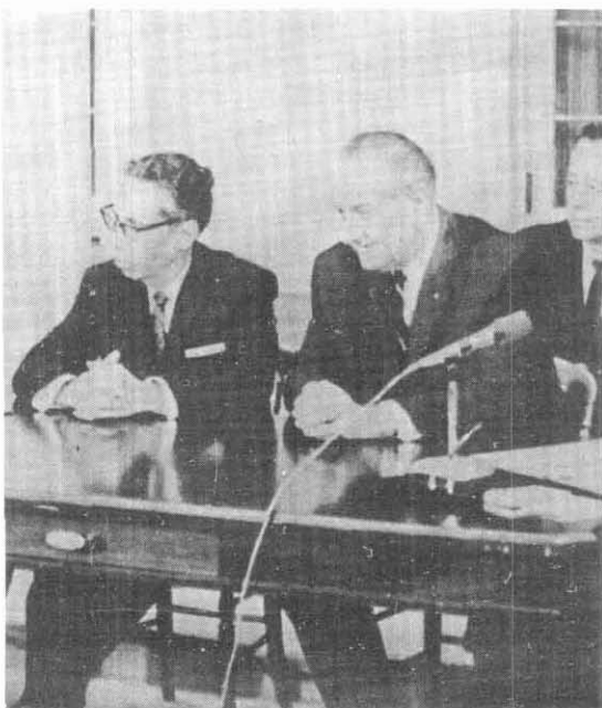
Ceremonia de la firma del Acta de la Comisión Internacional de Límites y Aguas, que demarcó la nueva frontera.

Los presidentes simplemente convinieron llevar a cabo consultas recíprocas sobre el asunto para estabilizar el precio de la fibra. 19