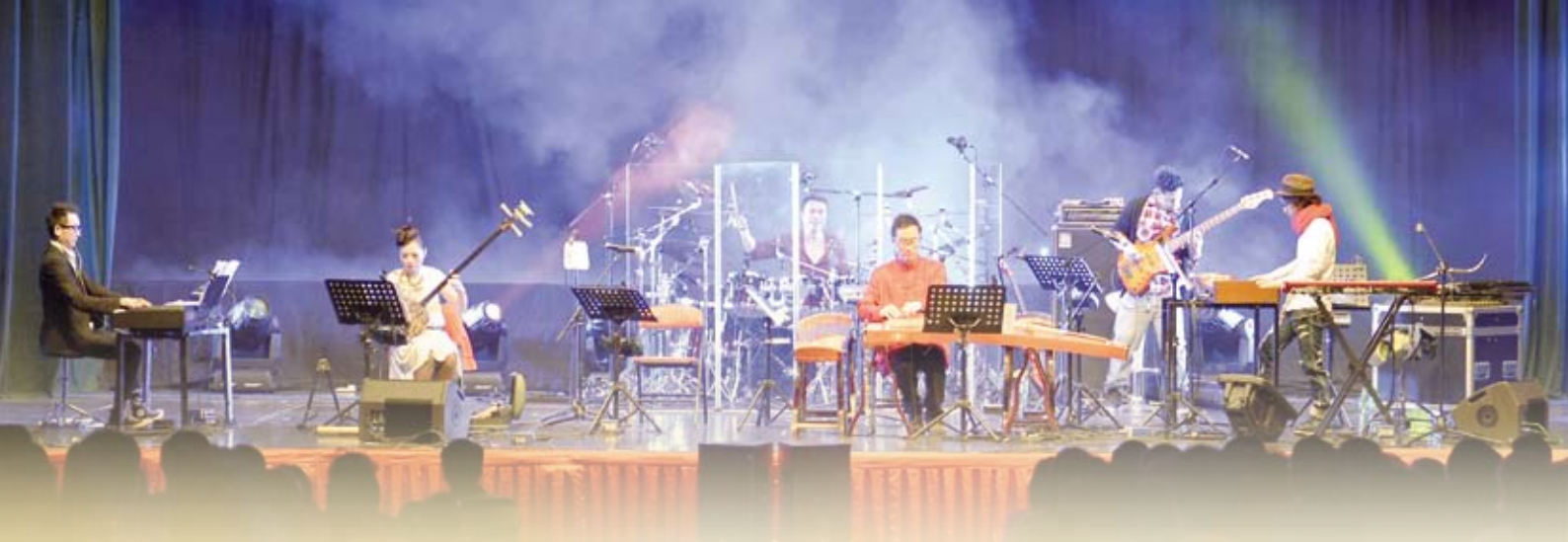
SIU2於「西九大戲棚2013」的大戲棚音樂會中演出

音樂系屬崇基獨有，同學對崇基均有深厚的歸屬感。「大家畢業後多從事與音樂有關的工作，總有說不完的話題。」年前，就音樂系分拆到各書院的安排，他便曾回校與同學討論，深刻感受到校友、同學與教職員對音樂系的關心。