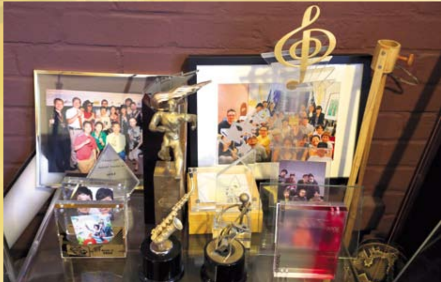
「人山人海」旗下歌手在音樂頒獎禮屢獲殊榮