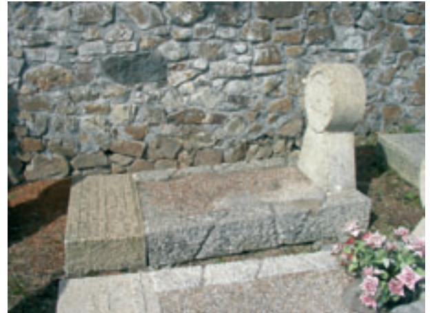
Elbiraren hilobia Mañuko kanposantuan