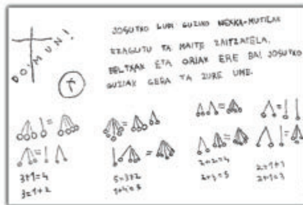
Bost urteko haur baten lana Domund egunean

Zipitriak berak aitortzen zuen, buruz atzeratua zen ikaslearekin erabilitako metodo eta baliabideak oso lagungarri izan zituela ikasle arruntei irakasterakoan. Gainera, frogatu