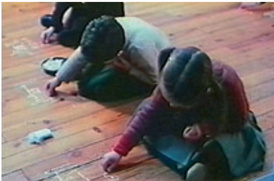
Irakurketa-idazketa txotxak erabiliz