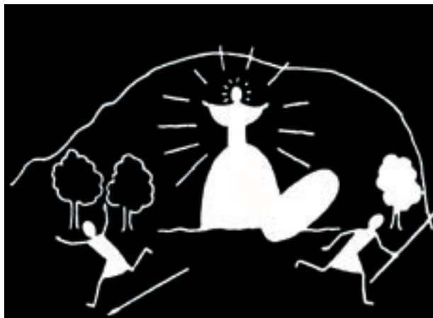
Elbirak pizkundeari ematen zion garrantzia

Jainko ederra, On-ona eta aundia, Zeruko Aita: Oiuka zure aurtxo: Gora Jainkoa! Zurea ni oso-oso.