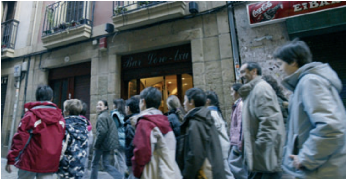
Elbiraren etxea eta ezkutuko ikastola