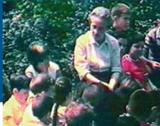
Elbira ikasleekin Donostiako gazteluan