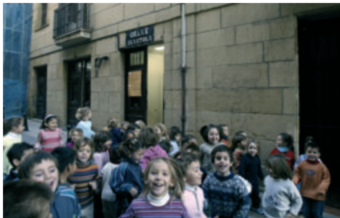
Gaur egungo Orixe ikastola Muñoarena izan zen Kanpanario kalean