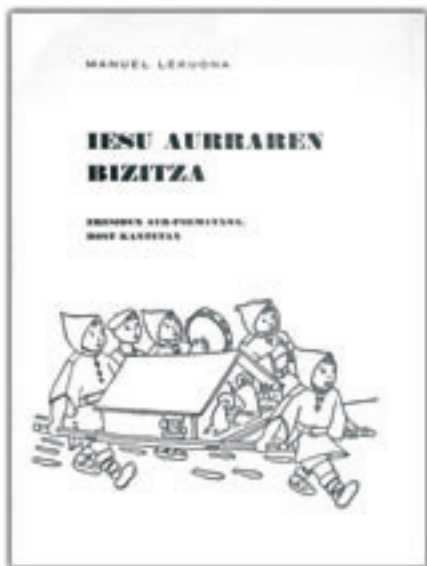
«Jesus aurraren bizitza» sarritan antzezten zuten