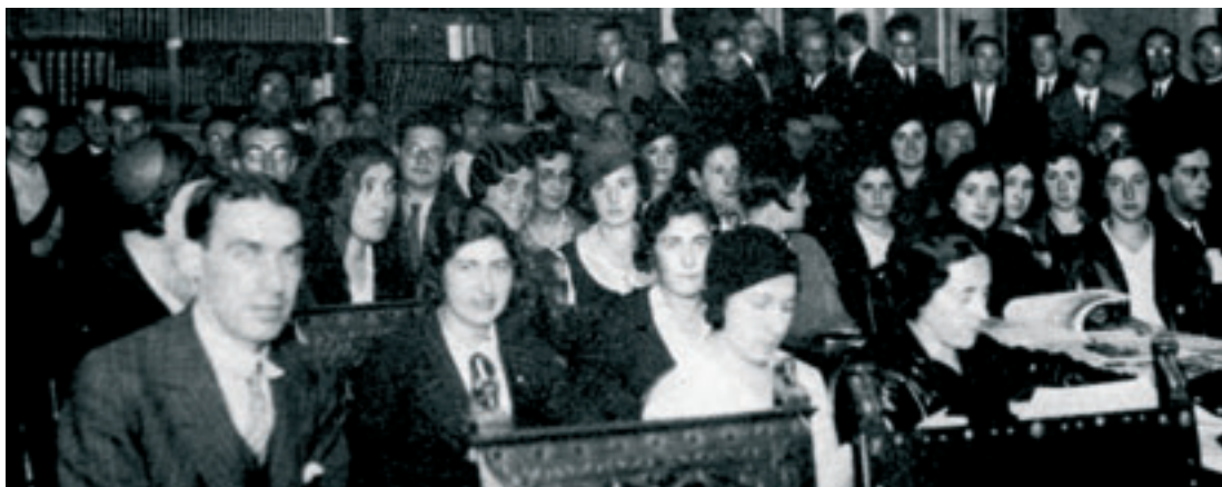
Elbira 1932an Eusko Ikaskuntzako udako ikastaroan

Aste bat berarekin lanean pasa baino lehen jabetu nintzen arrazoi osoa zuela eta bere ondoan eta hurrekin ikasi nuen benetan