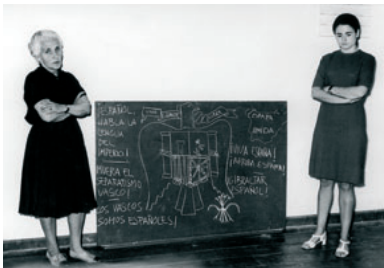
Goiz batean hauxe topatu zuten