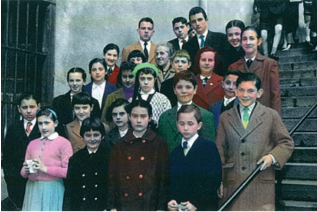
Elbira hurrez inguratuz Santa Teresako eskaileretan