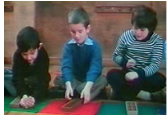
Kaniken bidez matematika lantzen