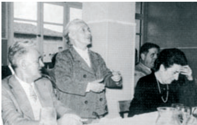
Agur aldizkariarekin Elgetan, 1972an

Bai guda aurretik eta baita ondorenean ere zenbait egunkari eta aldizkaritan zuhurtasun eta aparteko trebeziak idazten zuen, Ira izen-goitiaz izenpetuta. Elbira izenaren bukaeratik hartu zuela uste izan dute batzuek. Zenbait lekutan ihi adierazteko ere erabiltzen dute ira . Baina berari entzun nionez, garoa adierazteko erabiltzen den ira , iratze, irastor hitzetik hartu zuen Ira . Amaren Irastortzatik hartua, beharbada, umezurtza zelako amaren beharraren miraz. Aitarik gabe 21 urterekin eta amarik gabe 24 urterekin geratu baitzen.