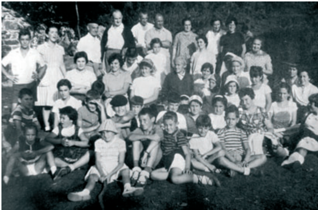
Zipitria Aralarren haurren eta gurasoen artean

irakaskuntza maitatzen, eskola bizia ezagutzen eta Elbira aparteko irakasle bezala miren.