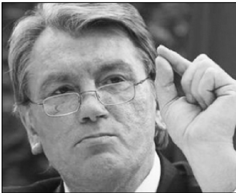
«Еще вот столько, и мы - в ЕС!»

Ситуация усугубляется еще и тем, что накануне совет директоров Европейского банка реконструкции и развития отложил выделение Украине кредита в 750 млн долларов, часть которого должна была пойти как раз на закупку российского газа, а также на модерниза-