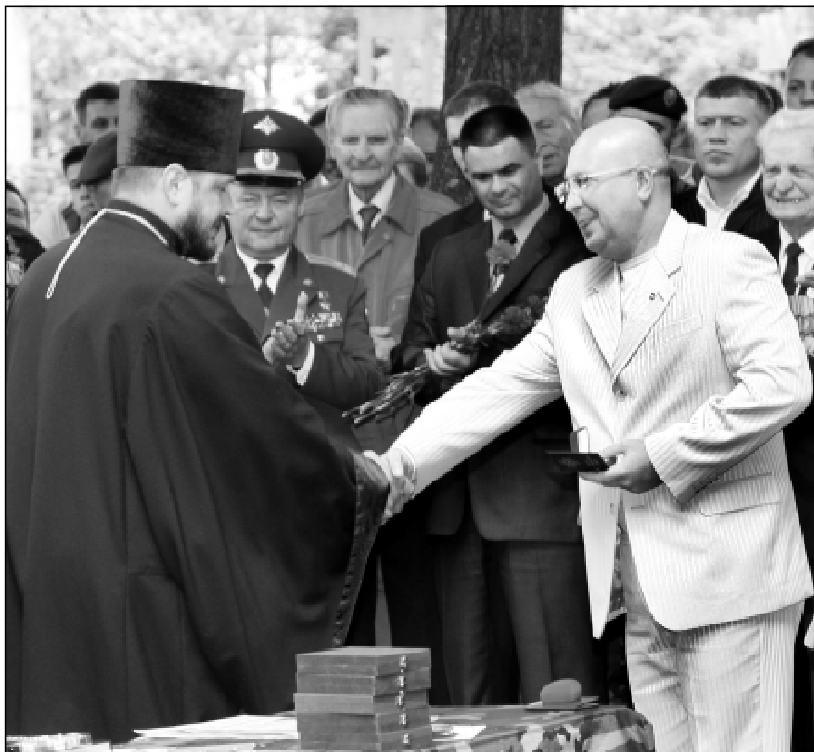
ФОТОРЕПОРТАЖ СЕРГЕЯ ЛУТОХИНА