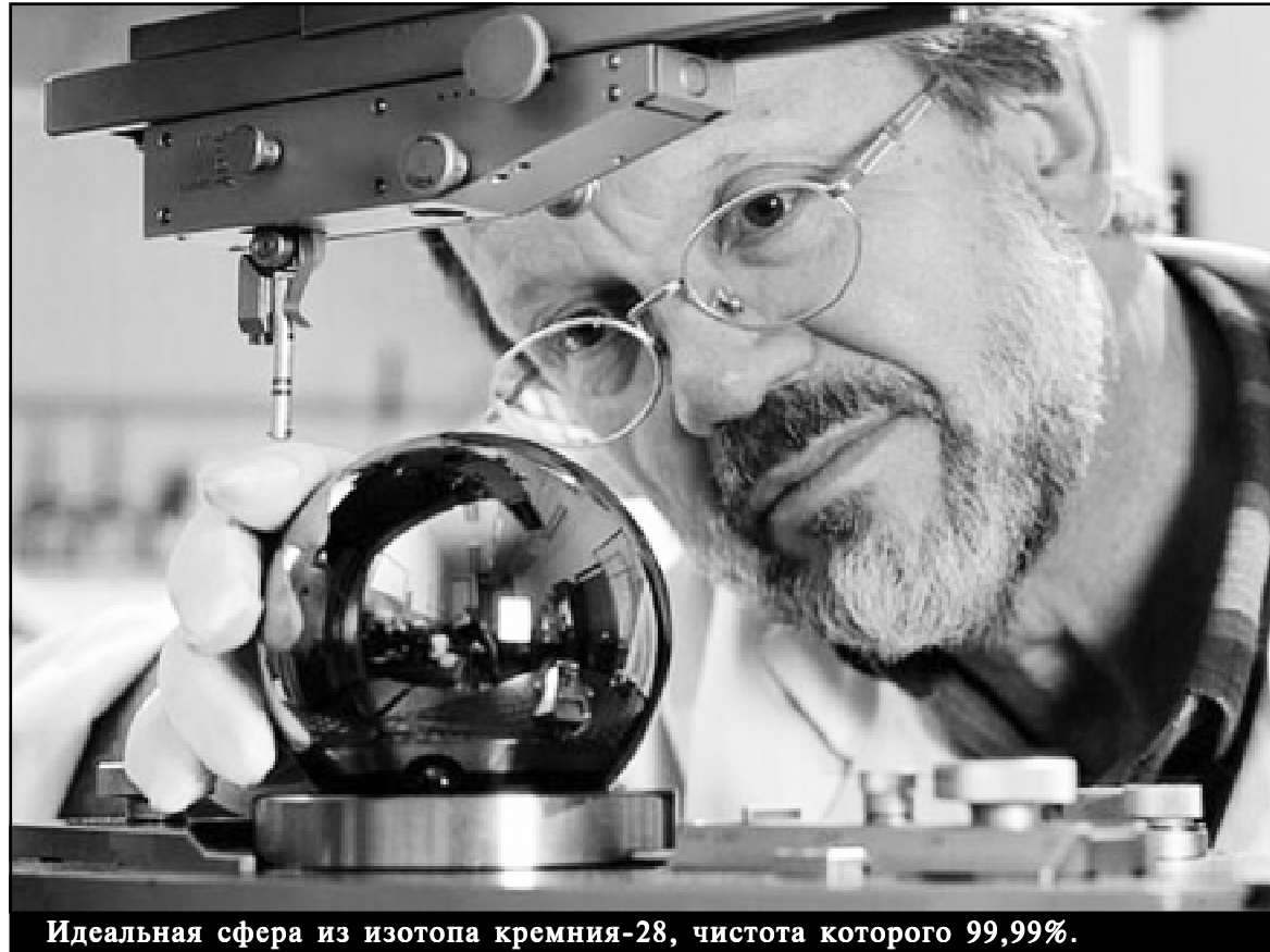
Идеальная сфера из изотопа кремния-28, чистота которого 99,99%.

Париже эталоны не идеальны. Постепенно ученые приходили к мысли, что за стандарты основных единиц стоит брать не рукотворные предметы, а гораздо более совершенные образцы, уже созданные природой. Так, за стандарт секунды приняли интервал времени,