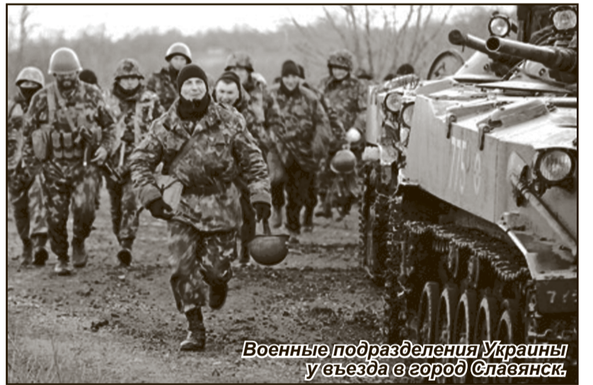
Военные подразделения Украины у въезда в город Славянск.

щий высококомбинированных десантных войск Вооруженных сил Украины полковник Александр Швец.