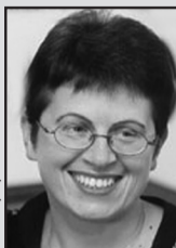
Марина Королёва «Российская газета»