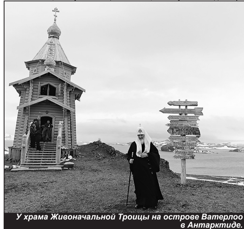
У храма Живоначальной Троицы на острове Ватерлоо в Антарктиде.

дай нищим и будешь иметь сокровища на небе». Теперь давайте себя поставим на его место. Богатейшее наследство, а они все раздают крестьянам. А потом понимают, что не так все вокруг хорошо, и многое в стране надо менять. Но когда стали менять, очень обидели экономически могущественного северного соседа. «И вот тогда мы поехали в Москву, - рассказывал Кастро в нашу первую встречу, - потому что ехать больше некуда было. Нам обещали помочь, если скажем, что у нас соци-