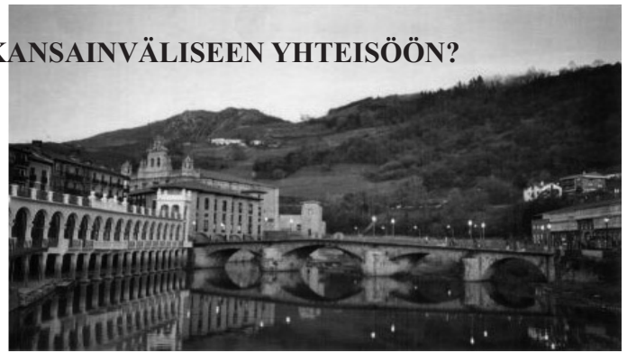
Tolosa: Kaupunkinäkymä

On hyvä muistaa, että jokaisella UNIMAn jäsenmaksunsa maksaneella jäsenellä on oikeus osallistua kansainvälisen UNIMA:n kongressin