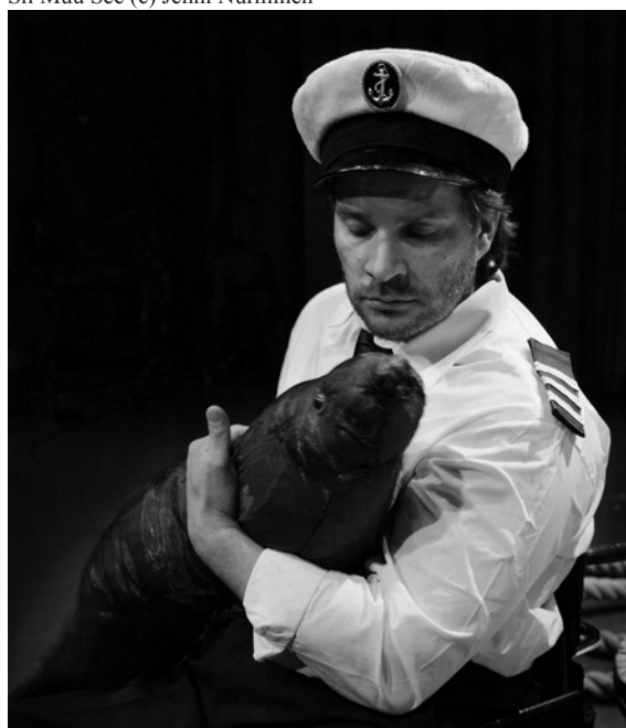
Sii Muu See

Ensi vuoden maaliskuussa pääkaupunkiseudulla on vuorossa Kansainvälinen BRAVO! lasten- ja nuortenteatterifestivaali, jolle saapuu lukuisia ulkomaisine esiintyjäryhmiä. Luvassa on muutenkin vilkas kansainvälinen vuosi Suomessa: toukokuussa pidetään Tampereella Mukamas2008-festivaali, kesäkuussa Imatralla järjestetään Kansainvälinen Mustan ja Valkoisen Teatterin festivaali. Elokuussa on vuorossa Hippalot-festivaalin kansainvälinen nukketeatteritapahtuma. Ja syyskuussa Kangasalan X Nukketeatteripäivät kansainvälisissä merkeissä. Toivottavasti näille kaikille löytyy riittävästi rahoitusta valtion ja kotikuntien taholta sekä runsaita yleisöjoukkoja ja julkisuutta.