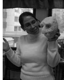
Farzaneh ja nukentaihia