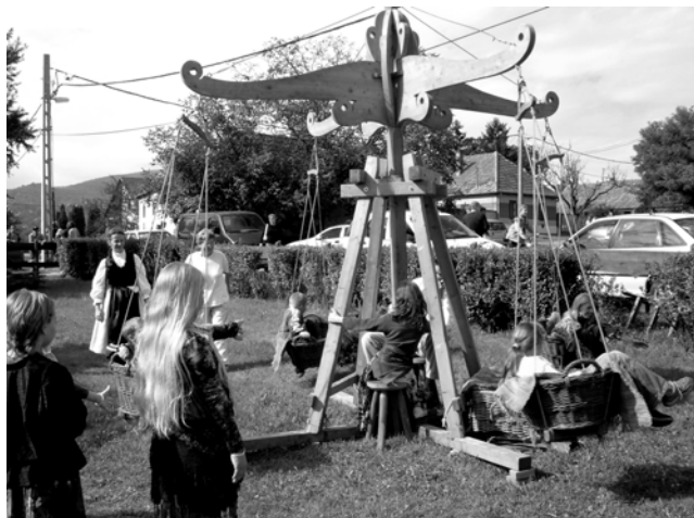
Körhinta – Szüreti Felvonulás (2005. szeptember 17.)