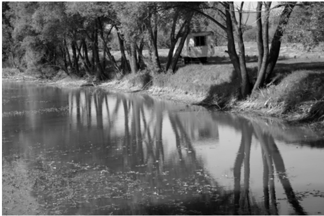
Lecsapolás közben – Merzsán-tó

Ma 2005. szeptember 4. van, még csak egy hete apad a víz, de máris 60-70 cm-rel alacsonyabb az átlagos szintjénél. Az apadás ma tény, csak remélhetjük, hogy az összes többi mende-monda alaptalan.