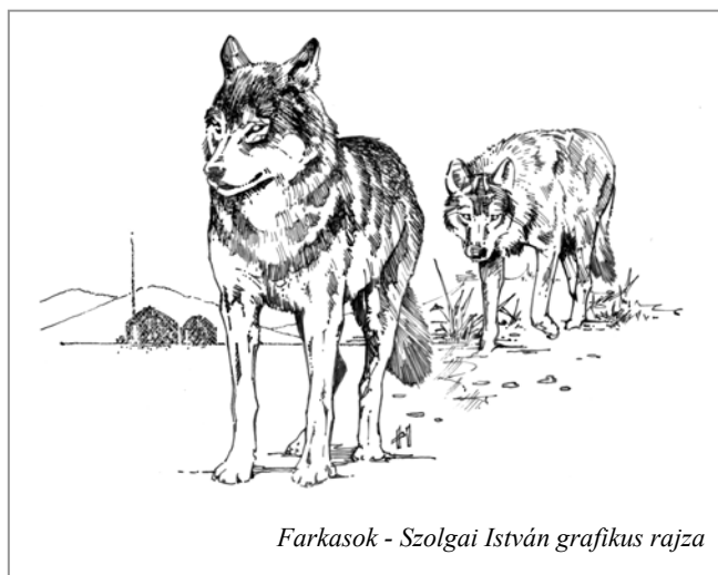
Farkasok - Szolgai István grafikus rajza

2005. 09.07. Szigetgyöngye SE – Visegrád 1:0 (gólsz.: ifj. Mócsai Róbert)