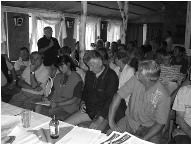
A Napsugár éttermet megtöltötték az érdeklődők

A Fórum folyamodványaként az azt követő képviselőtestületi ülés témája is az volt, hogy üdülőövezet vagy lakóövezet legyen-e Horányból. A lehetőségeket, illetve azok előnyeit hátrányait megpróbálom összefoglalni.