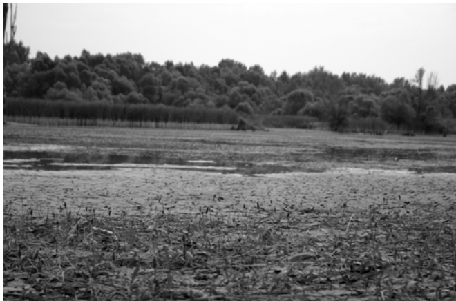
Víztelenül – Merzsán-tó