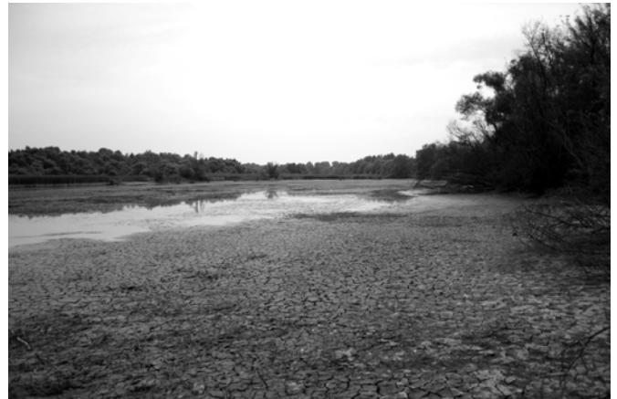
Lecsapolás után – Merzsán-tó