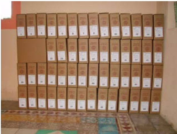
Después del proceso