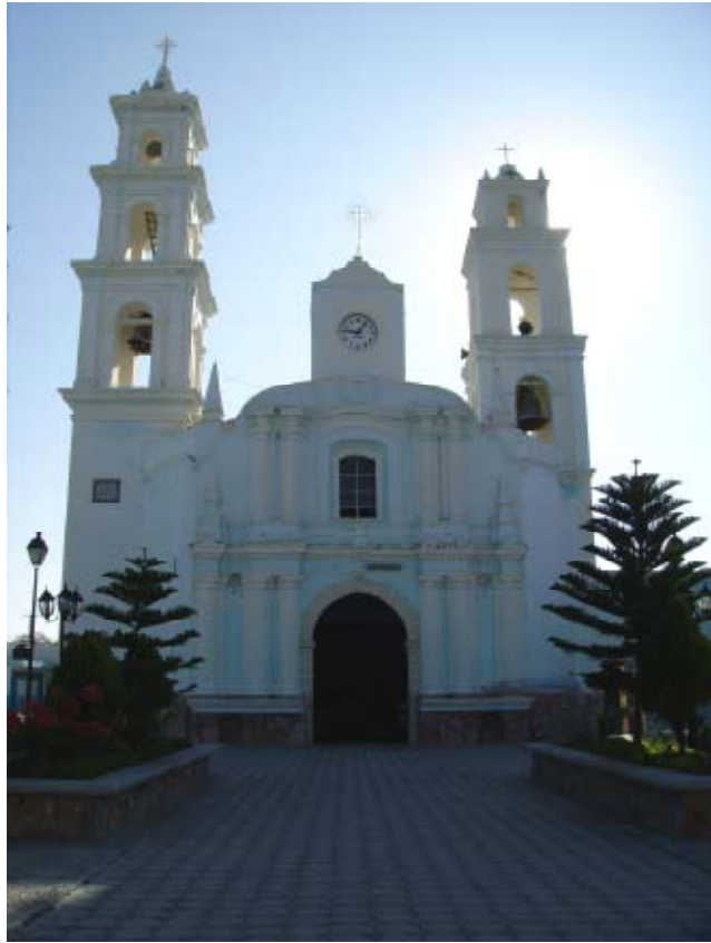
SANTA MARÍA CHIGMECATITLÁN, PUEBLA