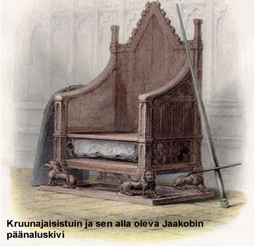
Kruunajaisistuin ja sen alla oleva Jaakobin päänaluskiivi

hänen valtaistuimensa ikuisiksi ajoiksi. Minä olen oleva hänen isänsä ja hän minun poikani, niin että, jos hän tekee väärin, minä rankaisen häntä ihmisvitsalla ja niinkuin ihmislapsia lyödään; mutta minun armoni ei poistu hänestä, niinkuin minä poistin sen Saulista, jonka minä poistin sinun tieltäsi. Ja sinun sukusi ja kuninkuutesi pysyvät sinun edessäsi iäti, ja sinun valtaistuimesi on oleva iäti vahva." Profetioiden kuvausten sanotaan toteutuvan brittiläisen imperiumin vaiheissa.