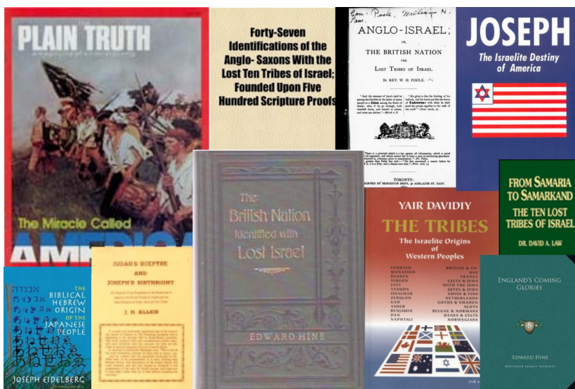
Vanhempaa ja uudempaa julkaisua aiheesta