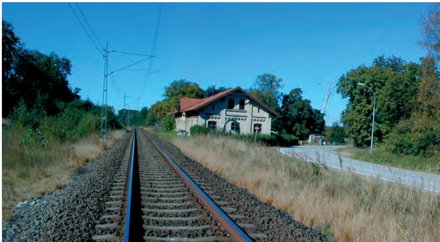
Vid "Grevebanan" anlades Börringe Station som är bostad idag

I tabell 2.11.1 nedan och figur 2.11.1 intill redovisas de riksintressen som berörs av utredningsområdet. Kärnområdena beskrivs mer specifikt i kommande avsnitt.