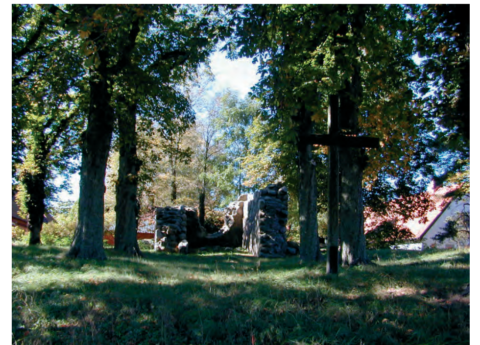
Kyrkoruinen i Byn

Utdikningen av Näsbyholmssjön 1866-69 (söder om Margretheholm i karta, figur 2.11.1) innebar en av de största förändringarna av landskapsbilden sedan enskiftet på Svaneholm. Utdikningen genomfördes efter engelsk-danska förebilder och gav omkring 1100 tunnland ny mark. Vid sjöns