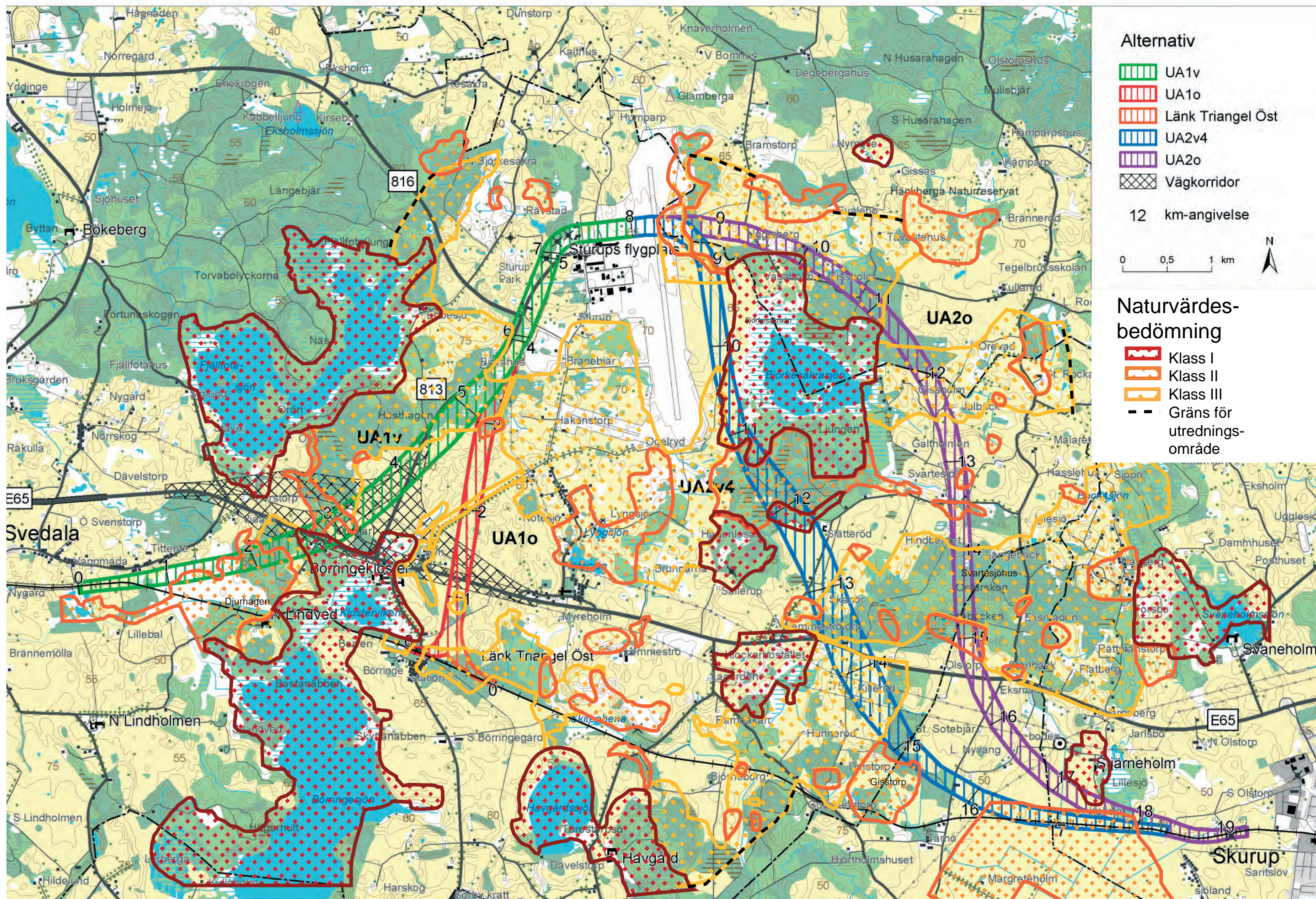
Figur 2.9.5 Samlad naturvärdesbedömning