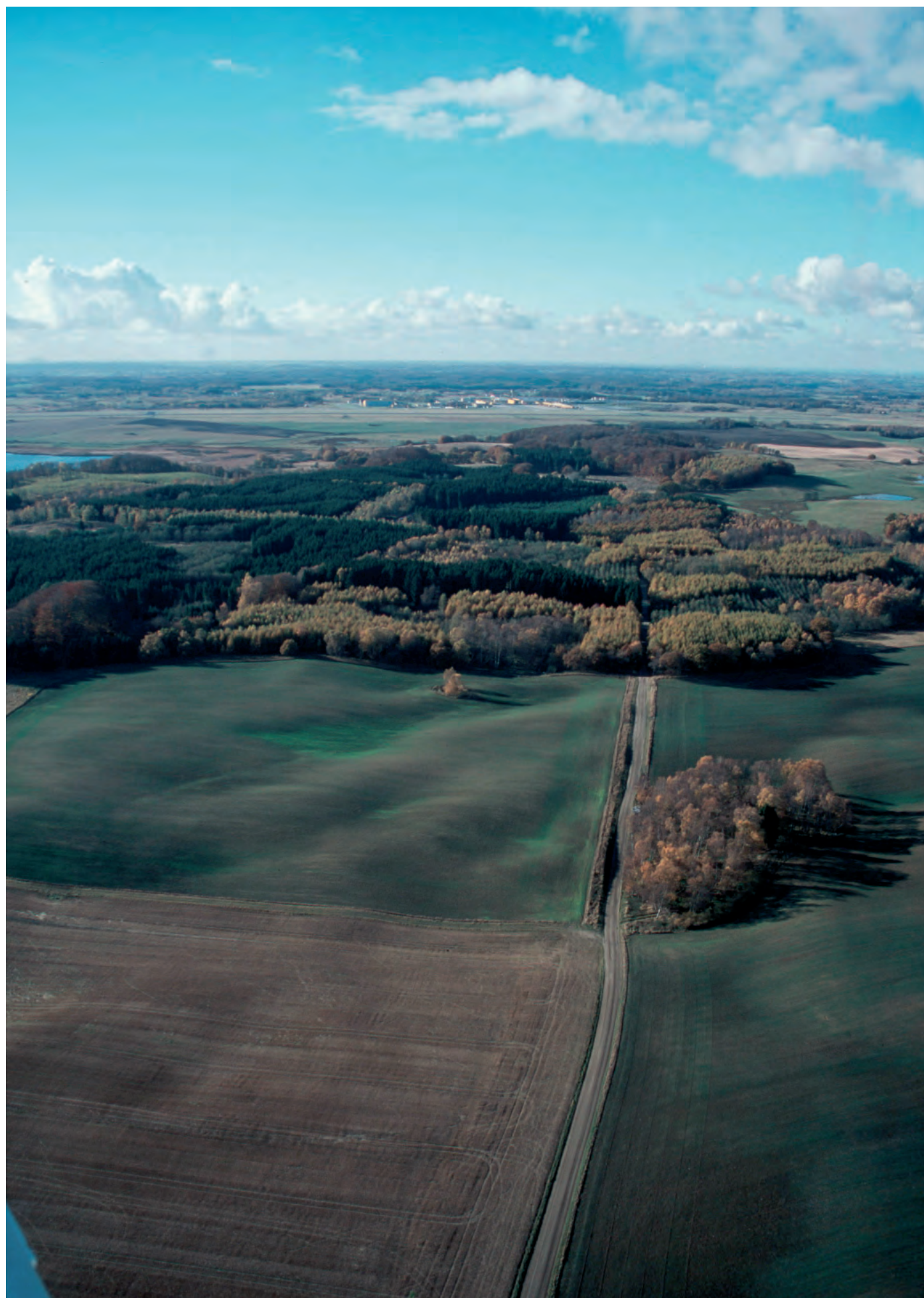
Det varierade skogsområdet norr om Björkesåkrasjön. Flygplatsen i bakgrunden.

Områden som klassats som klass III är både skogsområden och mer öppna områden med en viss variation och inslag av åkerholmar, alléer, småvatten mm.