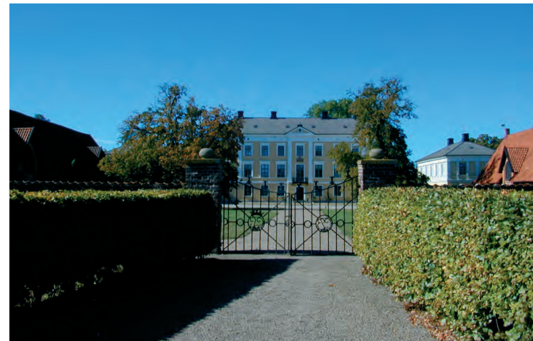
Huvudbyggnaden på Börninge Kloster

I slättbygderna är spåren från den förhistoriska tiden till stora delar utplånade av det moderna jordbruket. I skogs- och mellanbygderna där markutnyttjandet varit mindre intensivt återfinns skeppssättningar, domarringar och resta stenar. Inom utredningsområdet finns fornlämningar kvar i mindre intensivt brukade marker men är oftast helt bortodlade i åkerlandskapet.