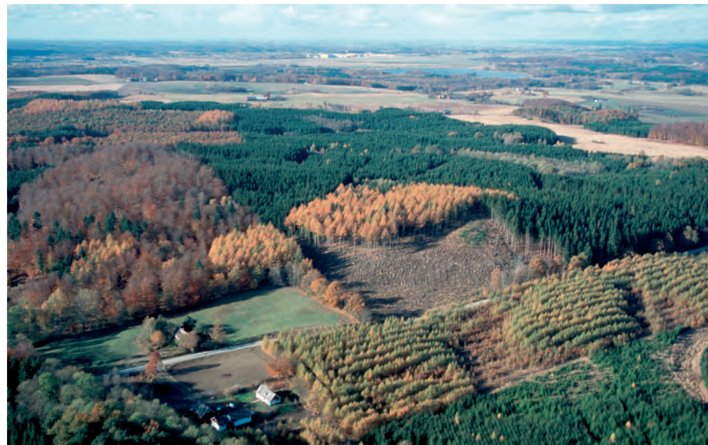
Skogsområdet Österskog med bebyggelsen i Eksmaden i förgrunden