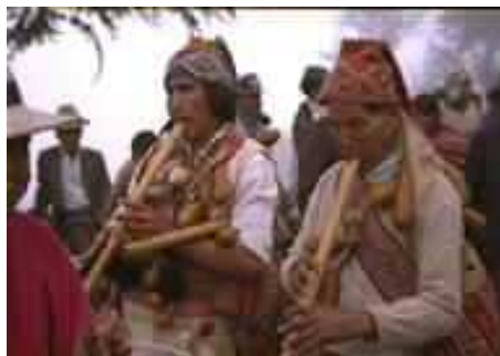
Ejecutantes de quena de la comunidad Tikamblaya (Bolivia)

Ante la realidad de un mundo globalizado y de estereotipos musicales que nos invaden en forma permanente desde los medios de comunicación y de difusión masiva, es indispensable considerar la importancia del conocimiento de la música autóctona, la ancestral y la sobreviviente, su función social y su proyección en el folclore actual, como una necesidad de fomentar identidad y respeto hacia el patrimonio local, nacional y de cada región del continente americano. Con esta finalidad fue creada la presente propuesta didáctica que ofrece a grandes rasgos un acercamiento a la música de algunas de las culturas aborígenes de América latina.