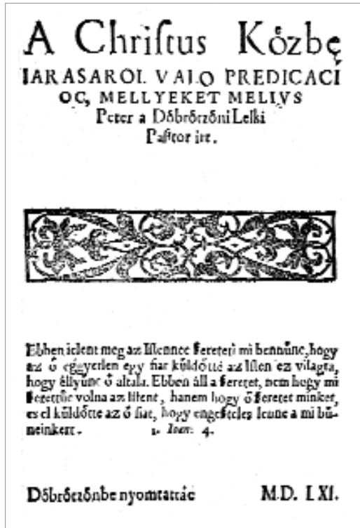
2. ábra. Krisztus közbenjárásáról való prédikációk

„A legelső debreceni nyomású könyv címlapja, 1561. Huszár Gál nyomása. Középen a bázeli Frobenius-nyomda jelvényének utánzata. 3 (Az erdélyi múzeum könyvtárának unikuma.)