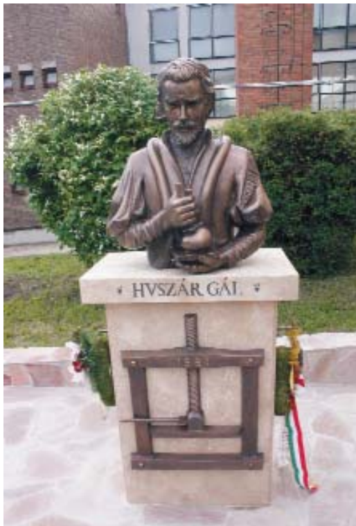
Debrecen, Alföldi Nyomda Huszár Gál szobra

Több homály van a kassai tartózkodását és a debreceni Melius Juhász Péterhez 2 való viszonyát