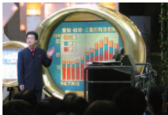
公開生放送した 金とく「犯罪多発！まちの安心を取り戻せ」