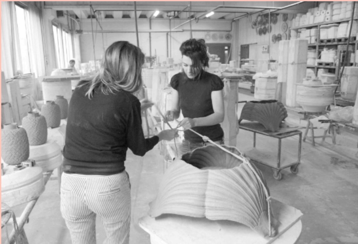
Fabrication de nouveaux Shibaris, Italie Résidence à Nove, 2015