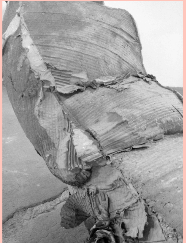
Nouvelle pièce en béton (détail) Vue d'atelier, 2015