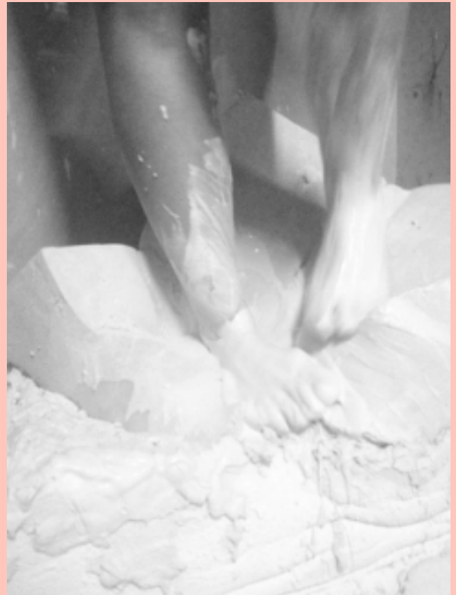
Expérimentations pour nouvelles pièces céramiques Vue d'atelier 2014-15