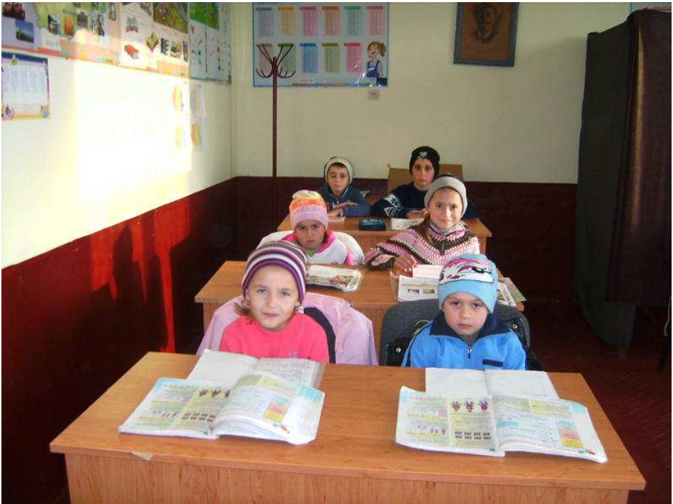
Elevii din clasele I-IV în anul școlar 2009/2010

În anul școlar 2009/2010 în cele patru clase erau înscriși în total 6 elevi. Învățătoarea lor este doamna Rodica Petrescu.