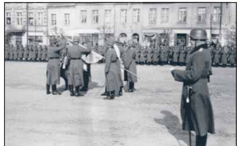
Podczas ekspozycji zaprezentowano wiele archiwalnych zdjęć, które nigdy przedtem nie były upublicznione

„Września jest gotowa, Września jest spokojna, Września spełni swój obowiązek” - tak kończy się numer „Orędownika Wrzesińskiego” z 31 sierpnia 1939 r., a zaczyna prezentacja multimedialna stanowiąca wprowadzenie do wystawy otwartej w Muzeum Regionalnym 11 września. 70 lat temu do Wrześni wkroczyli Niemcy.