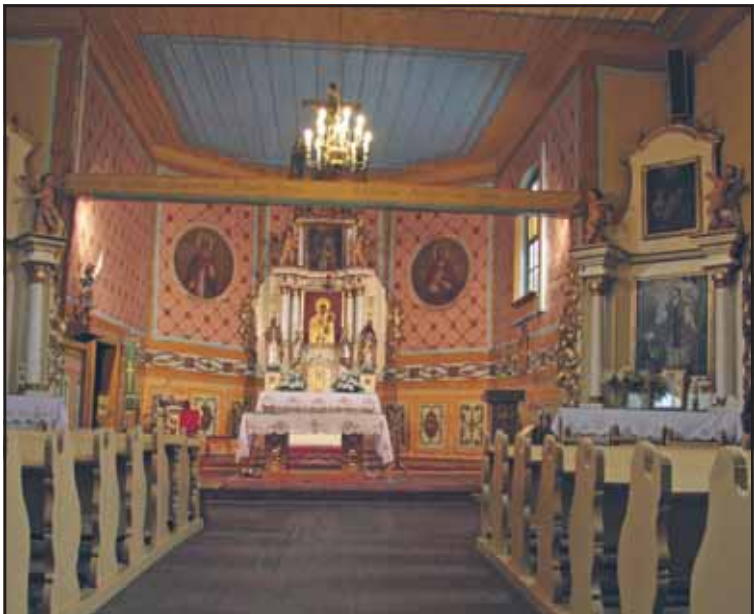
Wnętrze drewnianego kościoła pw. św. Mikołaja w Czeszewie

Ma swój Szlak Architektury Drewnianej Małopolska, mamy i my w powiecie wrzesińskim zabytki nie ustępujące urodą i wagą kulturową budowlom wokół Krakowa. W poprzednim miesiącu opisywałem zieleniecki kościół, chroniący prochy świątobliwego męża, a dziś przeniosę się na krańce naszego powiatu, do Czeszewa, gdzie przedwieczne lasy dostarczyły materiału do budowy kościoła pw. św. Mikołaja. Kościoła niezwykłego, otoczonego chyba specjalną opieką świętych, który niezwykłe oglądał wydarzenia.