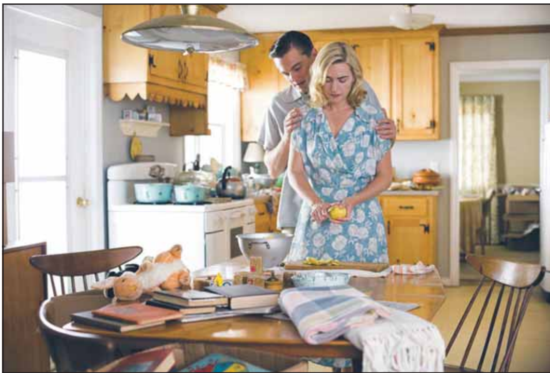
Kino Konesera otworzyło kolejny sezon Drogą do szczęścia Sama Mendesa

Akcja filmu toczy się Stanach lat pięćdziesiątych, poznajemy historię młodego małżeństwa Wheelersów (Kate Winslet i Leonardo DiCaprio). Ona, niespełniona aktorka, która ugrzęzła w roli gospodyni domowej, on - młody z aspiracjami, zmuszony do oglupiającej pracy w korporacji, żeby utrzymać rodzinę na przyzwoitym poziomie. Mili-młodzi-Wheelersowie wsiąknęli w krajobraz amerykańskiego dostatniego przedmieścia. Pozornie doskonale spełniają wymogi normy - choć w istocie mają wrażenie, że skończyli się wraz z przeprowadzką do swojego idealnego domku. I snują opowieść o ucieczce do Paryża, która zrobi z