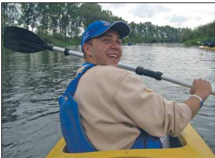
Humor dopisywał zawodnikom, mimo że trasa była męcząca

12 września do wielogodzinnej, wyczerpującej próby stanęło ponad stu miłośników turysty-