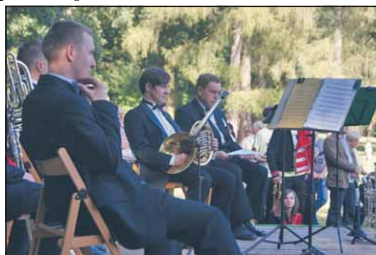
Capella Zamku Rydzyskiego tuż przed występem

Rok 2009 ogłoszony został przez Marszałka Sejmu Rokiem Juliusza Słowackiego. Z dwóch powodów. 4 września minęło bowiem 200 lat od chwili narodzin poety, natomiast 3 kwietnia obchodziliśmy 160. rocznicę jego śmierci. Miłoślawianie mieli w tym roku jeszcze jeden powód do świętowania - 110. rocznicę odsłonięcia w miłoślawskim parku pierwszego na ziemiach polskich pomnika Juliusza Słowackiego.