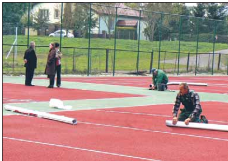
... a cztery dni później boiska wielofunkcyjnego przy ulicy Kaliskiej