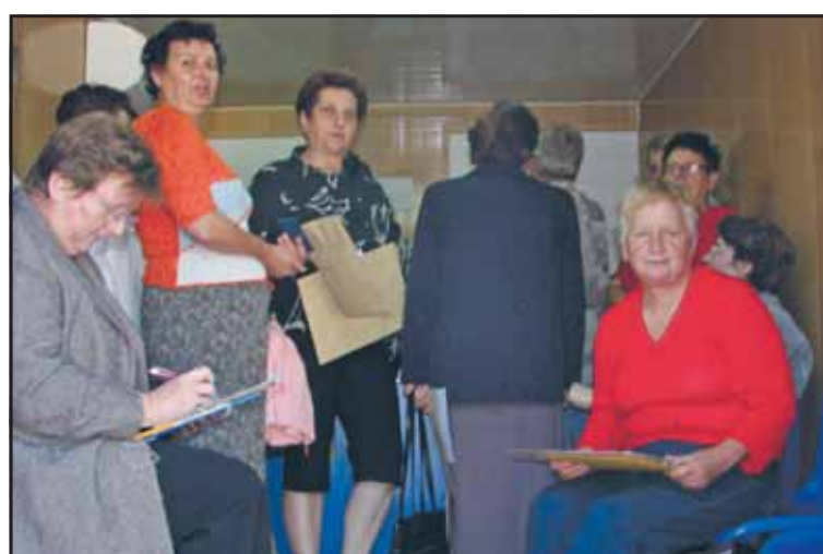
Na badanie nie trzeba było długo czekać - każda pacjentka zgłaszała się na umówioną godzinę