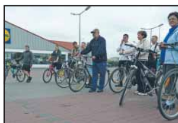
Maraton Turystyczny strona 15

25. rocznica męczeńskiej śmierci Sługi Bożego Ks. Jerzego Popiełuszki 19.10.1984 - 19.10.2009