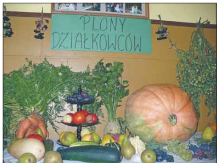
Uroczystościom towarzyszyła wystawa dorodnych plodów ziemi