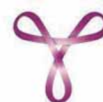
Profilaktyka raka szyjki macicy strona 9