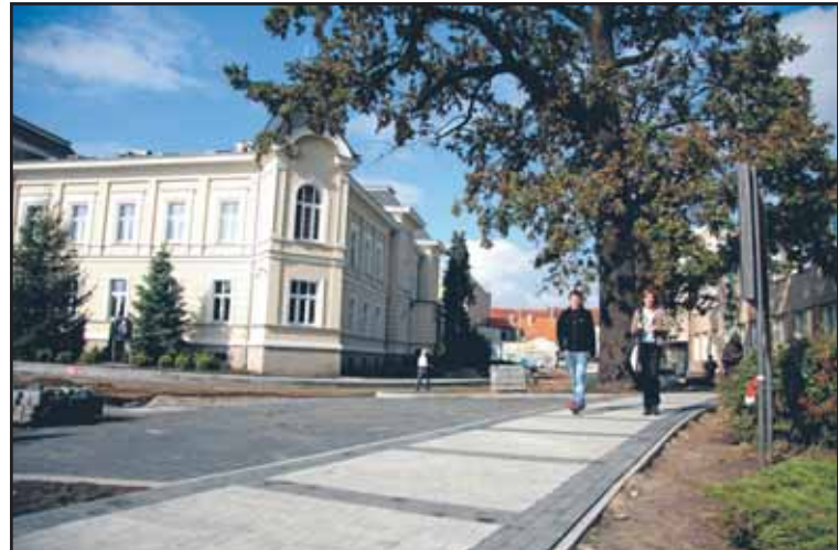
Przy ulicy 3 Maja została ułożona kostka brukowa