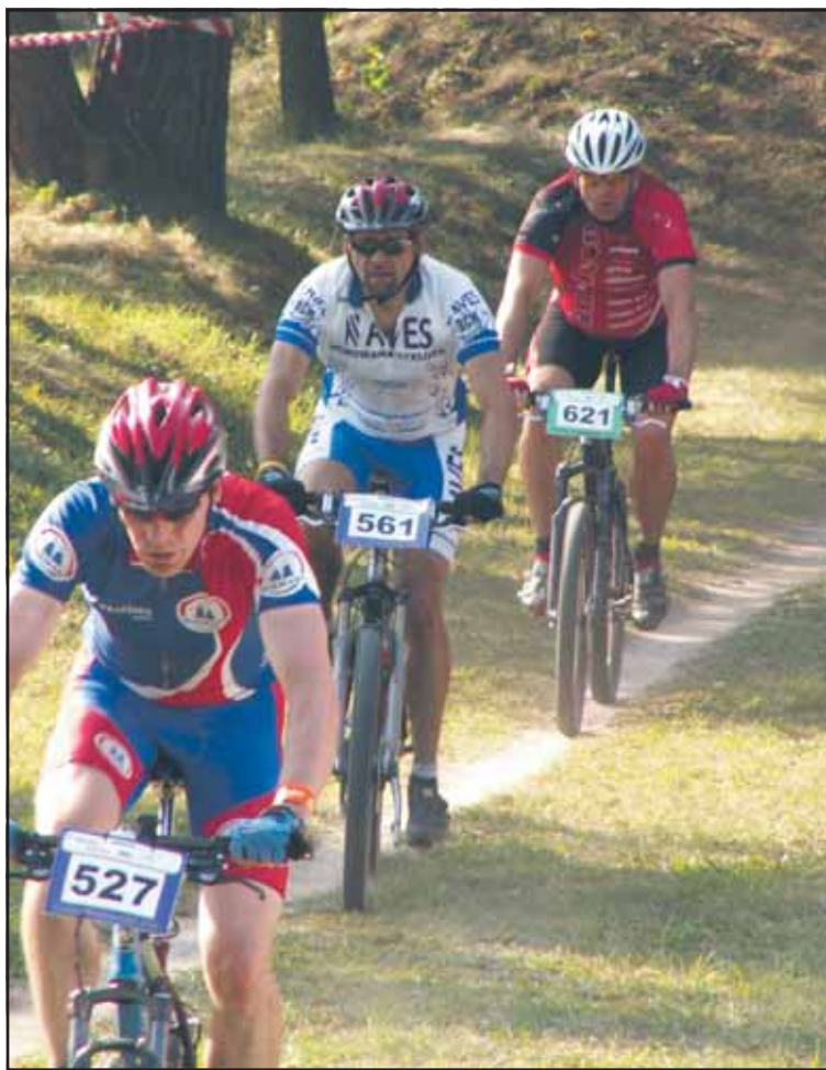
W zawodach wystartowało 162 kolarzy. Chwilami tempo było umiarkowane