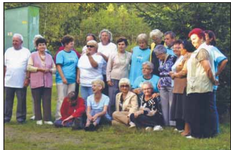
Po wyczynach sportowych przyszedł czas na pamiątkową fotografię