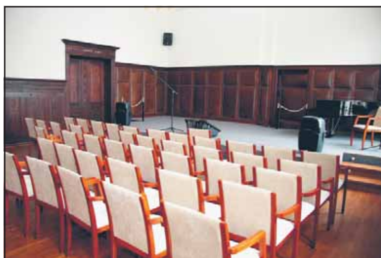
Drugiego października odbył się odbiór techniczny auli LO...