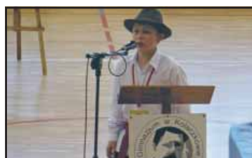
XIII Złot Szkół Reymontowskich strona 3