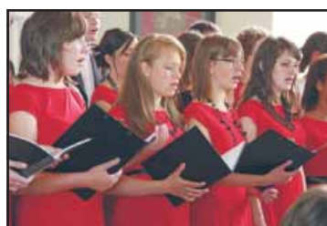
Eurotreff - wrzesiński chór w Wolfenbüttel strona 7