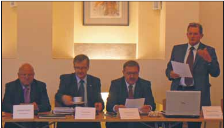
Prezydium konwentu tworzą starostowie: leszczyński, ostrzeszowski, poznański oraz wrzesiński