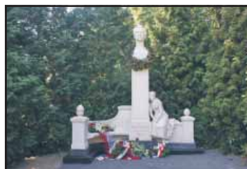
Obchody roku Słowackiego strona 7