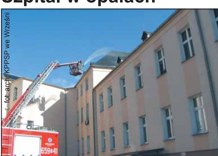
W szpitalu odbyły się ćwiczenia służb ratowniczych

30 września o 10.00 dyspozytorka pogotowia ratunkowego otrzymuje zgłoszenie z oddziału noworodkowego szpitala powiatowego, że w szatni personelu na poddaszu nieznanymi mężczyzną rozlał i podpalił substancję łatwopalną.