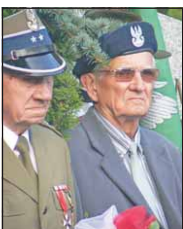
Kombatanci doskonale pamiętają ten tragiczny dzień

17 września wrzesnianie wspominali jedno z najbardziej tragicznych wydarzeń w historii Polski. Uroczystości rozpoczęła msza święta celebrowana przez ks. kanonika Głowa w kościele farnym.