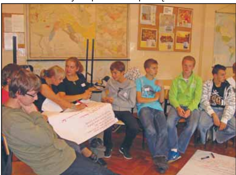
Młodzież wrzesińskiego liceum podczas warsztatów prowadzonych przez trenerki z Warszawy

Szkoła Dialogu Polska to nazwa programu od dwóch lat realizowanego w Warszawie przez Fundację Forum Dialogu Między Narodami. Od września przygotowywany jest on również poza stolicą, w kilkunastu wybranych mniejszych miejscowościach. Cykl spotkań rozpoczął Wrzesnia.