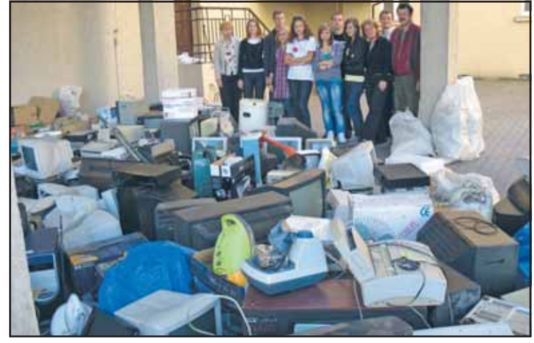
Efekty ekologicznej zbiórki robiły imponujące wrażenie

19 września uczniowie wrzesińskich szkół zbierali zużyty sprzęt elektryczny i elektroniczny, biorąc udział w ogólnopolskiej akcji Sprzątania Świata 2009, organizowanej przez powiat wrzesiński przy współpracy szkół ponadgimnazjalnych oraz Nadleśnictwa Czerniejewo.