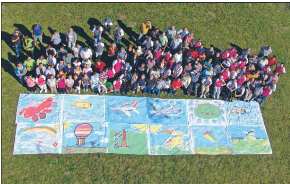
Autorzy latawców w komplecie

Druga edycja Święta Latawca odbyła się 9 września w Czeszewie. Impreza zorganizowana przez Warsztat Terapii Zajęciowej zgromadziła wielu gości z innych tego typu placówek. Podniebne zmagania okazały się wspaniałą zabawą. A trzeba wiedzieć, że zrobić porządną latawiec wcale nie jest łatwo.