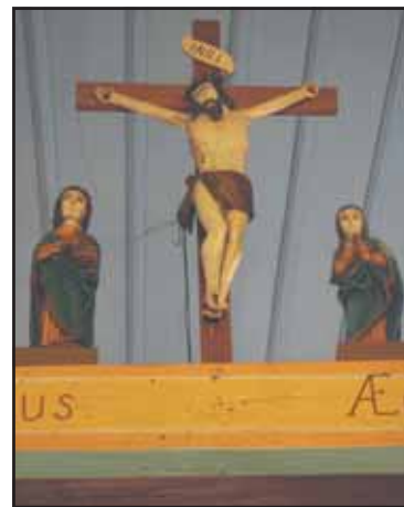
Po usunięciu kilku warstw farby XVII-wieczna rzeźba ukazała się w pełnym blasku

W 1975 roku odkryto w Czeszewie złoża leczniczych wód termalnych. Od 1989 roku na rzecz eksploatacji tych złóż oraz przekształcenia wsi w uzdrowisko działa Towarzystwo Wykorzystania Wód Termal-