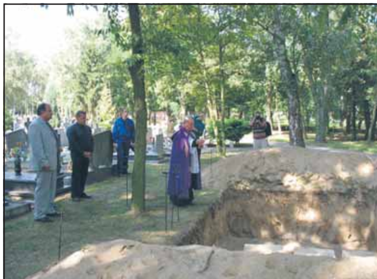
Pochówek odbył się na cmentarzu komunalnym

Podczas ceremonii obecni byli przedstawiciele władz miejskich w asyście straży miejskiej. Przy grobie umieszczono krzyż z tabliczką