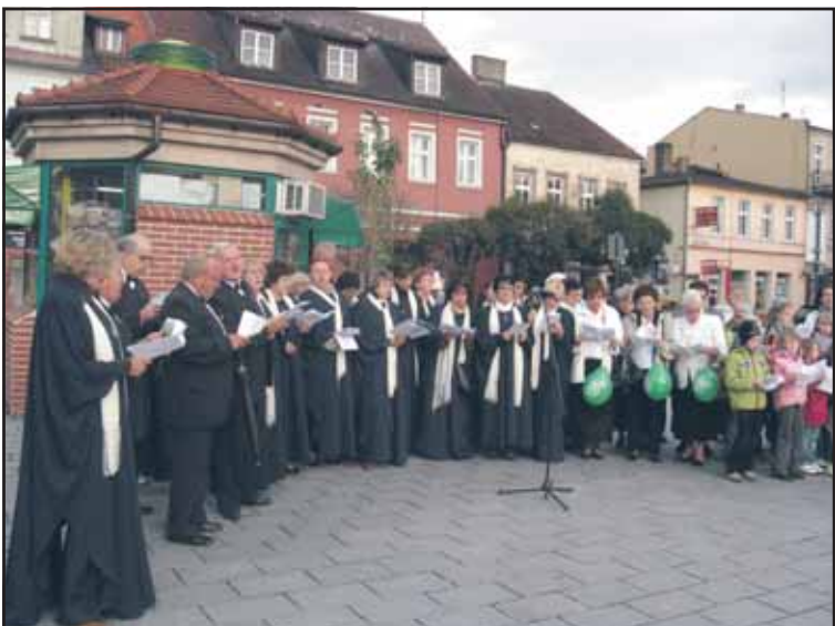
Chórzyści Cameraty poprowadzili wspólnie śpiewanie nie oglądając się na złą aurę

W latach siedemdziesiątych z inicjatywy Jehudi Menuhina UNESCO ogłosiło 1 października Międzynarodowym Dniem Muzyki. Wrześnianie również włączyli się w obchody tego pięknego święta - chór Camerata od trzech lat organizuje muzyczne spotkanie na rynku.