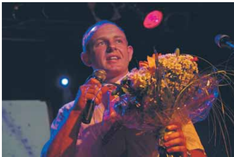
Wzruszony ojciec dziękuje za okazane serce