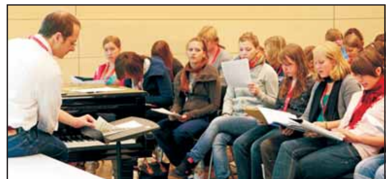
Festiwalowi towarzyszyły warsztaty muzyczne