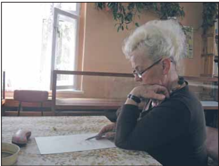
Lekcja rysunku jest okazją do chwili refleksji

W sobotę 12 września pasjonaci rysunku i malarstwa spotkali się na pierwszych po wakacjach warsztatach plastycznych. Zajęcia, które odbyły się w TCL we Wrześni, organizowane są przez Klub Twórczości Różnej „Cóż Innego”.