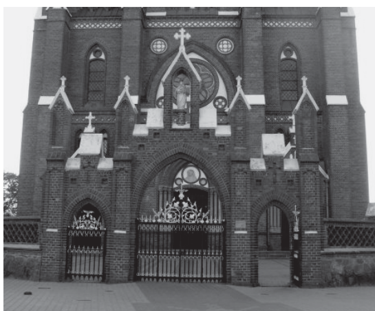
Arnoldo Stasiulio nuotraukose – Švėkšnos šv. apaštalo Jokūbo bažnyčia ir jos šventoriaus vartai. 2007 m.