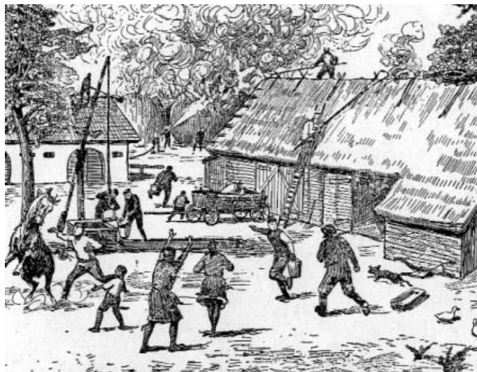
Požar wiejskich zabudowań

Požary od wieków niszczyły nasz kraj, obracając w perzynę nie tylko dobytek ludzi, ale i dorobek kulturalny. Największe straty występowały w dużych miastach, będących skupiskami ludności, zajmującej się handlem i rzemiosłem. W czasie pożarów pastwą płomieni padały nie tylko warsztaty pracy, majątek ruchomy, domy mieszczkańskie, ale i zabytkowe obiekty: zamki, kościoły, klasztory. Często zdarzało się, że pożar doprowadzał do ruiny materialnej społeczności miast, które już nie mogły powrócić do dawnej świetności. W okresie średniowiecza główną przyczyną tych klęsk wynikała z faktu, że prawie całe budownictwo mieszkalne, sakralne, a nawet obronne wznoszono z drewna. Tak było do XIV wieku. Dopiero w okresie panowania króla Kazimierza Wielkiego i jego następców można mówić o pewnej zmianie jakościowej budownictwa na korzyść „Polski murowanej”, ale też zazwyczaj dotyczyło to niektórych obiektów: zamków, kościołów, murów obronnych. Pewna poprawa nastąpiła w XVIII–XIX w., kiedy to – w miejsce budynków drewnianych – zaczęto coraz powszechniej wznosić obiekty z kamienia czy cegły.