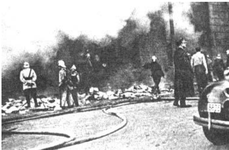
Jedna z akcji gaśniczych w czasie okupacji

Działalność straży pożarnych w czasie hitlerowskiej okupacji prowadzona była w trudnych i bardzo skomplikowanych warunkach. Polecenia i zadania ustalone przez okupanta dla polskich straży pożarnych nie odpowiadały interesom i dążeniom zniewolonego społeczeństwa polskiego. Tym trudniejsza była sytuacja strażaków i działaczy pożarniczych skupionych w jednostkach straży pożarnych. Jednak pod pozorem wykonywania zadań narzuconych przez okupanta realizowali oni wytyczony cel podstawowy – służbę i działalność dla społeczeństwa i czynne włączenie się do walki o wyzwolenie ojczyzny. Zadania powyższe polskie pożarnictwo realizowało również w tajnej organizacji podziemnej Strażacki Ruch Oporu „Skała”. Jej organizatorami byli oficerowie o długoletnim stażu, cieszący się szacunkiem i zaufaniem.