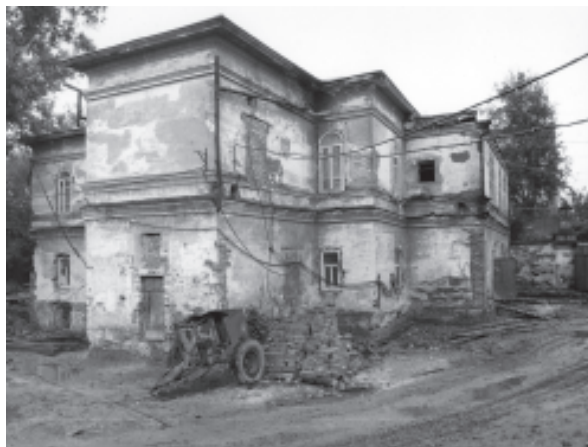
Так в 1980-е годы выглядела бывшая усадьба Березина

На первом субботнике на этой усадьбе работали все учреждения культуры, в том числе и аппарат управления. «Командовать