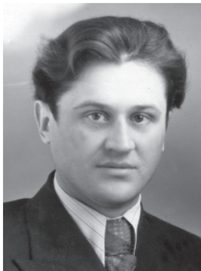
Фотография с Доски почета в техникуме