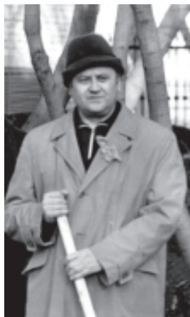
Нравне со всеми на субботнике