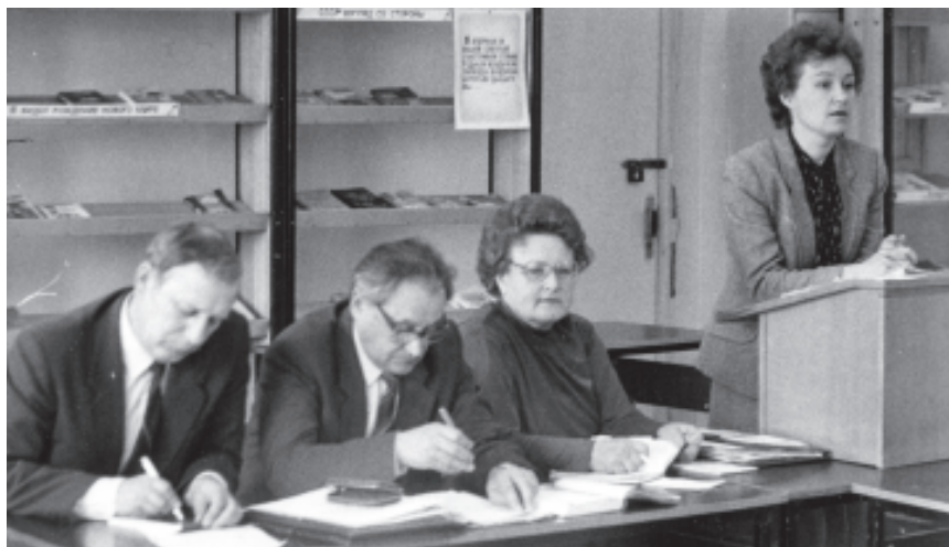
Нередко расширенные заседания коллегии областного управления культуры проводились в библиотеке им. А. К. Югова