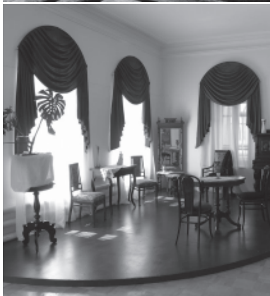
Усадьба Березина – музей истории города Кургана – до и после завершения реставрационных работ

было. Мы думали, что это будет учреждение культуры, поэтому там проводили субботники. Но потом у многих появились виды на это здание – у торговли и горисполкома. Все хотели им завладеть. Я подключал вышестоящие организации и все же добился, чтобы это здание осталось учреждением культуры. Это сама история, другой такой усадьбы нет на всем Урале.