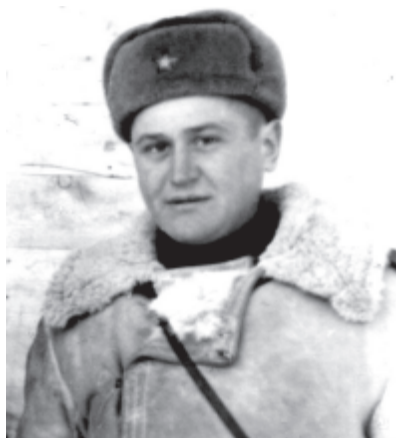
Старшина заставы. 1951.

У каждого был свой конь, за которым было много ухода. Когда ночью возвращались на заставу, в первую очередь надо было обтирать ноги лошади, особенно в зимнее время, когда они все в сосульках. Дать ей сена, потом зайти на заставу, чистить оружие, вернуться к лошадке, дать ей воды – ведро, полтора, потом дать овса. И только после этого можно было ложиться спать.