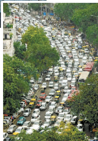
7月31日,在印度新德里市中心,停电引发了交通拥堵。

印度7月30日和31日连续两天发生大面积停电,全国6亿多人口陷入黑暗之中。“黑色星期二”成为印度各大媒体的醒目标题,似乎在提醒人们,印度在经济高速增长过程中依然长期受到基础设施不足的困扰和拖累。 印度是个严重缺电的国家,平均缺电10%以上,有的地方缺电超过20%,以至于各地轮流拉闸限电成为家常便饭。不少专家指出,没有充足的电力,印度无法维持每年8%以上的经济增长。 最近半年来印度经济的表现也印证了这些担心和预测。据统计,印度经济增长在2012年第一季度跌至9年来最低点,仅为5.3%,而去年同期这一数字为9.2%。国际评级机构6月份对印度的评级也降至最低,仅比垃圾级高出一级。英国《经济学人》的文章称,鉴于印度卢比大幅贬值,私人投资枯竭,GDP增速放缓,印度奇迹已成海市蜃楼。 印度基础设施的落后长期成为制约经济发展的一块“短板”,是导致海外投资驻足不前的一个重要原因,也凸显了印度政府管理能力的不足。 例如,当政府雄心勃勃地建设了一批热电厂时,却发现煤炭开采满足不了热电厂的需求。而煤矿因为多数为国有体制,人浮于事,效率低下,生产力难以满足市场的需求。 此外,贪腐也使印度基础设施的建设受到干扰。政府用于基础设施建设的拨款往往有一半被各级官员吞掉,导致资金不足,工期延长。 过去,印度通过发展高科技和承包软件设计赢得了“世界办公室”的美誉。但对于一个有着11亿人口的国家来说,只是发展软件和服务业,长期忽视制造业和基础设施建设,是无法解决人口就业和保持可持续发展的。 印度的窘境具有全球普遍性,折射出许多经济欠发达国家实现经济起飞时常常面临的基础设施的“短板”问题,从非洲、亚洲到拉美,概莫能外。“短板”是发展中出现的问题,也只有通过发展才能解决。(据新华社北京8月1日电)