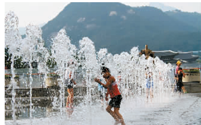
8月1日,一些孩子在韩国首尔戏水。首尔气象部门8月1日发布高温警报,首尔当天最高气温为35摄氏度,这是韩国自2008年启用高温预警机制以来首尔首次发布高温警报。此外,全州、光州、大田等地当天的最高气温均超过35摄氏度。据统计,今年韩国已有6人因高温死亡。

一,以石油工业为经济基础,可为巴西、阿根廷的工业提供能源。同时,委内瑞拉又是一个收入丰厚的国家,可为巴西和阿根廷制成出口开辟新市场,为巴拉圭和巴拉圭提供食品出口市场。 但巴西《圣保罗报》知名专栏作家克洛维斯·罗西对此持审慎态度,他警告说,必须关注委内瑞拉加入南共市带来的潜在风险,它有可能使南共市未来发展陷入复杂境地。他说,查韦斯的一些国内政策与南共市章程相悖,容易引发纠纷。另外,委内瑞拉的加入可能加大南共市与其他国家和地区进行贸易谈判的难度。