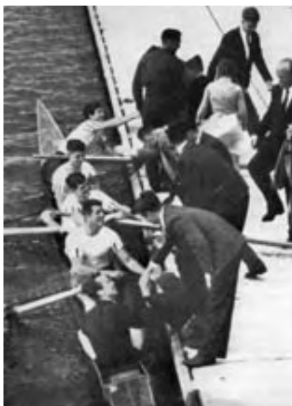
3 juni 1956