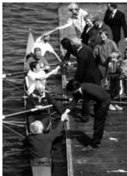
3 juni 2006

Op bladzijde 209 van het Gedenboek 1960 staat kort de onstuitbare reeks van overwinningen beschreven, culminerend in het Nederlands kampioenschap in de vier-met. Acht blikken in je eerste jaar, waaronder