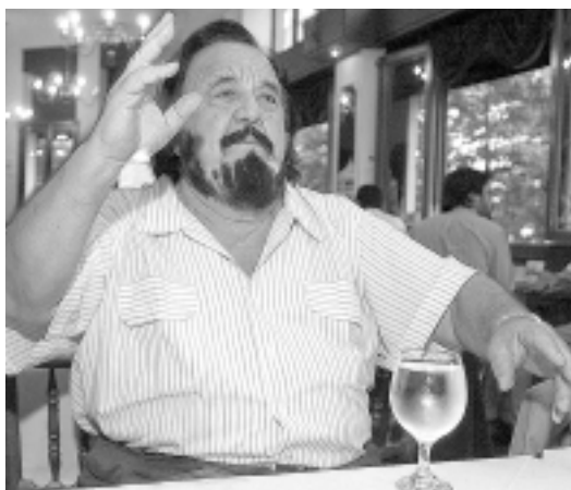
Nunca falta. Horacio Guarany dirá presente