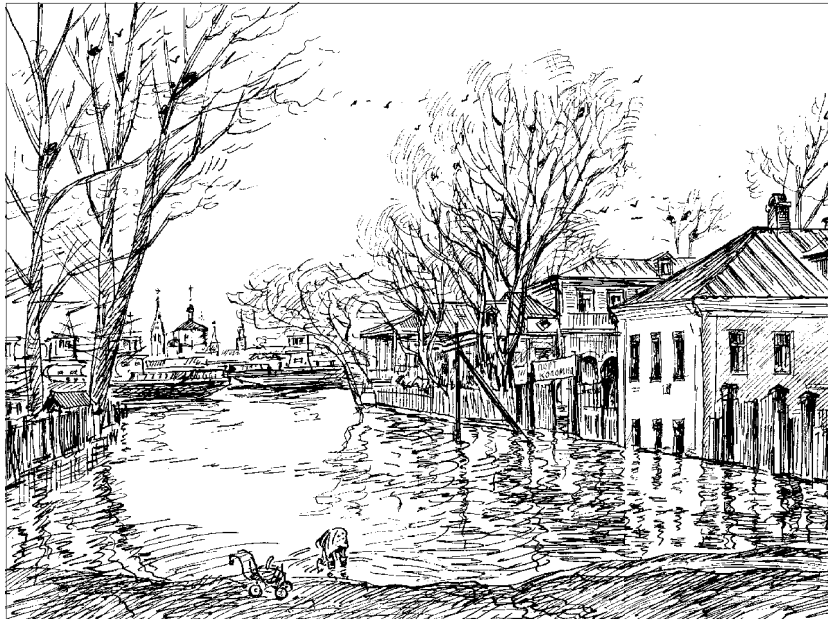
Рис. Алексея Фёдорова

Этот рисунок художник-краевед А.А.Фёдоров сделал несколько лет назад в Водовозном переулке. Ныне здесь сухое асфальтовое покрытие.