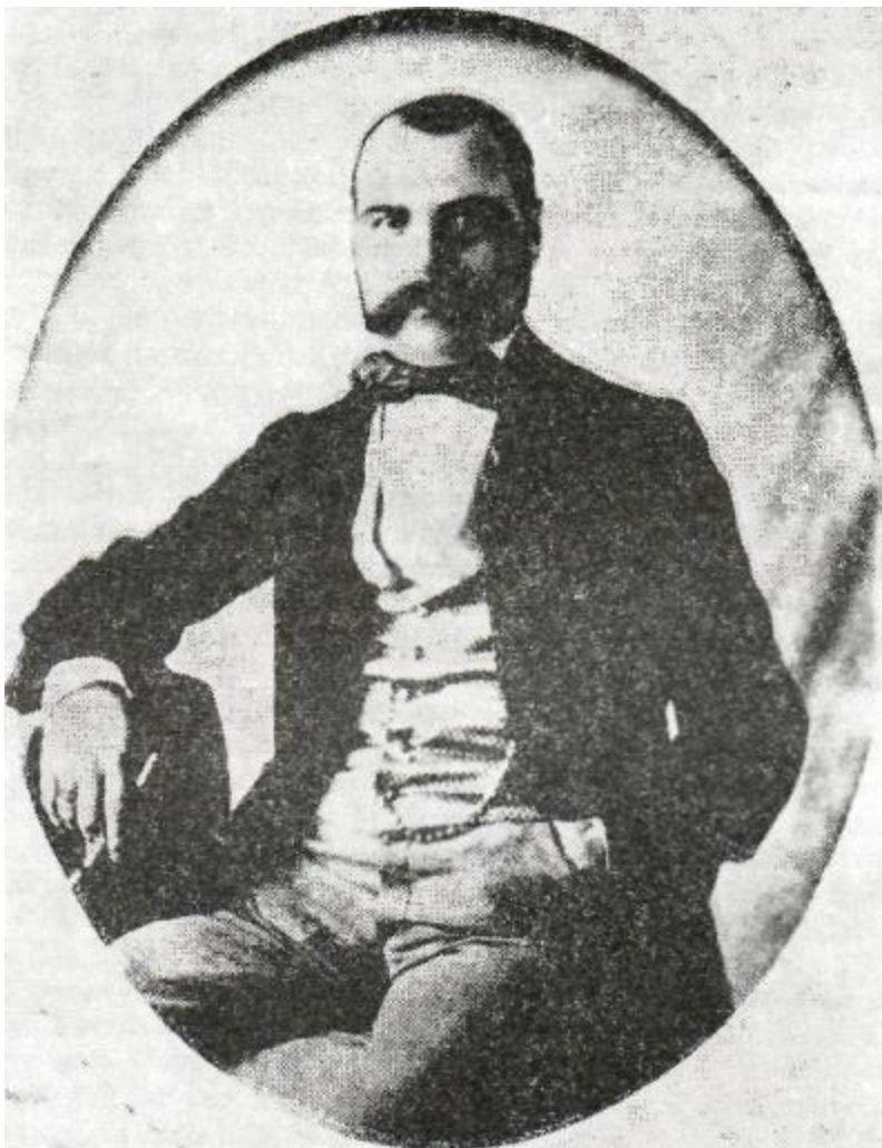
Jan Kozánek (1819—1890)

„V Přerově je tomu asi rok, co několik mladých mužů k držení časopisů a ke kupování knih českoslovanských se sřeklo. Z nepatrného začátku vyvinul se nyní čtenářský spolek 30 nebo 40 oudů počítajících, z nichžto, co právě nejpotěšitelnější jest, aspoň dvě třetiny stavu průmyslného a řemeslnického jsou. Drží Pražské noviny, Včelu, Květy, Pražského posla a Kocourkov, mimo to koluje laskavostí jednotlivců Poutník, Blahozvěst a Časopis musejní. Z dobrovolných měsíčních příspěvků na knihy koupila se už hezká hromádka českoslovanských knih, které spolu i s těmi, ježto někteří jednotlivci ze své zásoby k tomu za dar určili, činíce již nyní přes dvě stě svazků, za základ pro budoucí městskou knihovnu určeny jsou. Půjčují se nejen čtenářskému spolku, nýbrž komu se líbí, a zdá se, že už mnozí pro tento šlechetnější pokrm ducha zamilované posud hospodě a kartám se zpronevěřili, a jiní že ne jeden desetník místo šalivé loterie za knihy obětovali. Nemalou zásluhu v udržování pořádku s časopisy a knihami má pak učitel Vitásek. Dle přísloví: „Kde Slovan, tam zpěv“ vyloupl se z čtenářského spolku i malý zpěvný spolek, jenžto českými čtvero zpěvy a písněmi národními i jinými obveseluje a dobré věci prospívá. V minulém měsíci vystoupil ponejprv napolo veřejně před obecnstvem, ohledem na místo dosti četným. Ze zpěvů, buď sborem, buď čistým čtvero zpěvem, buď jednotlivým hlasem přednášených, líbily