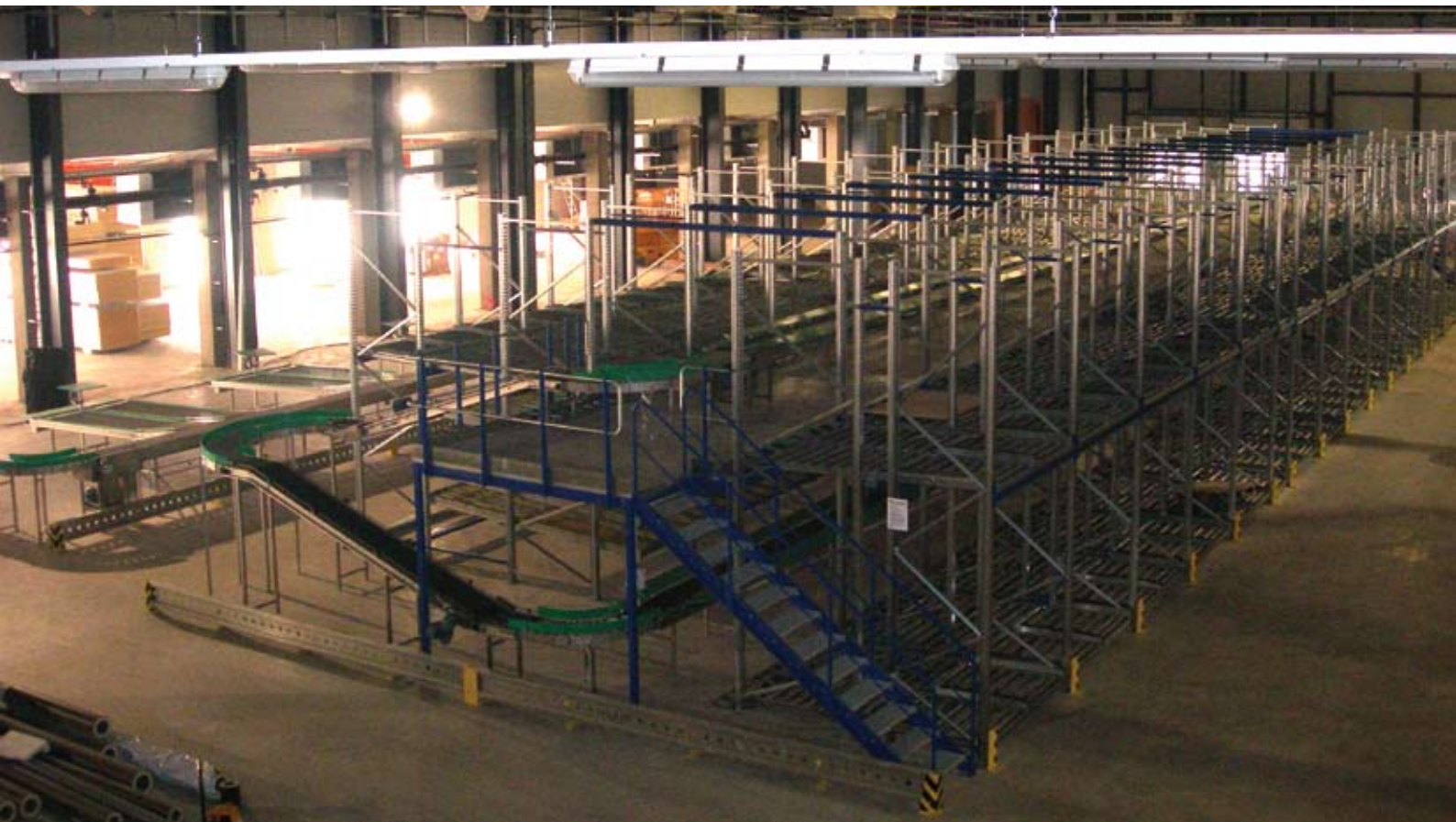
Fließbandanlage zur Zusammenstellung der Lieferungen

die Reinheit der Anlage zu gewährleisten, durch die 120 000 Millionen Liter Milch im Jahr fließen werden. Da Wasser demnach für die Milchfabrik auch einen erheblichen Kostenfaktor darstellt, hat sich Luxlait, die in Luxemburg-Stadt über eigene Brunnen verfügte, auf die Suche nach einer Möglichkeit gemacht, auf eigenes Wasser zurück greifen zu können. Und da an der