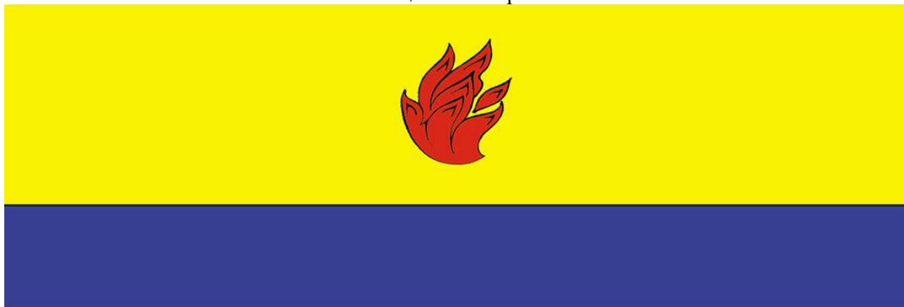
Рисунок флага муниципального образования – Жирновский муниципальный район в многоцветном варианте

Приложение № 5 к решению Жирновской районной Думы 17.07.2009 г. № 51/288-Д