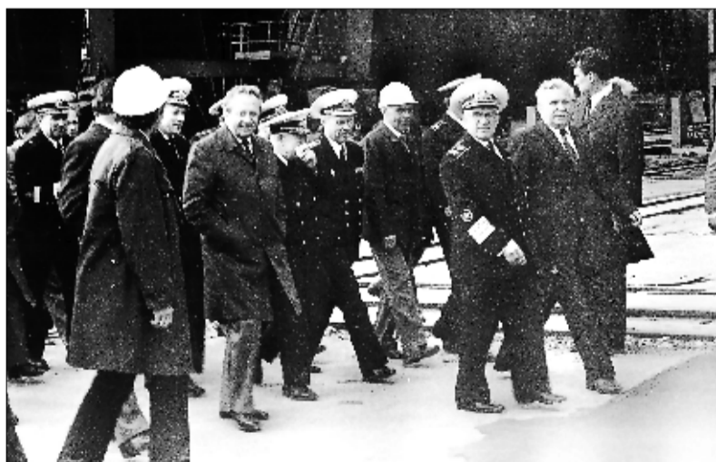
Главком ВМФ СССР С. Г. Горшков на предприятии в сентябре 1984 года.