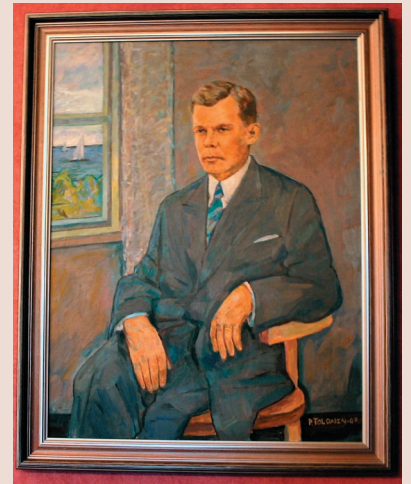
Kaupunginjohtaja Gösta Norio Taiteilija: Paavo Tolonen, 2007 Sivu 3