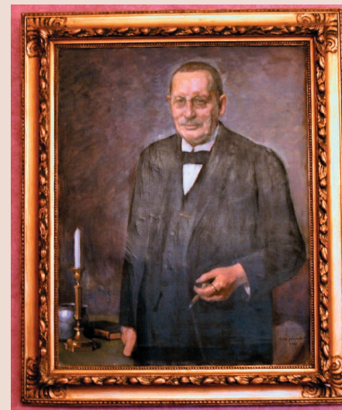
Vuorineuvos Arthur Lagerlöf Taiteilija: Eero Järnefelt, 1921 Sivu 8