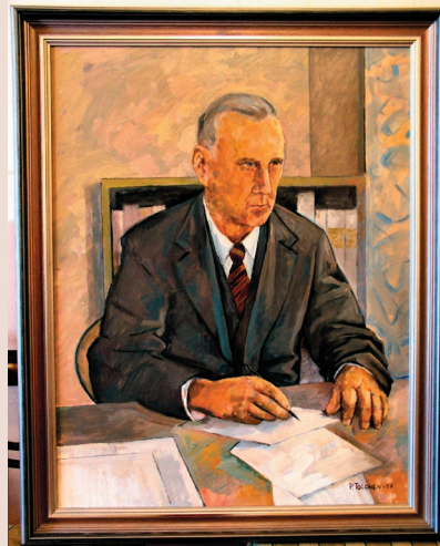
Kaupunginjohtaja Arvo Tenkanen Taiteilija: Paavo Tolonen, 2007 Sivu 5