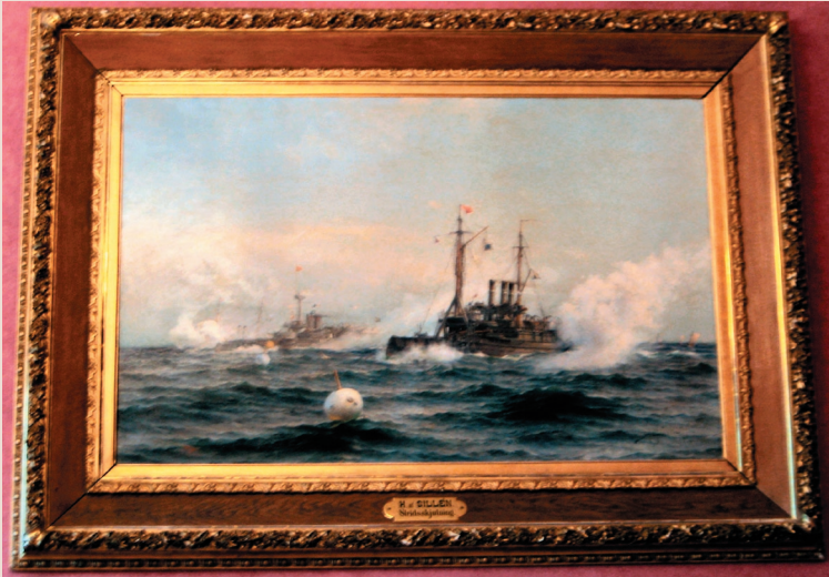
Stridskjutning. Taiteilija: Herman af Sillén, 1894 Sivu 2