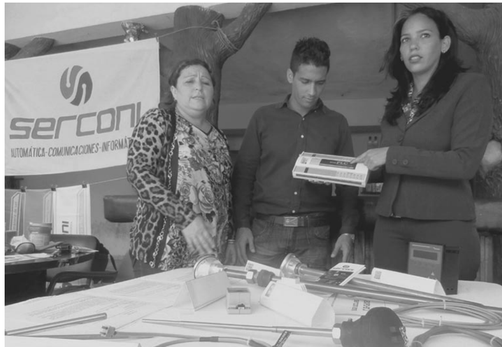
Los jóvenes ingenieros y técnicos destacan en las producciones de la empresa Serconi, del Grupo Empresarial del Níquel en Moa.

Con un colectivo en el que predominan los ingenieros y técnicos graduados en el Instituto Minero Metalúrgico, Serconi contribuye, además, con la automatización en los hornos de reducción de la empresa niquelífera Ernesto Che Guevara.