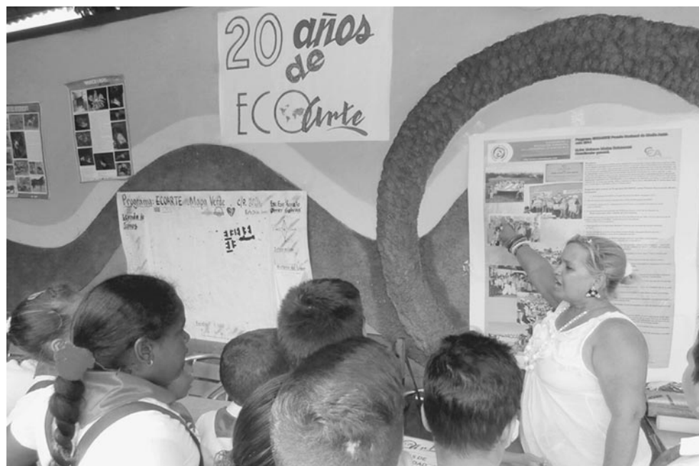
El proyecto medioambientalista Ecoarte desempeña un importante papel en la formación vocacional de las nuevas generaciones de moenses.

«Se trata de elaborar lo mismo una pieza o un aditamento, para extender su vida útil, disminuir costos, incrementar la eficiencia, y causar el menor daño al medio ambiente. En eso, es innegable que el mayor tesoro con que contamos en la tierra del níquel, y en el país, son los técnicos y profesionales que ha formado la Revolución», sentenció el joven dirigente.