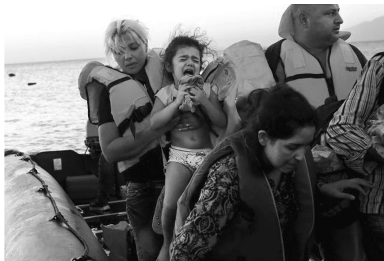
Decenas de inmigrantes son rescatados en alta mar, pero miles mueren en la travesía.

Desde el 14 de noviembre Costa Rica ha otorgado unas 6 000 visas de tránsito a migrantes cubanos y el viernes el Gobierno tico anunció que había dispuesto el cierre definitivo de la lista de personas que pueden aspirar a una visa transitoria. Subrayaron que quienes sean descubiertos de manera irregular en territorio costarricense serán deportados.