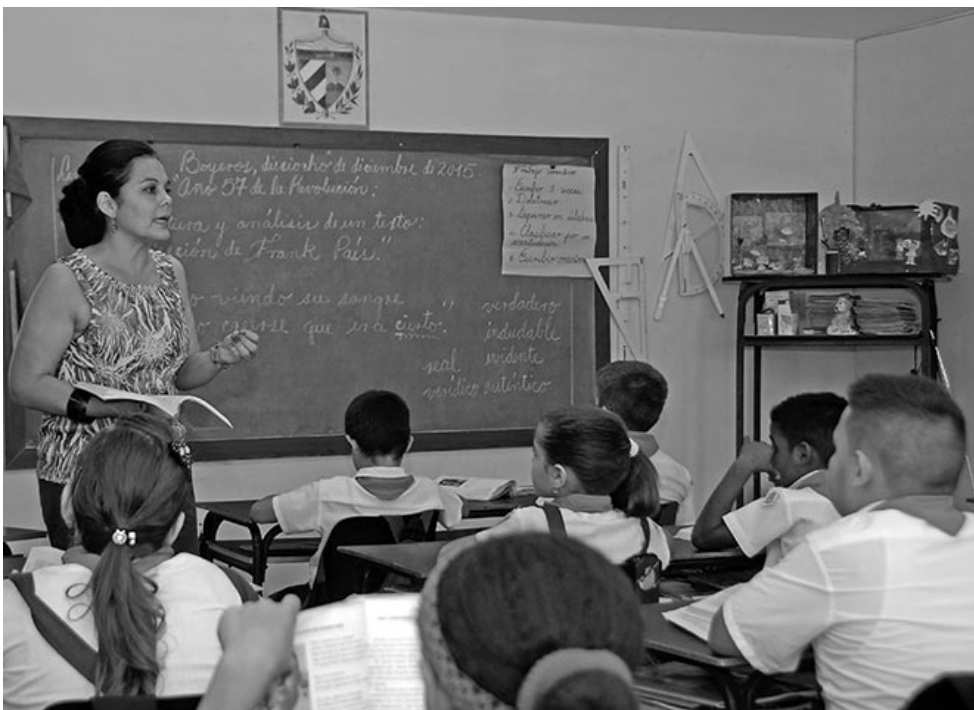
Los maestros seguirán transitando el camino hacia una mayor calidad de la educación, destacó en Santiago de Cuba la titular del ramo, durante la celebración principal de este 22 de diciembre.