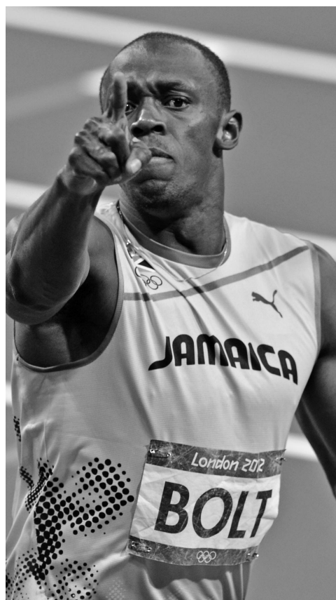
El jamaicano Usain Bolt y la colombiana Caterine Ibargüen, las individualidades más votadas en la tradicional encuesta.

El monarca universal en 100 y 200 metros, además integrante de la cuarteta ganadora del relevo de 4x100 metros en la cita de Beijing 2015, recibió 52 votos como el atleta más sobresaliente. Por su parte, Messi acaparó 18, y con seis quedó el futbolista chileno Alexis Sánchez, reconocido como parte de la Roja de América. Más cerrada resultó la disputa entre las mujeres, pero la colombiana Ibargüen se «estiró» hasta los 23 votos, escoltada de cerca por la velocista jamaicana Shelly-Ann Fraser (18) y la portuguesa cubana Yarisley Silva (17).