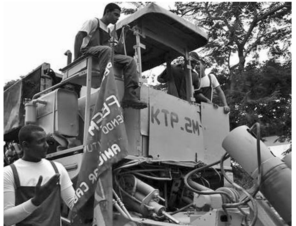
El éxito de esta contienda depende en gran medida de la motivación y la iniciativa de los más noveles, se dijo en el Activo Nacional Juvenil del sector.