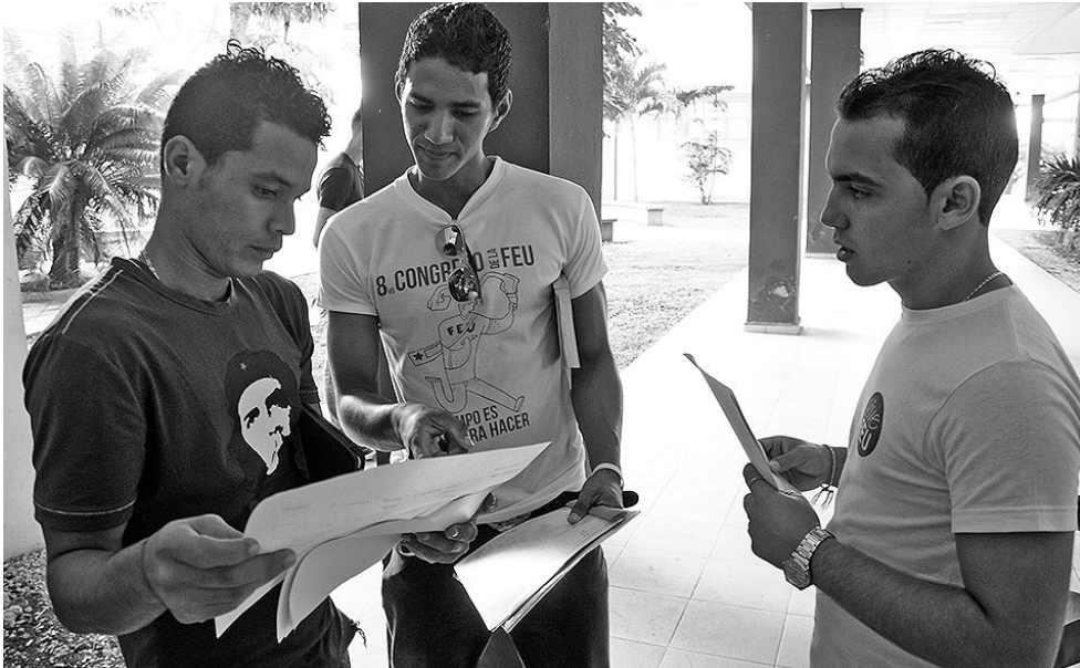
La reducción de las carreras a cuatro años en el curso regular diurno permitirá acceder al empleo más rápidamente.