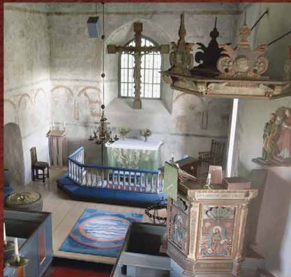
Korväggen pryds av renässansmålningar med bågställningar. Under dessa finns rester av medeltida utsmyckningar. The chancel wall is decorated with Renaissance paintings with arch motifs. Beneath these are the remains of mediaeval decorations. Die Wand des Chores ist dekoriert mit Renaissance-malereien mit Bogenreihen. Unter diesen finden sich Reste mittelalterlicher Ausschmückungen.