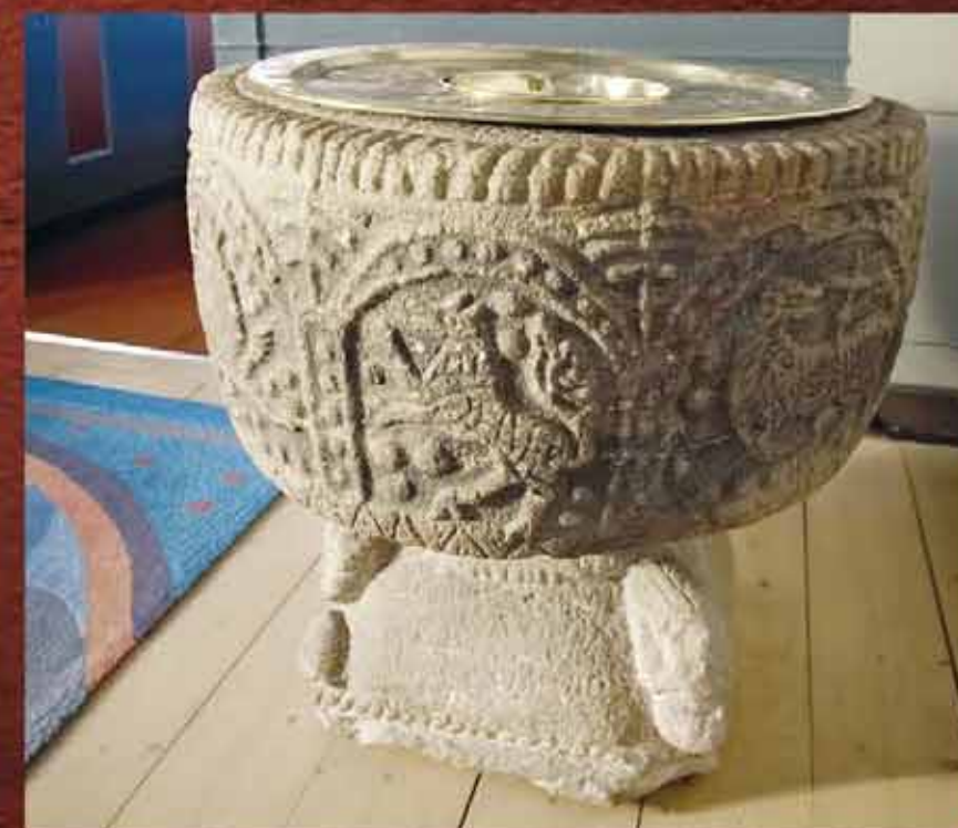
Dopfund med fabeldjursdekor. Font with fabulous animals. Mit Fabeltieren verziertes Taufbecken.