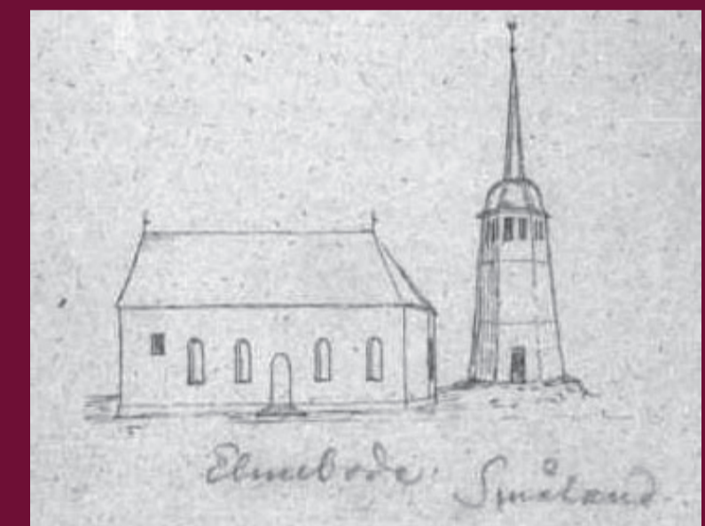
Teckning av Älmeboda kyrka hämtad ur verket Smolandia Sacra.