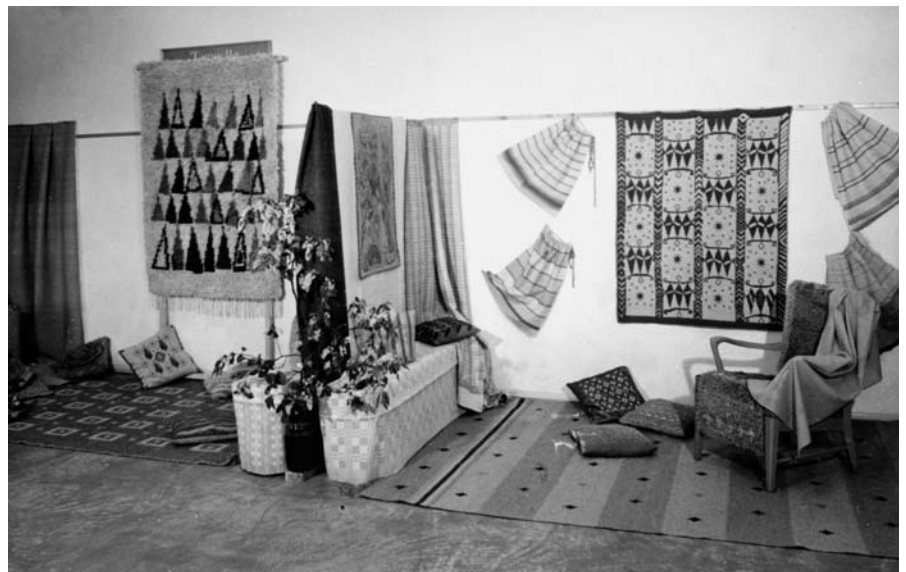
Loimaan naiskotiteollisuuskoulun (nyk. Loimaan ammatti-instituutti) oppilastöiden keväänäyttely, 1956.

Kotiteollisuuskoulut erosivat siis ammatiasemaan kasvattavista käsityöläiskouluista siinä, että niiden opetuksesta puuttui yleissivistävä, ammatiasemaan kasvattava aines. Esimerkiksi 1890-luvulla käsityöläiskoulujen tarkastaja oli siirtänyt ainoat kaksi maaseudulla toiminutta käsityöläiskoulua kotiteollisuuskoulujen ryhmään, sillä koulujen opetuksen taso ei pidetty käsityön ammattimaiseen ope-