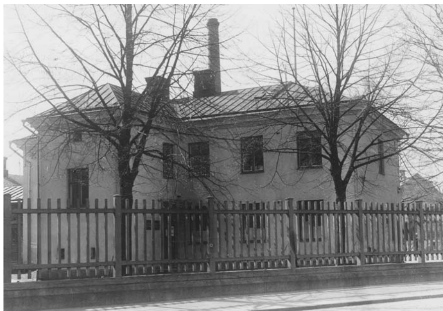
Turussa Bell-Lancaster -koulu toimi aikoinaan osoitteessa Linnankatu 2, jossa nykyisin sijaitsee Turun kaupunginkirjasto – Varsinais-Suomen maakuntakirjaston kanslia. Rakennus on suojelukohde.

Järjestelmänä käsityöammatin oppiminen toisen palveluksessa työskennellen alkoi hiipua vuoden 1859 elinkeinovapauden ja vuonna 1868 tapahtuneen ammattikun-tien lakkauttamisen myötä. Vuonna 1879 elinkeinovapaus täydentyi, sillä tuolloin vapautuivat myös loput 15 yleisintä am-mattia. Elinkeinojen vapautumisen syy-