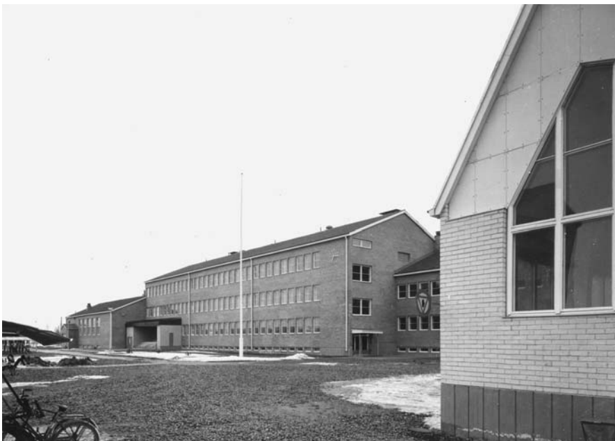
Lapin keskusammattikoulu, 1970-luku, Rovaniemi.

Jo aikoinaan Suomen Talousseuran keuruukoulujen opettamat taidot olivat antaneet koulun käyneille mahdollisuuden hyviin ansioihin ja ammattiin. Koulusta päässeet saattoivat ammattikuntasäännöksistä piittaamatta ryhtyä harjoittamaan ammattikudontaa sekä tehdä tilaus- ja myyntitöitä haluamallaan paikkakunnalla. Maaseudulla tehty kudontatyö kilpaili kaupunkien käsityön kanssa. Usein kaupunkikäsityöläiset pitivät maaseudun käsityöläisiä epäpätevinä mm. siksi, ettei maaseudulla työskenteleviltä vaadittu ammatilliseen asemaan kasvamista kuten kaupunkilaiskäsityöläisiltä. Ammatillinen arvovalta kiista saattoi kärjistyä jopa käsirysyksi kuten kävi aikoinaan Porvoossa, jossa kaupungin kankurit ja kaupunkia ympäröivän maaseudun kutojat tappelivat keskenään. 64