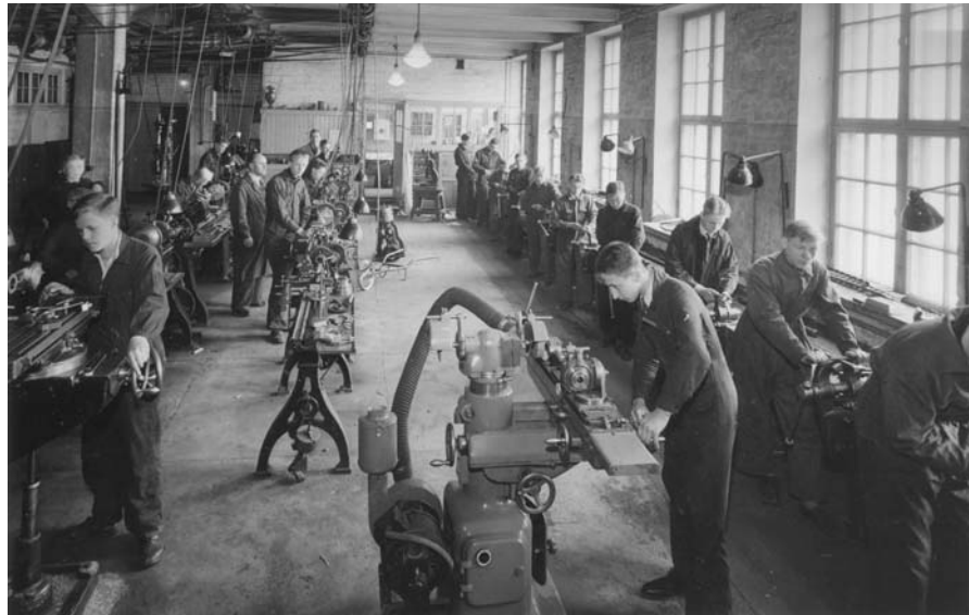
Poikain valmistavan ammattikoulun metallipuolen oppilaat työssä Helsingin Sörnäisissä vuonna 1939.