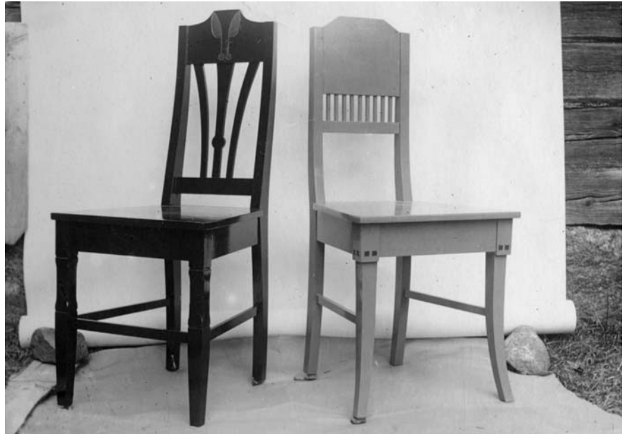
1910-luvun alussa Jalasjärvellä Etelä-Pohjanmaan kotiteollisuusyhdistyksen mieskäsityökoulussa oppilastyönä tehtyjä jugend-henkisiä tuoleja.