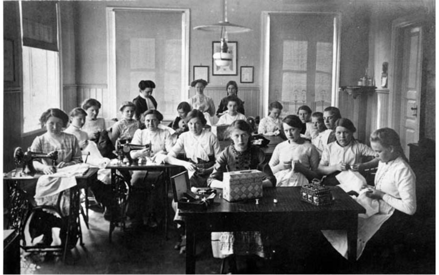
Porvoon kutomakoulun naisopiskelijoita 1900-luvun alussa, jolloin luokkahuone valaistiin vielä öljylampulla ja ompelukoneet olivat poljettavia.

Vuonna 1887 valtionvaraintoimituskunta teki kotiteollisuuden tilasta ja tulevaisuudesta uuden laajan selvityksen, johon kerättiin tietoja kuntien talous- ja maanviljelysseuroilta. Selvityksen seurauksena