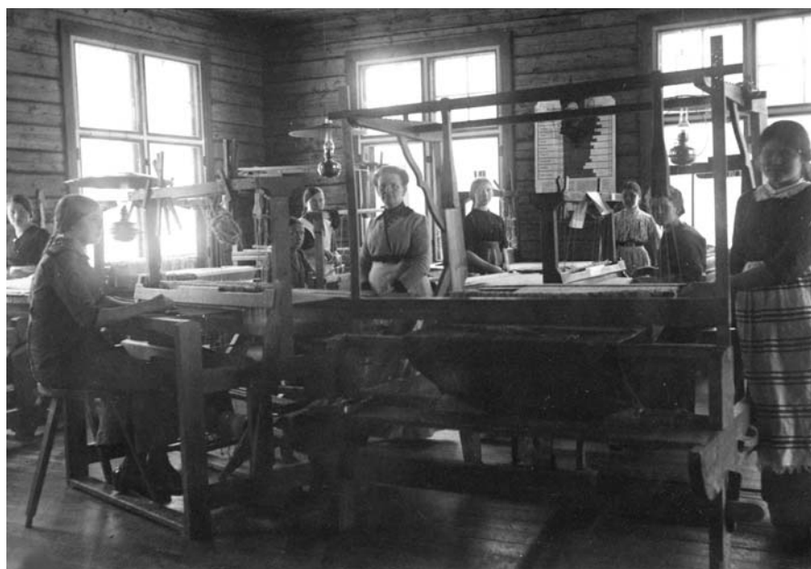
Säkkijärven kutoma- ja käsityökoulun nuoret oppilaat opettajansa kanssa, 1910-luku.

Monen muun oppialan tavoin kotiteollisuuskoulut liitettiin yhtenäisen ammatillisen koulutuksen osaksi Suomessa vuonna 1968, jolloin ammattikasvatushallitus siirtyi kauppa- ja teollisuusministeriöstä opetusministeriön alaisuuteen. Muutos ei tapahtunut ilman kitkaa. Kuten aiemmin on jo tullut esille, oli ammatillisen opetuksen käsite muotoutunut ammattikuntaperinteisen käsityön ja teollisuuden piirissä. Uuden viraston alaisuuteen kuului opetusta kaupallisesta alasta sosiaali- ja