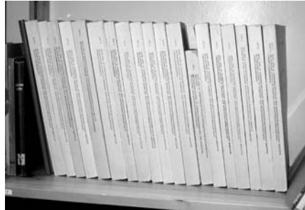
Osa vuoden 1977 koti-, käsi- ja taideteollisuusalan opetussuunnitelmatoimikunnan mietintöjen sadosta.

Keskiasteen koulutuksen uudistuksen laajuus teki muutoksesta hitaan. Myös uudistustyön hyödyntämisaika jäi melko lyhyeksi, sillä edessä hämmötti jo uusi nuorisasteen ja ammattikorkeakoulujen opetuksen uudistus. Keskiasteen uudistuksen myönteisin anti lienee ollut, että se teki ammattikasvatuskentän aiempaa