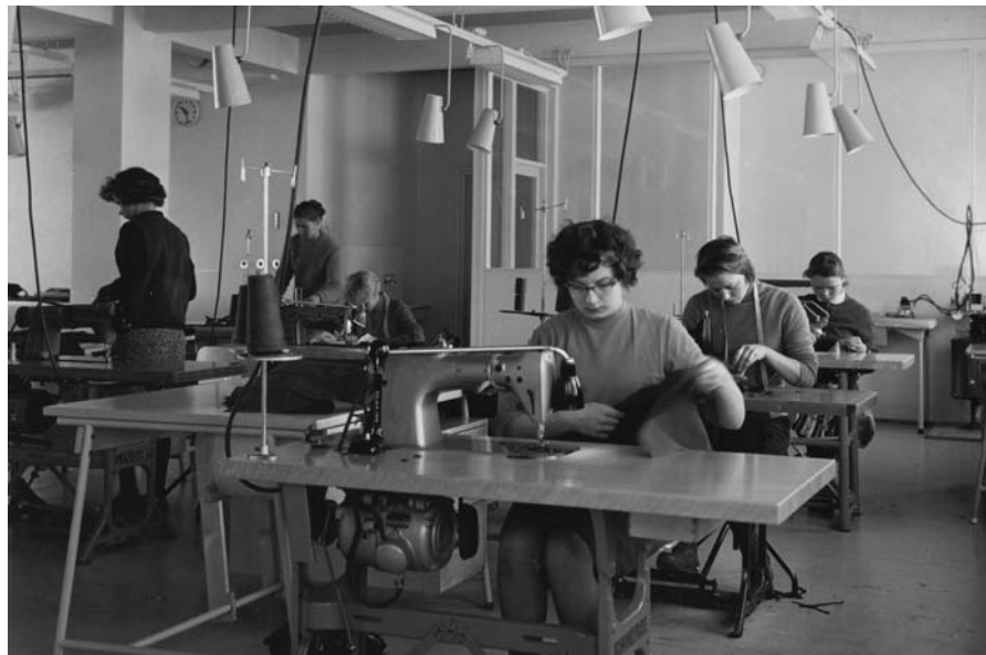
Pohjois-Savon ammattioppilaitoksen teollisuusompelun luokka ompelukodeiden ääressä, 1960.

Varsinaisen perinteisen ammattilaiskäsi- työn puolella ammattikoulutus oppilas- kasvatuksena jatkui hiipuvana työssäop- pimisena ja erikoisammattikoulujen kou- lumuotoisena opetuksena. Käsitöitä ope- tettiin myös ns. varsinaisen ammatillisen opetuksen piirissä. Etenkin valmistavissa ammattikouluissa käsityömäinen versta- styöskentely pysyi keskeisenä. Esimerkiksi tyttöjen valmistavissa ammattikouluissa ompelulla oli keskeinen sija. Raja käsi- työllisen ja teollisen valmistamisen välillä ei ollut selkeä. Mm. metalliala muistutti tehdasolosuhteissakin käsityötä sikäli, että siinä edelleen vaadittiin käsityömäis- tä, monia työvaiheita ja erikoistekniikoita vaativaa osaamista. Metallialan korkean taitovaatimustason vuoksi työntekijän asema oli lähempänä perinteistä mesta- ria kuin suoraan kansakoulunpenkiltä tul- lutta, vaihetyötä tekevää palkkatyöläistä, joka usein oli vallitseva puu- ja tekstiili- alalla. Perinteiset käsityöammatit kehiti- tyivät yhä enemmän pienteollisuudeksi. 45 Vuonna 1966 ammattikasvatusosasto