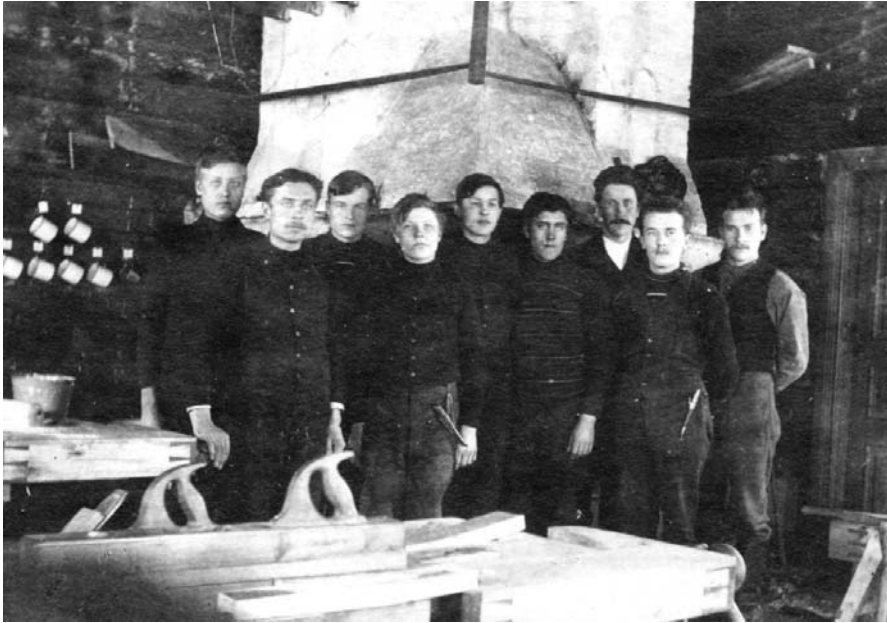
Puuseppäammattikoulun (nyk. Jurvan käsi- ja taideteollisuusoppilaitos) ensimmäisen kurssin oppilaita vuonna 1912.

sinkin mieskotiteollisuuskouluissa jatkuvana ongelmana oli pätevien opettajien puute. Koulujen toiminta jäi usein oman onnensa nojaan, sillä niiden työn tulokset riippuivat paljolti paikallisesta aktiivisuudesta. Monet koulut aloittivat kaupungeissa, joten ne eivät tavoittaneet alunperin ajateltua kohderyhmää, maaseudun tilatonta väestöä. Kaupunkilaiskoulut palvelivat lähinnä työväkeä tai peräti varakkaan porvariston tyttäriä, joiden kasvatukseen käsityö olennaisesti vanhastaan kuului. Maaseudunkin kouluissa tuntui käyvän lähinnä talollisten tyttäriä täydentämässä kapiotaan. Suuri osa kaupunkikouluista sijaitsi Itä- ja Pohjois-Suomessa, jossa kaupungit olivat