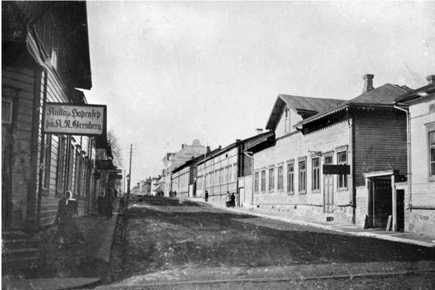
Kaupunkien käsityöläisten ammatillisuuteen kuului ammatillisten taitojen lisäksi myös ammattiin liittyvän statuksen omaksuminen. Kello- ja hopeaseppä K. N. Grenbergin liike näkyi 1900-luvun alun jyvaskyläisessä katukuvassa Kauppa- ja Asemakadun kulmassa.