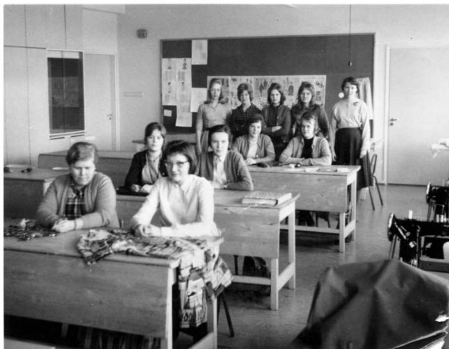
Jämsänkosken ammattikoulun pukuompelun (nyk. Jämsän seudun koulutuskeskus, vaatesala) osaston tyttöjä opettajansa kanssa 1950- ja 1960-lukujen taitteessa. Kuva Suomen käsityön museo

Komitean työn tuloksena saatiin vuonna 1942 ammattikoulutukselle uusi laki. Ammattiopetus jakautui valmistaviin ammatikouluihin, yleisiin ammatikouluihin ja erikoisammattikouluihin. Yleiset ammatikoulut vastasivat entisiä yleisiä ammatilaiskouluja ja tarjosivat sekä teoriaa että käytännön työharjoitusta työssäkäyville