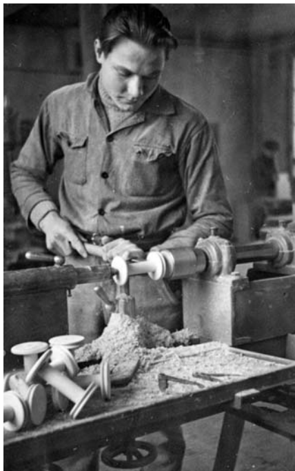
Lepäälän mieskotiteollisuuskoulun (nyk. Pirkaanmaan Taitokeskus) oppilas sorvaamassa, 1953.

Pientilavaltaisesta maatalouspolitiikasta huolimatta poliittinen johto näki maan kehityksen avaimet teollisuudessa. Ammattikasvatushallituksen johdolla ammattikasvatuksesta tuli vahva yhteiskuntapolitiikan väline ja osa sodanjälkeisen Suomen yleistä talous- ja koulutuspolitiikkaa. Kun vuonna 1940 vielä 64 % työvoimasta toimi alkutuotannossa, oli osuus 30 vuotta myöhemmin, vuonna 1970 enää 20 %. Rakennemuutosta ja elinkeinoelämän painotuksen siirtymää maataloudesta teollisuuteen tuettiin lisäämällä teollisuuden koulutuspaikkoja. Ammattioppilaspikkavelvoite tuki kouluttautumista kaupungeissa teollisuuden ammatteihin. Myöhemmin koulutuksella tuettiin palvelualojen kasvua. Ammattikoulutuspolitiikalla on siis paitsi vastattu muuttuvan yhteiskunnan tarpeisiin, myös suunnattu tätä muutosta. Maaltamuutto ei kuitenkaan ollut vain hallinnollisten ratkaisujen tai niiden puutteen tulosta. Ihmiset halusivat tarttua tarjottuihin, elintasoa nostaviin koulutusmahdollisuuksiin. Maaseudun nuorten muuttaessa joukoittain