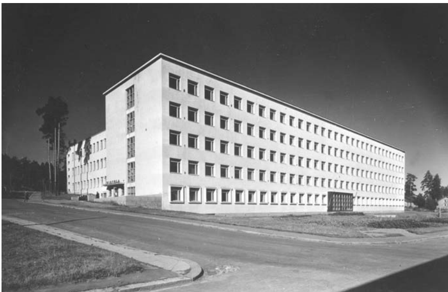
1940-luvun lopulla valmistunut Tampereen ammattikoulu, joka nykyisin tunnetaan nimellä Tampereen ammattiopisto, Pyynikin yksikkö.

Suomalainen ammattikoulujärjestelmä uudistettiin jälleen vuonna 1959. Samana vuonna Taideteollinen opisto muuttui valtion Taideteolliseksi korkeakouluksi. Uusi laki vahvisti alueellisen ammattikoulujärjestelmän, jonka tuloksena rakentui nopeasti koko maan kattava ammattikouluverkosto. Olennaista uudessa laissa oli ammattikoulutusvelvoite, jonka mukaan kuntien tuli ylläpitää aloituspaikkoja omassa tai toisen kunnan alueella sellaisessa yleisessä ammattikoulussa, jossa olivat edustettuna vähintään metal-