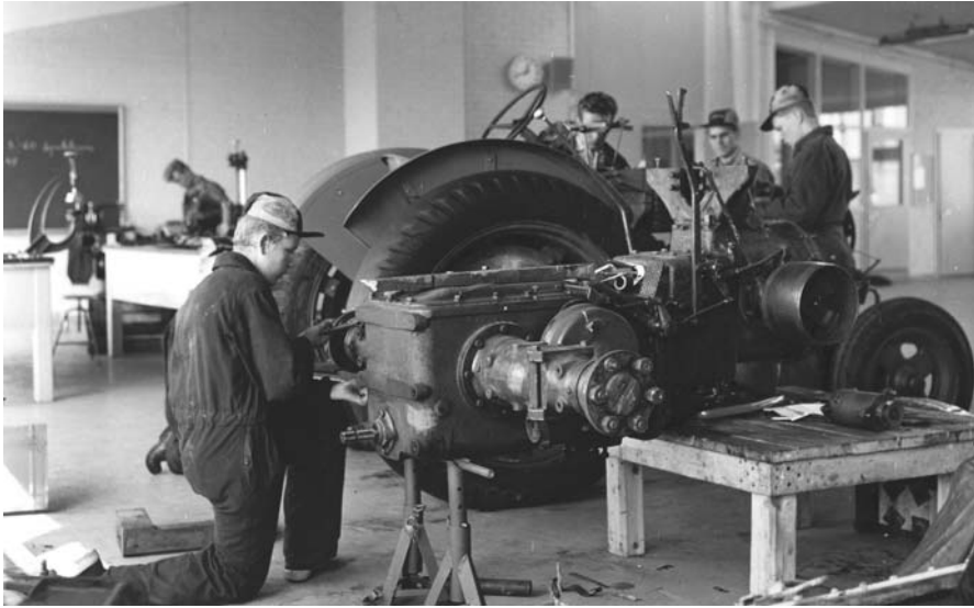
Pohjois-Savon ammattioppilaitoksen maatalouskonekorjaamon ensimmäinen luokka vuonna 1960.

voitteisiin haluten alan opetukseen lisää tuotesuunnitteluun liittyviä aineita. Uuden koulutuksen tuli antaa niin vankka ammatillinen pätevyys, että se mahdollistaisi sijoittumisen ammattiin. Koulutuksen tuli silti olla myös niin laaja-alaista, että työntekijä sopeutuisi mahdollisiin tuotantorakenteen muutoksiin. Toimikunnan ehdotukset jäivät odottamaan lähes tyvää koulunuudistusta. 99