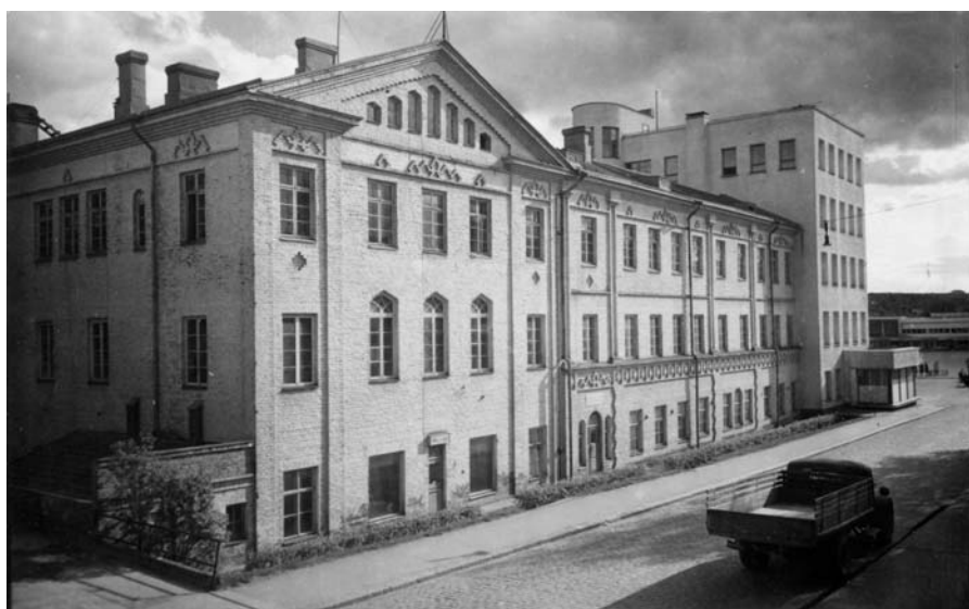
Fredrika Wetterhoffin perustama, alunperin työkoulu, on nykyisin osa Hämeen ammattikorkeakoulua. 1930-luvun lopulla Fredrika Wetterhoffin kotiteollisuusopettajaopisto toimi vanhassa tiilisessä päärakennuksessa sekä tuolloin vasta valmistuneessa funktionalistishenkisessä uudessa osassa. Nykyisin Wetterhoffissa toimii Hämeen ammattikorkeakoulu ja Koulutuskeskus Tavastia.

Yhteiskunnan kehitys asetti myös kotiteollisuuskoulutukselle uusia haasteita. Vuonna 1957 asetettu kotiteollisuuskomitea pohti kotiteollisuuskoulujen ajankäytöstä sekä niiden asemaa maa-seudun nuorison ammattikoulutuksessa. Uusi kotiteollisuuskouluja koskenut lain-