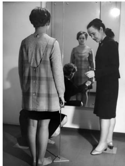
Lempäälän kotiteollisuuskoulun (nyk. Pirkanmaan Taitokeskus) oppilas tarkistaa esiliinan helman pituutta opettajan ohjauksessa, 1967.

Myös vuoden 1928 ammattikoulukomitean kanta paljon kiisteltyyn kansakoulujen jatko-opetukseen osaltaan osoitti, kuinka erilaista suhtautuminen tyttöjen ja poikien ammatilliseen opetukseen tuohon aikaan oli. Komitean käsityksen mukaan kansakoulujen jatkuoluokat tarjosivat riit-