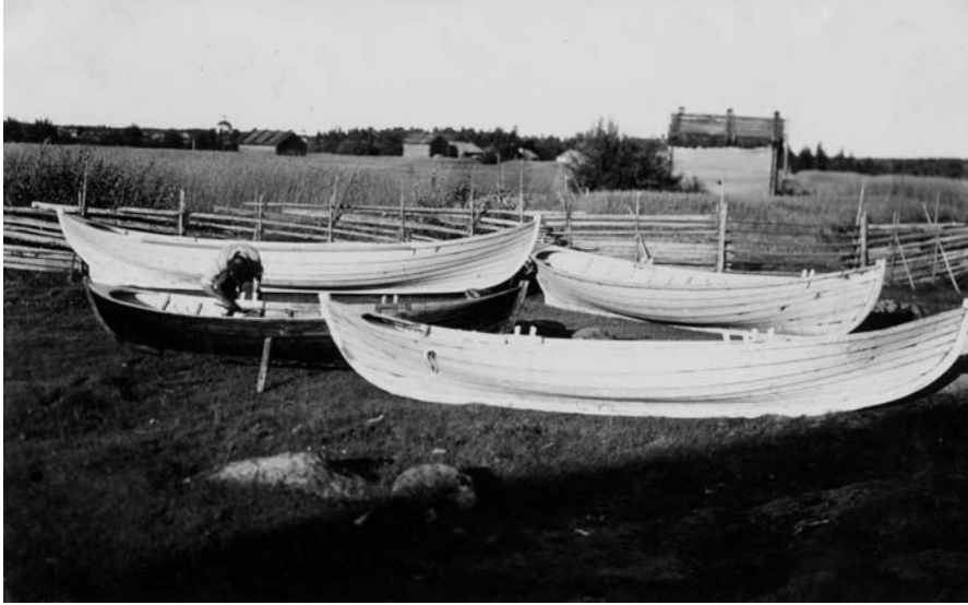
Pyhjärven Etelän kylässä kesä- ja heinäkuussa 1940 järjestetyillä kursseilla veistettyjä soutuveenit.

tena. Ammattikasvatuksen kysymyksiä käsiteltiin kunkin alan hallinnon sisällä. Eri ammattialoja kehitettiin toisistaan riippumattomissa elinkeinojen edistämishjelmissä. Hallinnossa ei vielä pyritty keskittettyyn, koko ammattikasvatuskenttää koskevaan valtiolliseen kontrolliin ja kehitystyöhön. Monilla aloilla elinkeinoelämällä ja aatteellisilla yhdistyksillä oli vahva, puolivaltiollinen rooli elinkeinon edistämisessä. 47