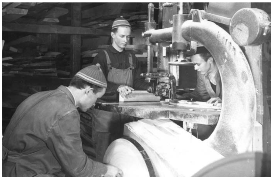
Tulevia opettajia Valtion mieskotiteollisuusopistossa Lahdessa työskentelemässä vannesahalla, 1953.

Yleissivistävän aineksen puutteesta huolimatta kotiteollisuuskouluilla voidaan katsoa kuitenkin olleen myös kansalaiskasvatuksellinen puolensa. Jo vuoden 1800-luvun lopulta lähtien kotiteollisuuden kautta oli uskottu voitavan lisätä rahvaan ahkeruutta, jolla puolestaan katsottiin olevan siveyttä ja sivistystä kohottava vaikutus. Paikallisten mallien käyttö korosti perinteen ja talonpoikaisuuden tärkeyttä. Kotiteollisuuskoulujen lukuvuoden päättäjaisissä opettajien puheiden vakioaihe oli kotiteollisuuden ja kansan käsityön merkitys. Kotiteollisuuskoulutus oli osa maalla asuvan ihannekansalaisen kasvattamista. Varsinaisesti kotiteollisuuskoulut eivät kansalaiskasvatuksen osalta kilpailleet aatteellisesti missään vaiheessa esimerkiksi kansakoulun jatko-opetuksen kanssa, koska talonpoikainen kansalaisuus oli keskeinen ihanne molemmissa vielä 1940-luvullakin. Itse asiassa kansakoulu oli hyvä pohja kotiteollisuuskoulujen ja -neuvonnan oppien omaksumiselle. Sekä oppi- että ammatillinen koulutus alkoivat olla maaseudullakin yleistyvä sosiaalisen nousun väylä. Ne jopa edistivät maaltamuuttoa. Kansa-