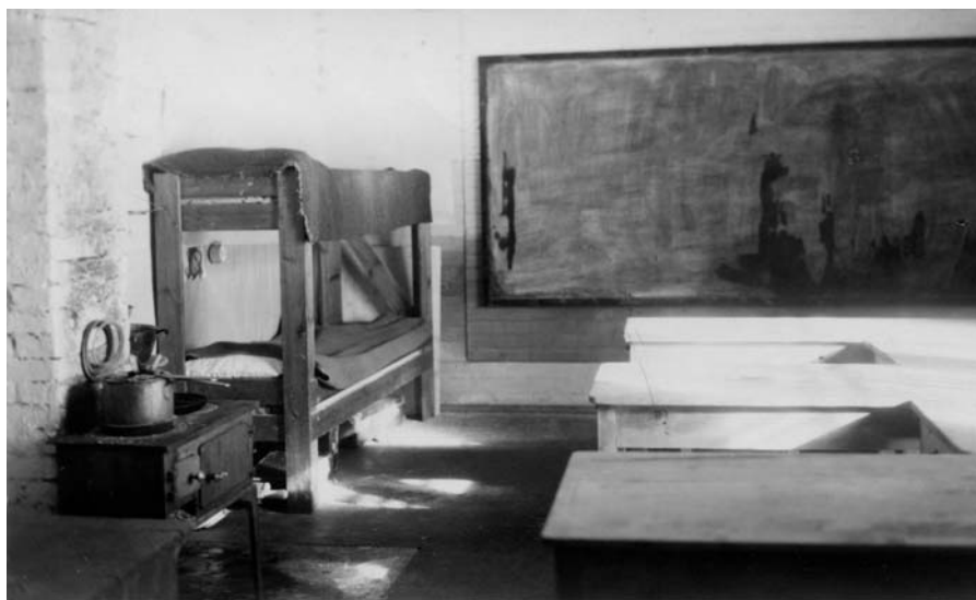
1950-luvulla kotiteollisuuskoulut tarvitsivat kipeästi uusia tiloja. Loimaan mieskotiteollisuuskoulussa tilanpuute oli ilmeinen. Oikealla luokahuoneen työpöydät ja liitutaulu ja vasemmalla liesi sekä kerrossängyt.

väkseen täyttäessään ammattioppilaitosten ylläpitovelvoitetta. Ongelmaksi osoittautui myös kotiteollisuusopettajien koulutus, sillä heitä valmistui yli alan oman tarpeen. Koska jokainen koulumuoto määritteli opettajiensa pätevyyden erikseen, kotiteollisuusopettajan koulutus kelpasi vain kotiteollisuusalan oppilaitoksissa. Siksi kotiteollisuusopettajia toimi muodollisesti epäpätevinä jopa alan alansa nimellispalkkaa pienemmällä korvauksella mm. kansa-, kansalais- ja oppikouluissa, kansalais- ja kansanopistoissa sekä yleisissä ammattikouluissa. Varsinkin kansalaiskoulut vetivät kotiteollisuusalan opettajia. Kansalaiskoulun opettajiksi kotiteollisuusopettajat pätevoitettiin vuoden pätevoitymisjakson turvin. 95