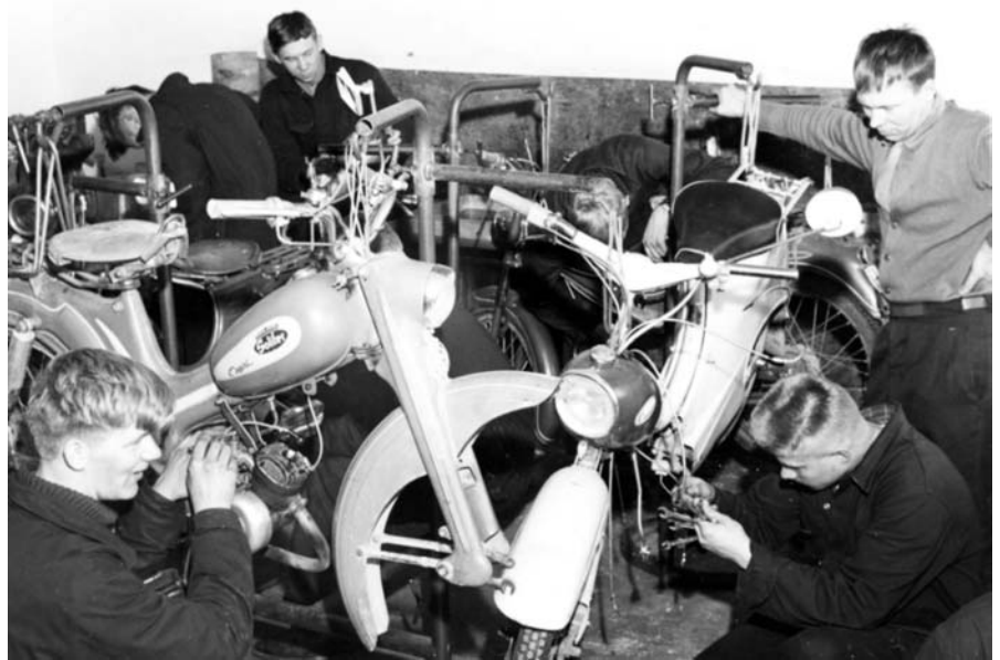
Kiteen ammatillisessa koulutuskeskuksessa keväällä 1964 järjestetyllä pienmoottoriasentajakursilla opiskeltiin kolme kuukautta korjaamaan erilaisia maaseudun pienmoottoreita kuten mopedeita, venemoottoreita ja lypsykoneita. Kursin tarkoituksena oli kouluttaa korjausalan ammattilaisia, joista maaseudulla oli 1960-luvulla puutetta.

Yhtenäisen hallinnon alle jouduttuaan maaseututaustaiset kotiteollisuusalan ja kaupunki- ja teollisuuspaikkakuntien ammatilliset koulut joutuivat kilpailemaan keskenään lupaavan tuntuisista aloista. Kotiteollisuuskoulujen väki oli pyrkinyt vastaamaan yhteiskunnan muutokseen 1950- ja 1960-luvuilta alkaen kehittämällä kouluista monipuolisia maaseudun ammattioppilaitoksia, joissa opetettiin mm. koneenkorjausta ja talonrakennusta. Samaan aikaan myös ammattikouluihin oli tullut uusia aloja. Esimerkiksi turkisala-