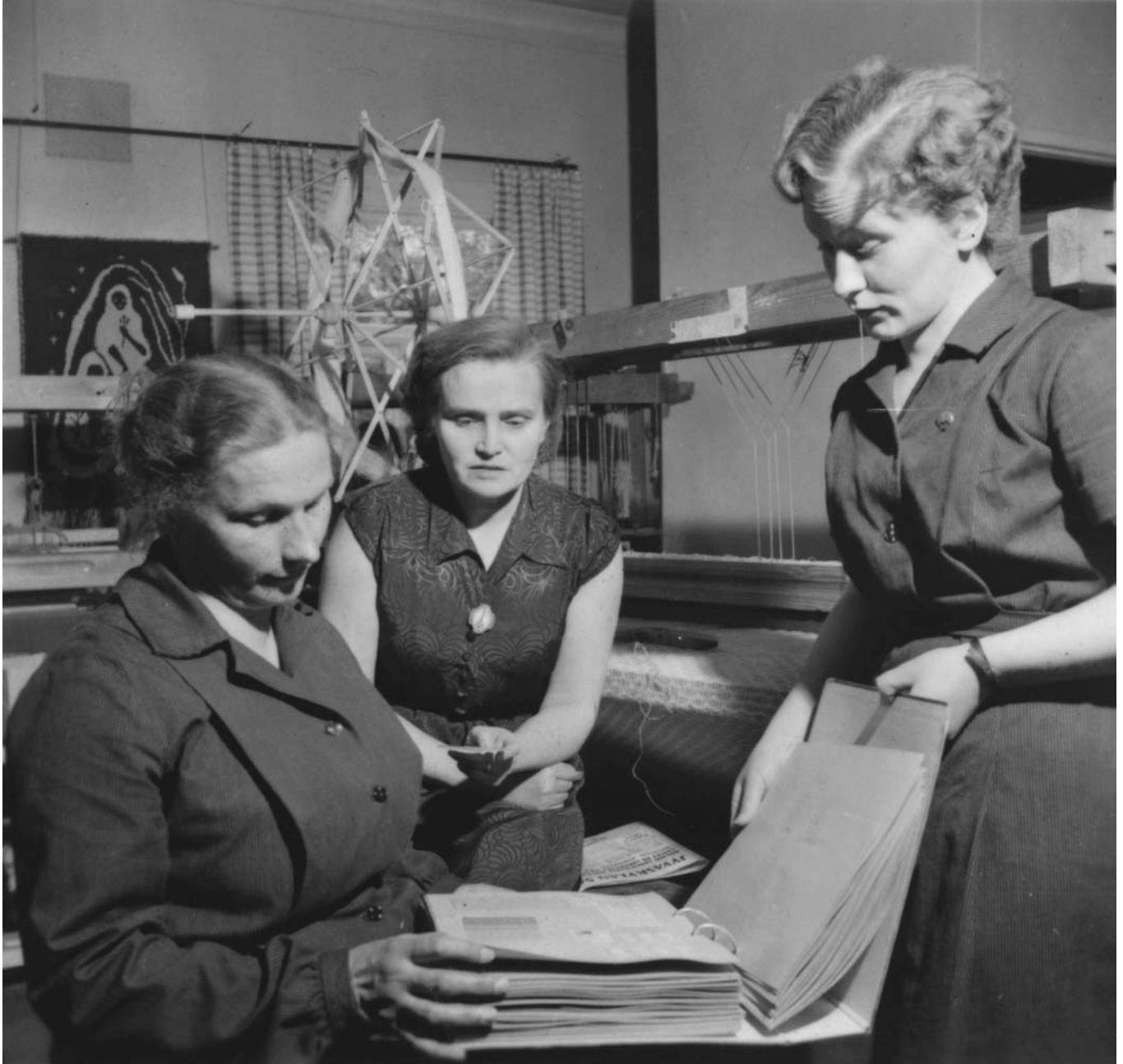
Maatalousnaisia tutkimassa käsityön mallikirjaa.