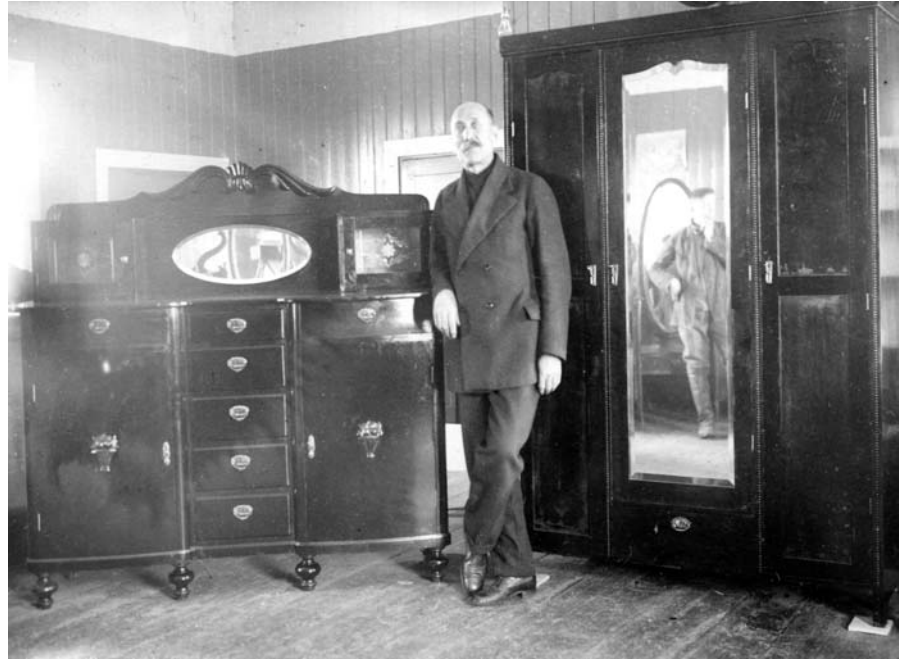
Ikaalisten kurssien kurssitalon tyytyväinen isäntä valokuvattuna valmistamansa kaapin vierellä marraskuussa 1930.