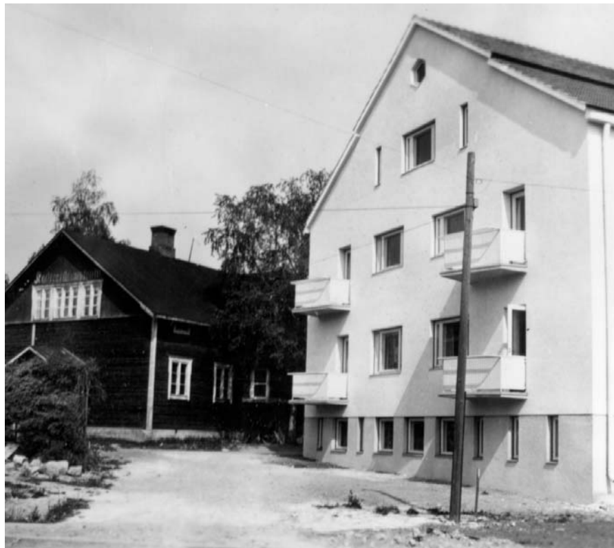
Vuonna 1954 vanha Tyrvään mieskotiteollisuuskoulu (nyk. Tyrvään käsi- ja taideteollisuusoppilaitos, Vammala) oli saanut rinnalleen uuden koulurakennuksen.

Vuonna 1964 kiertäviä kotiteollisuuskouluja oli Suomessa edelleen lähes 40. Kaikkiaan alan kouluja oli yhteensä 115. Valtio omisti niistä seitsemän ja kunnat 25. Suurin osa kouluista oli yhdistysten omistuksessa, joista merkittävin ryhmä oli eri puolilla maata toimivat kotiteollisuusyhdistykset. Sellaiset maaseutukunnat, joilla ei alueellaan ollut ammattillista koulutusta, olivat halukkaita ottamaan kiinteiksi kotiteollisuuskouluiksi muuttuvia, aiempia kiertäviä kouluja omistukseensa. Monet kunnat olivat valmiita suuriinkin taloudellisiin panostuksiin koulujen kehittämistyössä. Komitea olikin painottanut kouluverkoston alueellista kattavuutta sekä talousvaikeuk-