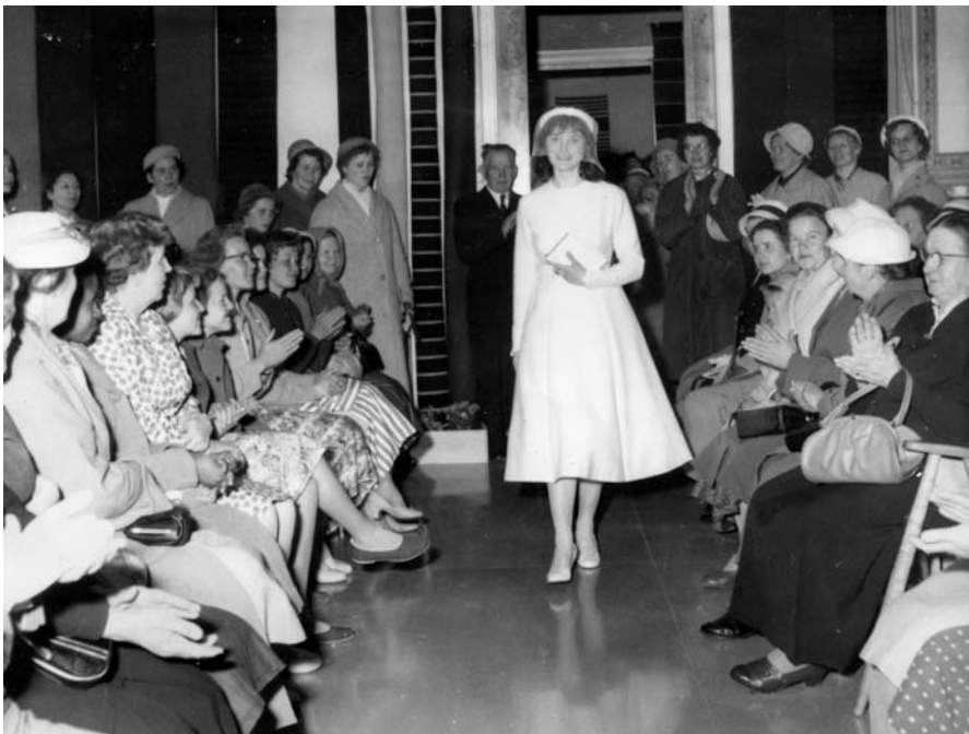
50-luvun muotia Mikkelin naiskotiteollisuuskoulun (nyk. Mikkelin ammattiopisto) kevätnäytöksessä vuonna 1959.

Varsinaisesti käsi- ja taideteollisuuskoulut siirtyivät uusittuun peruslinjajärjestelmään vuonna 1985. Kentällä peruslinjat otettiin hyvin vastaan. Käytännössä ajatus eri asteisten tutkintojen yhteisestä yleisjaksosta ei toiminut, sillä osa opiskelijoista halusi hakea suoraan tavoittelemansa tasoiseen tutkintoon. Alan yleis-