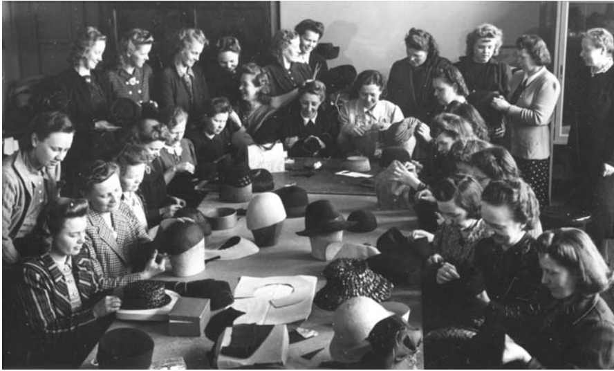
50-luvulla hyvin pukeutuva nainen käytti aina hattua, joten modistien ammattitaidolle oli kysyntää. Naisia koulutettiin alalle mm. Ammattienedistämislaitoksen hattukursseilla Helsingissä.

tilalle tulivat kaksivuotiset yleiset ammatilaiskoulut, joissa jo ammatissa toimivat saattoivat opiskella työn ohessa iltaisin. Ne menettivät kuitenkin pian merkityksensä. Kolmas koulutyyppejä oli kokopäiväiset, tiettyyn ammattiin kouluttavat ammattioppilaskoulut eli erikoisammattikoulut, joissa opiskeltiin sekä käytäntöä että teoriaa. Ammattioppilaskoulujen tarkoitus oli korvata käsityöläisammattien työssäoppiminen. Koulun käyminen oikeutti suorittamaan ammattitutkinnon, joten koulutus vastasi täysin työssäoppimisen ja yleisen ammatilaiskoulun yhdistelmää. Koulutusajan pituus määräytyi opiskeltavan ammatin mukaan. 34