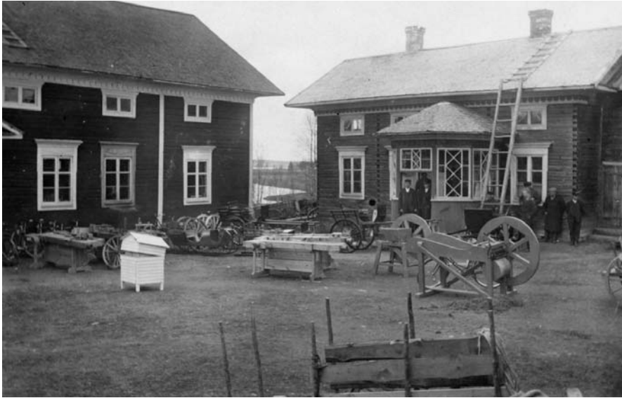
Etelä-Pohjanmaan kotiteollisuusyhdistyksen ylläpitämän mieskotiteollisuuskoulun päättäjäisnäyttely kesällä 1912 Jalasjärvellä, jossa esillä oli mm. mehiläispesä, höyläpenkkejä, silppureita, ajokaluja ja kärrynpyöriä.

kotitalousneuvonnan piiriin. Ompelun opetus oli melko samanlaista sekä maalla että kaupungissa. Kudonta sen sijaan kuului maalaisemännän taitoihin. Se oli naisten kansanperinteen kuningaslaji, jota ei kuka tahansa osannutkaan. Kudonnan oppikirjoissa korostetaan, miten tärkeää on sisustaa vaatimattomakin maalaistuvat sananmukaisesti ”kotikutoisesti” eikä ostokankailla. 86 Kuvaavaa on, että sisustustekstiilit levisivät esimerkiksi Pohjois-Karjalaan vasta kotiteollisuuskoulujen mukana. Miesten kotiteollisuuskouluissa taas olisi haluttu opettaa teknisempiä ja ajanmukaisempia taitoja kuten maatalouden koneiden ja ajokalujen tekemistä. Miesten opetuksessa perinteen säilyttämistä oli itse käsillä tekeminen, ei niin-