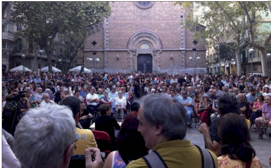
Presentació de Guanyem a la plaça de la Virreina el passat setembre