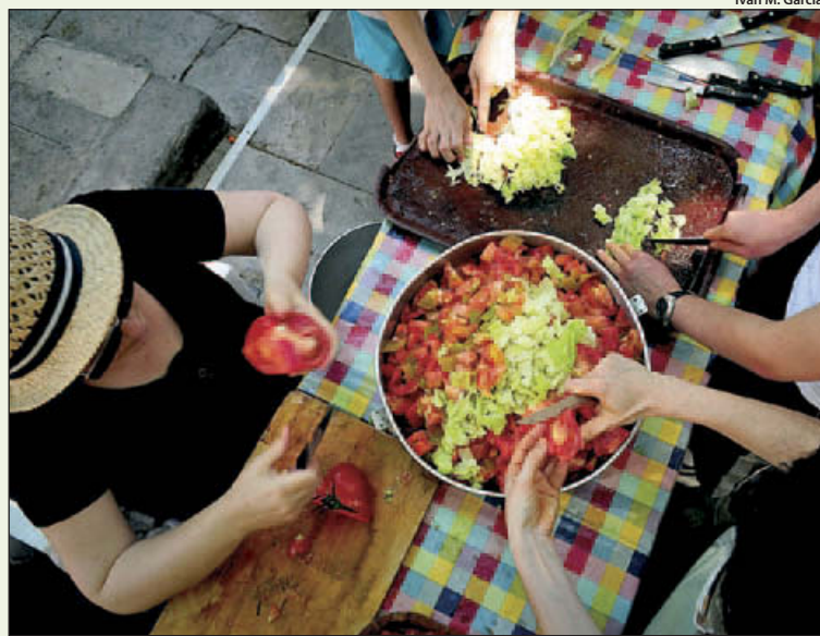
Cuinant pel dinar del mercat d'intercanvi celebrat a la Virreina el juny de 2013

Cada dia es llença una quantitat insultant d'aliments en bon estat que es poden reaprofitar. El passat diumenge, sense anar més lluny, un grup de persones van dinar amb el que tres parades de l'Abaceria havien llançat el dia abans. Per donar visibilitat a la problemàtica i crear una estructura autogestionada i de participació, va sorgir des de l'Assemblea de la Vila el projecte el Plat de Gràcia.