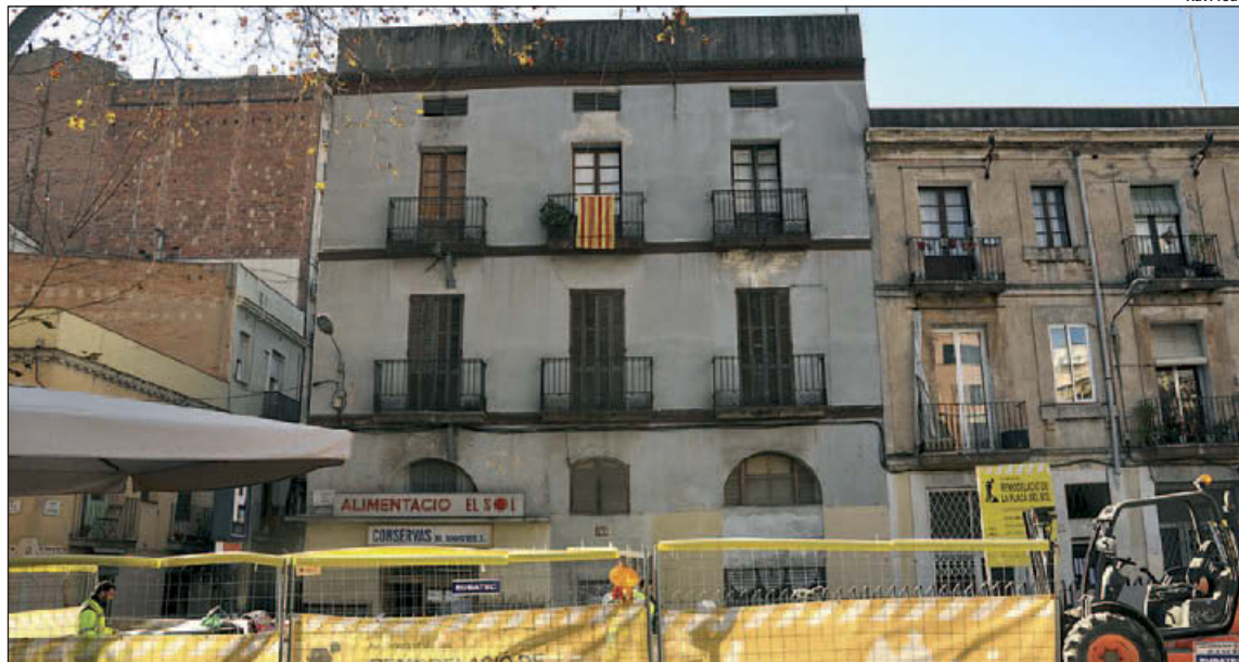
Edifici que acollirà el primer hotel a la plaça del Sol, ubicat al número 23