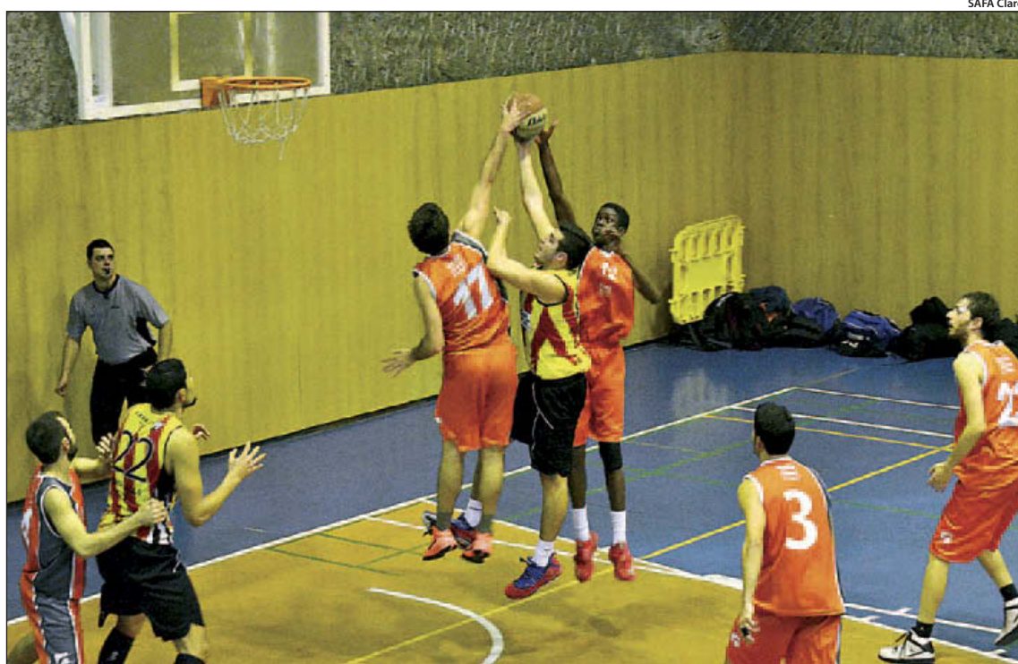
El SAFA, líder del seu grup, té la millor defensa de la lliga

Un objectiu que, malgrat ocupar el primer lloc, no ha variat: "Ara mateix treballem per les quinze victòries que ens permetrien mantenir-nos a Primera i després sí que lluitarem per l'ascens". La clau de l'èxit, a parer seu, és "el compromís i el bon ambient que hi ha a l'equip amb l'afegit que "anar guanyant ajuda". Més enllà d'aquestes virtuts, els números parlen per sí mateixos i el SAFA és l'equip que ha encaixat menys punts: "Tenim la millor defensa de la lliga, som un equip molt sòlid que creixem des de la defensa". En el seu segon any a Primera, el SAFA somia a tornar a Copa on fa cinc temporades hi va ser per darrera vegada. El Vedruna, en canvi, no hi ha jugat mai. No és d'estranyar, doncs, que