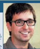
Ernest Cauhé @ernestcauhe