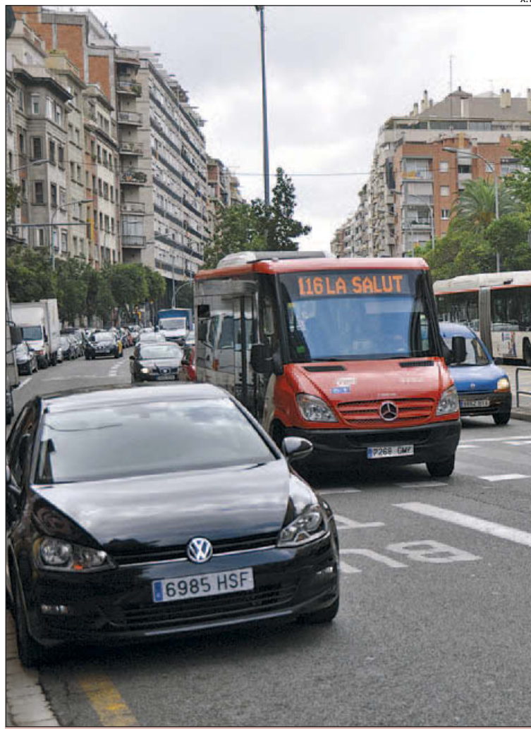
La Travessera de Gràcia es reformarà ampliant voreres

En qualsevol cas, els tècnics han fet la seva feina i l'han interpretat ràpidament: la reforma de Travessera de Dalt seguirà el mateix patró que el tram de Mitre que s'ha arranjat en els últims anys. Voreres amples, mitjana amb palmeres, dos carrils i un més de polivalent per banda. Però a Mitre no hi ha l'afluència turística de Lesseps ni de Larrard cap al Park Güell i s'ha de mesurar encara si l'execució del nou pàrquing de Menéndez y Pelayo tindrà el mateix impacte en la circulació. Per a un altre temps