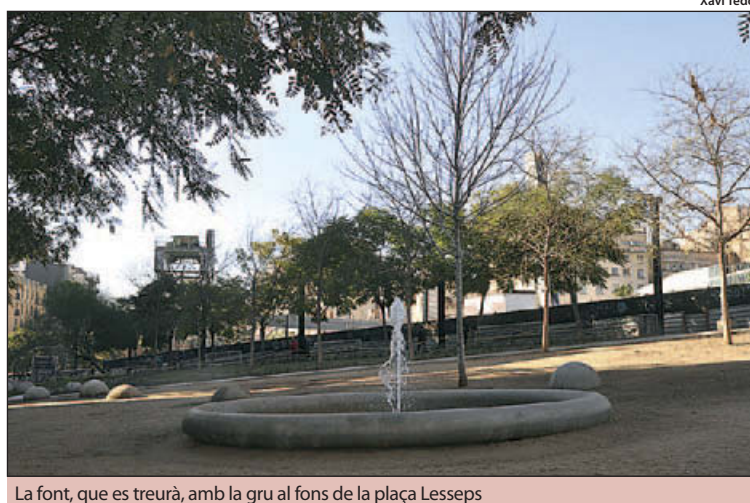
La font, que es treurà, amb la gru al fons de la plaça Lesseps

La sessió informativa sobre el nou projecte de reforma parcial de la plaça Lesseps, emmarcada en un context de polèmica entre el Districte i els veïns favorables als canvis d'una banda i l'equip Via-plana i veïns crítics de l'altra, ha donat com a resultat un calendari i algun matis sobre la reforma que ajudarà a destensar l'ambient. El debat obert, que va propiciar que la sessió durés tres hores i s'allargués dijous passat fins a quarts d'onze del vespre, ha permès sal-