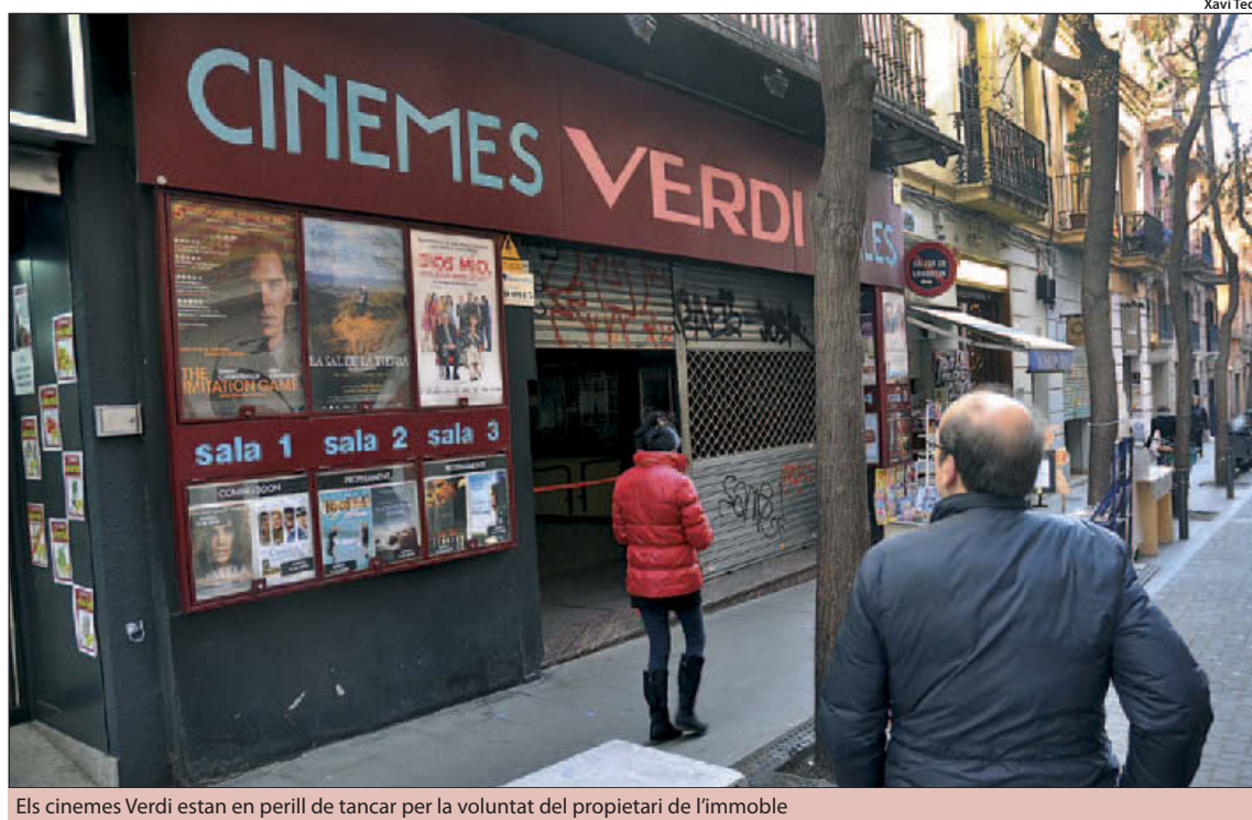
Els cinemes Verdi estan en perill de tancar per la voluntat del propietari de l'immoble