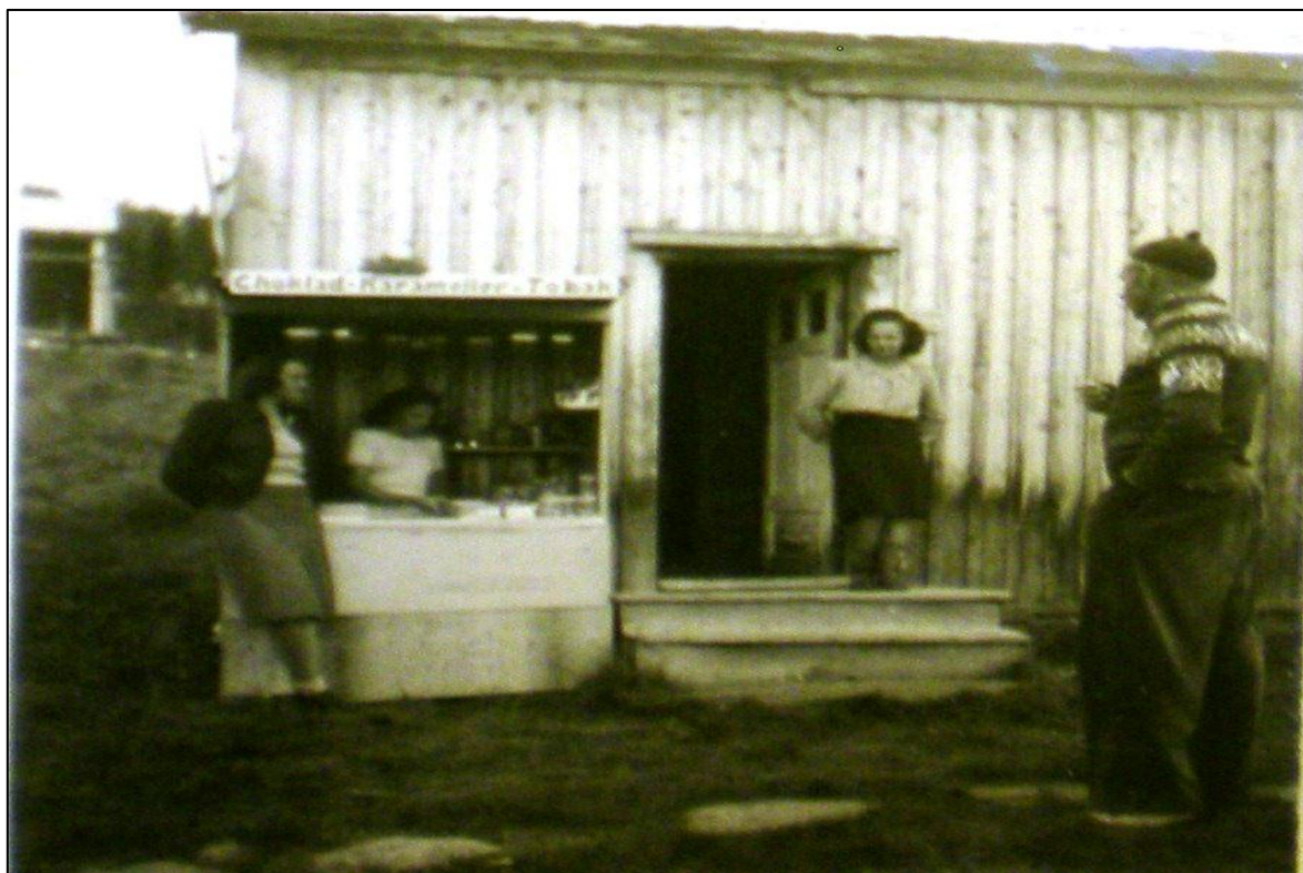
Bild 3. Bilden kallas: "Stånd med snask och tobak utanför huset med 'Cafe' och 'Bar'"