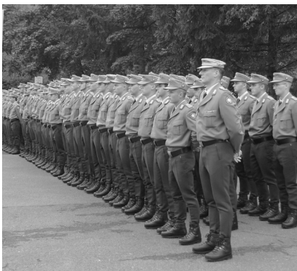
Rekruten bei der Vereidigung auf dem Parkplatz vorm Kurhaus

Wir bitten um Beflaggung an diesem Tag, um die Rekruten und ihre Familienangehörigen zu begrüßen.