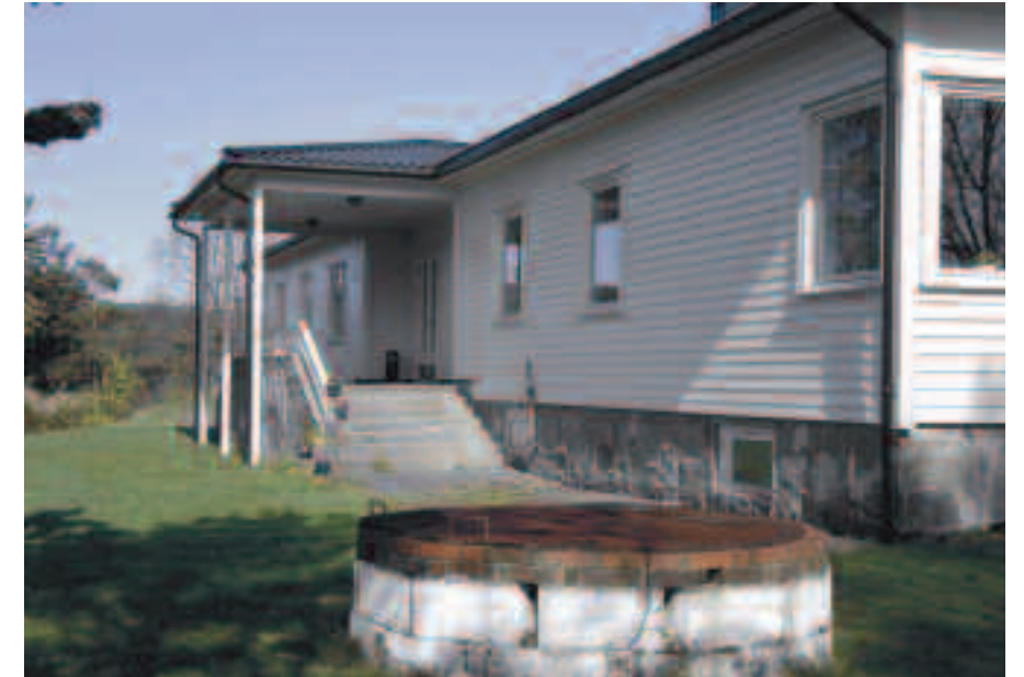
Bygning 84, officersmessen på Gimlemoen

Ved siden av vanlig foreningsvirksomhet har vi to hovedmål i år som nye tilbud til allerede eksisterende medlemmer, og som