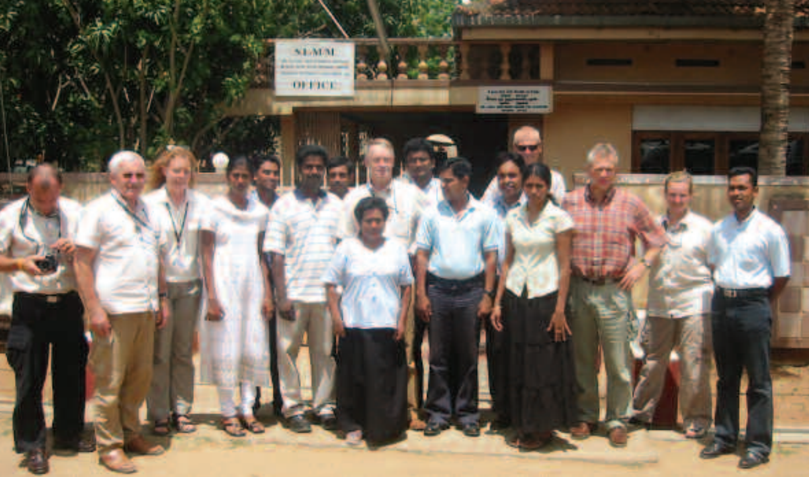
Nordmenn blant Tamiltigre: Norske observatører sammen med lokalbefolkningen.