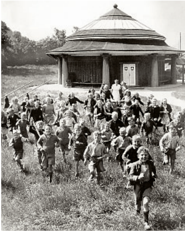
Glade børn foran pavillonen i Wesselsminde Feriekoloni, hvor pavillontjentesomopholds-og spisestueforbørnene. Billedet er udateret, men bilen i baggrunden lader formode, at det er taget i slutningen af 1930'erne.

præget af forståelse for gæstens umiddelbare og givetvis synlige glæde ved, at i hvert fald første fase af et for Foreningen for Bykultur usædvanligt projekt efter mange gode kræfters medvirken så ud til at skulle blive til virkelighed.