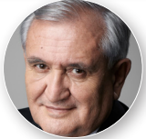
Jean-Pierre Raffarin Président