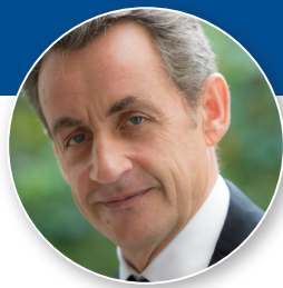
Nicolas Sarkozy Président