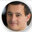
Gérald Darmanin Élections