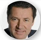
Christian Estrosi Président