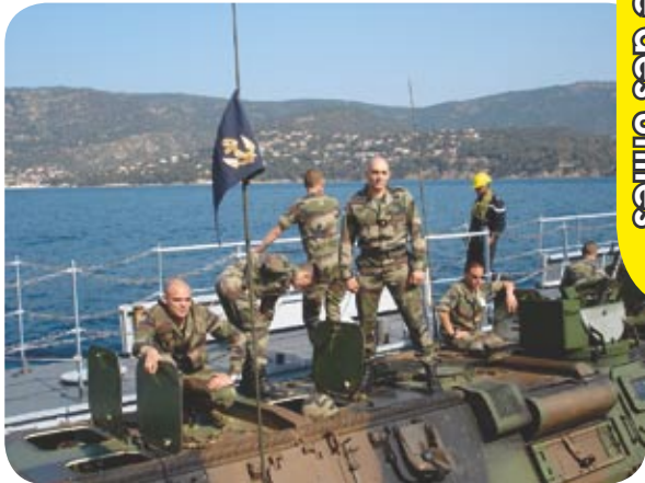
Au large de la Sardaigne

Chères familles, Rentrés de l'exercice «Trident d'or» en mer méditerranéenne, les Forbans auront passé un repos bien mérité dans leurs foyers avant de reprendre la barre vers le large. La section du Lieutenant Gac est depuis plus d'un mois en Guyane en renfort de la compagnie du 2 e RIMa : combat en jungle, séances de tir et service rythment leurs journées. D'autres pirates sont partis renforcer les unités déployées en République Centrafricaine ou au Kosovo. Loin de leur port d'attache et de leur fanion, ils s'évertuent tous à donner le meilleur d'eux mêmes et à représenter avec fierté leur unité. Nos jeunes marsouins