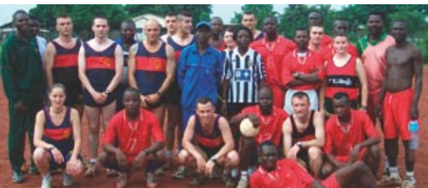
Match de football avec les civils locaux BULLETTIN D'INFORMATION DU 3 e RIMA

La journée s'est poursuivie par la participation d'une délégation à un coquetèlè donné en l'honneur de Madame la ministre.