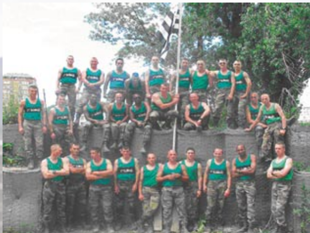
Les Caporaux-chefs au pied du GWENADU.

C'est en temps que Compagnie de Réserve Opérationnelle (C.R.O) qu'ils ont cette fois encore (1 re C.R.O. en 1999) pris pied au centre de toutes les discordes sur