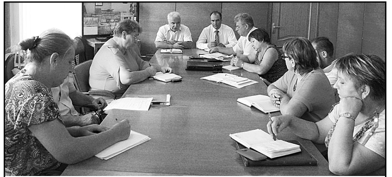
На встрече с министром строительства и жилищно-коммунального хозяйства Калужской области А.В. Пичугиным в администрации района.

Большое внимание было уделено решению наиболее острых проблем по водоснабжению, говорилось о необходимости создания в районе системы утилизации мусора, установки в некоторых поселениях района станции по обезжелезиванию воды.