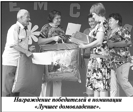
Награждение победителей в номинации «Лучшее домовладение».