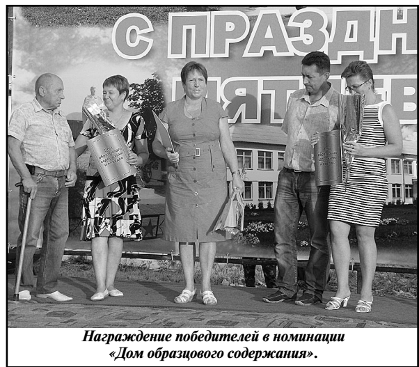
Награждение победителей в номинации «Дом образцового содержания».

Конечно, праздник этот влетел в копеечку поселковому бюджету, но «ко-