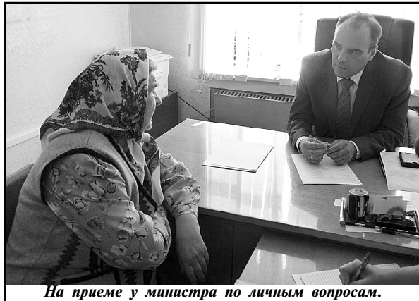
На приеме у министра по личным вопросам.