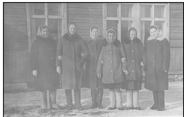
70-е годы. Коллектив Износковского почтового отделения.

Работники культпросветучреждений, народного образования приобщали население к культуре, знаниям. Подавляющее большинство детей посещали шко-