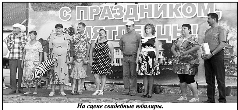
На сцене свадебные юбиляры.

профессиональных и самодельных, пока бабушка не усадила его в коляску.