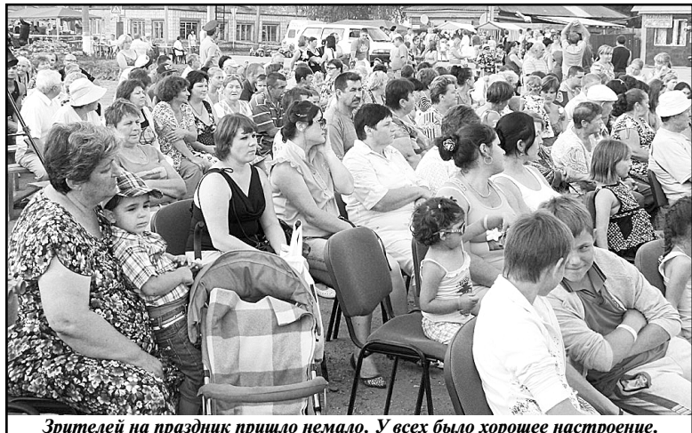
Зрителей на праздник пришло немало. У всех было хорошее настроение.