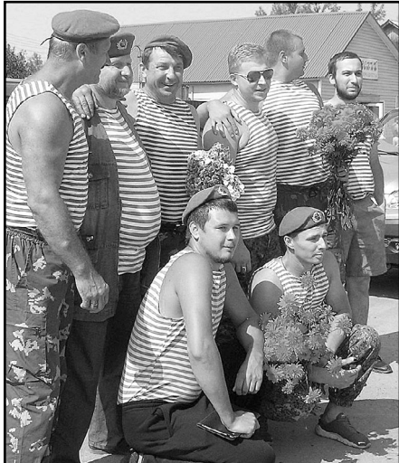
Их объединяет принадлежность к ВДВ - самому быстрому, самому действенному роду войск.