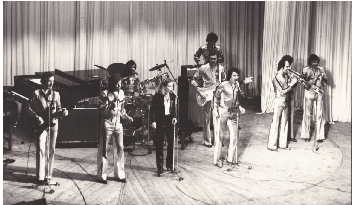
Надо было видеть, что творилось в зале, когда музыканты исполняли песню «Родная земля».