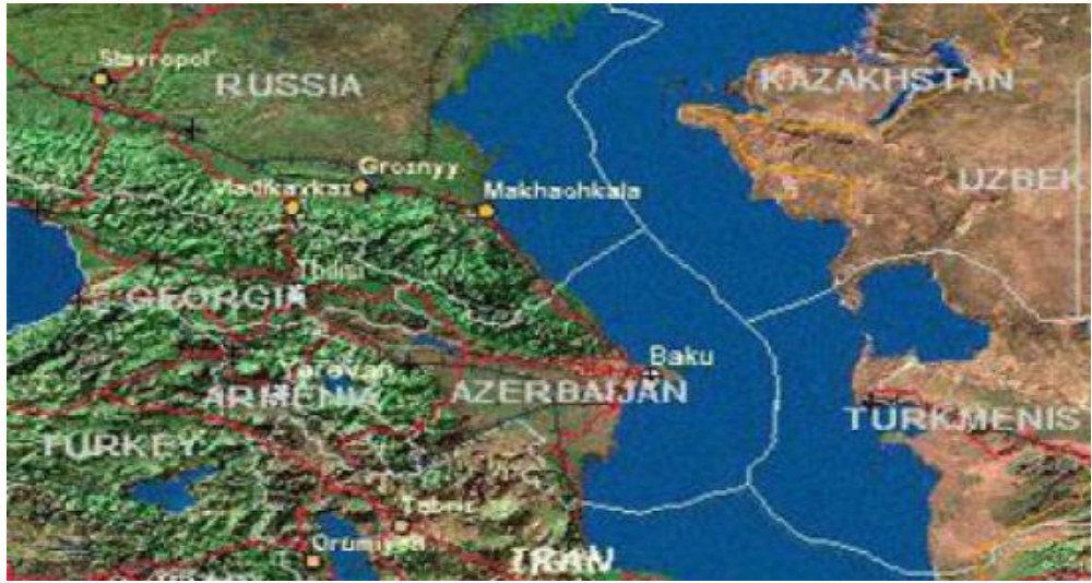
Şekil 3. Hazar'ın Ulusal Sektöre Bölünmesi 141

Ocak 2001'de Azerbaycan'a yaptığı ziyarette Rusya Cumhurbaşkanı Vladimir Putin ve Aliyev arasında Hazar Denizi'nin statüsü konusunda da bir anlaşma imzalanmıştır. Anlaşma deniz yatağının ortak hat boyunca beş kıyıdaş ülke arasında bölünmesini deniz suyununsa ortak kullanımını öngörüyordu. Anlaşmada her kıyıdaş ülkenin kendi bölgesindeki maden kaynakları üzerinde yalnız hak sahibi olduklarına da vurgu yapıyordu.