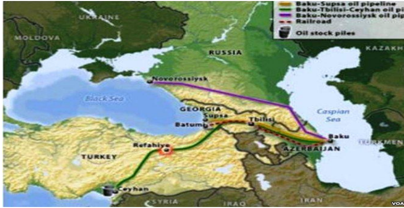
Şekil 1. Hazar petrolünün nakil olunduğu boru hatları 51

24 Mart 1998de Rusya'nın Novorossiysk terminalinden, 8 Nisan 1999'da ise Gürcistan'ın Supsa terminalinden AÇG'nin ilk petrol ihracı gerçekleştirilmiştir. 52